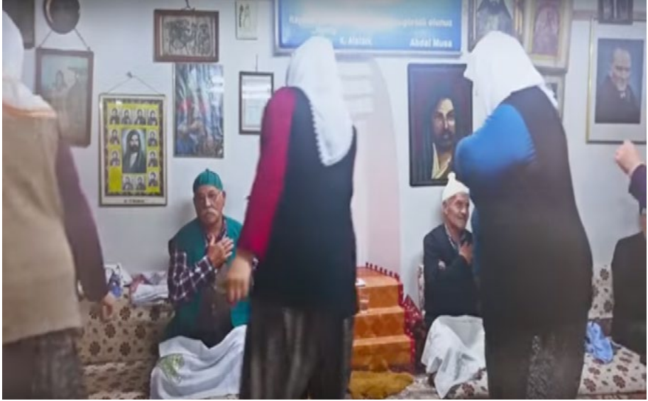
Görsel 3: Abdal Musa Birlik ceminde Kırklar semahı dönen kadınların semah içinde dedeyi selamlaması

Köye has olduğu tespit edilen ezgiler daha çok rast perde düzeninin makamları ile doğrudan ilişkili olup hüseyini, gülizâr, gerdaniye, çargâh ve neva makam nağmelerinin daha yaygın kullanıldığı görülmüştür.