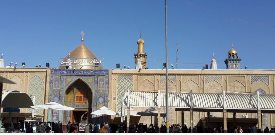
Ek-4. Hz. Ali Külliyesi'nin bu fotoğrafı 21.02.2017 tarihinde tarafımızdan çekilmiştir.