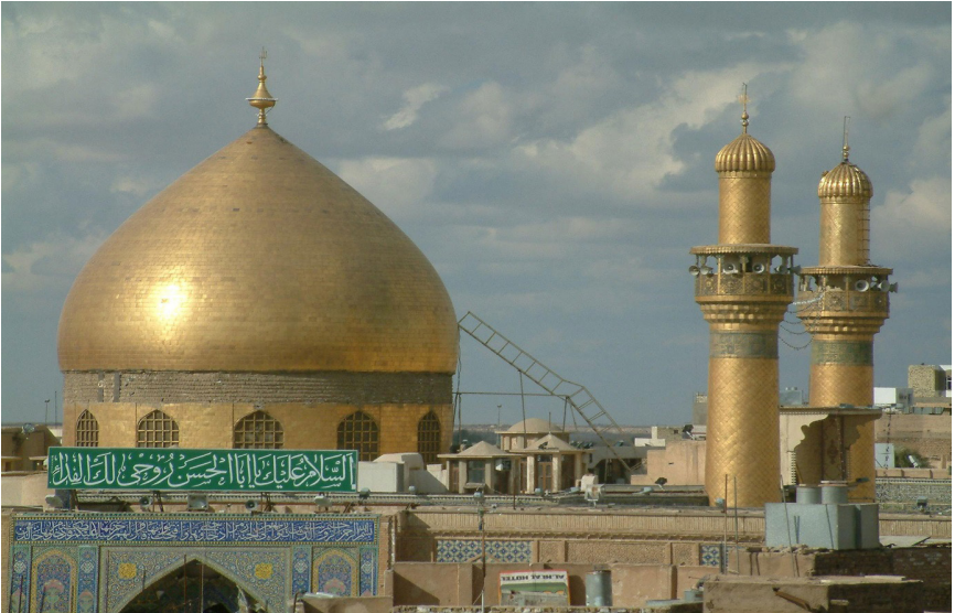
Ek-3. Hz. Ali Külliyesi'nin bu fotoğrafı 21.02.2017 tarihinde tarafımızdan çekilmiştir.