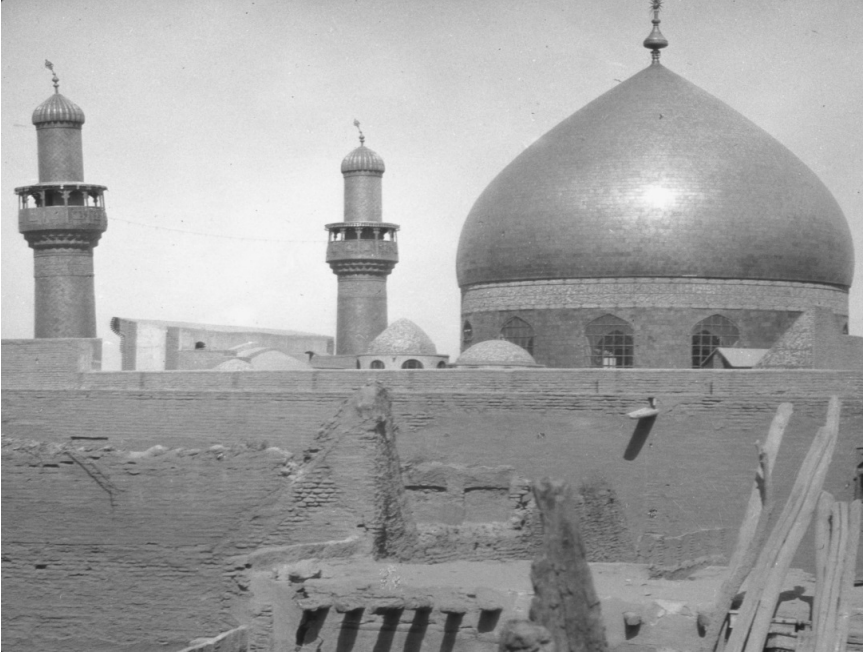
Ek-2. Hz. Ali Külliyesi'nin bu eski fotoğrafı tarafımızdan Irak Müzesi'nden alınmıştır.