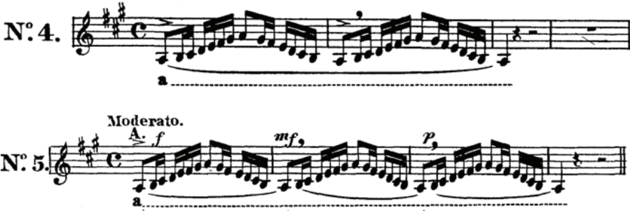
Şekil 4. Dizi Üzerine No: 4 ve No: 5

İki numaralı egzersiz için geçerli olan kurallar burada da geçerlidir. Bu egzersizde beşinci ses genelde daha düşük seslendirilir. Bu nedenle tempo tutarken beşinci ses vurgulanmalıdır.