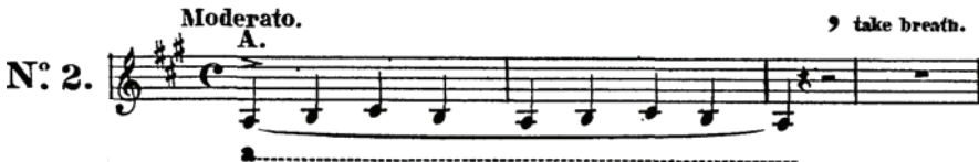
Şekil 2. Üç Ses Üzerine Etüt (Kıvraklık) No: 2

Ses eğitimine başlarken kolayca ve gür bir biçimde çıkartılamayan çok tiz ve çok pes sesler için özel bir pratik yapılmasına gerek yoktur; çünkü bunlar, kolay üretilebilen seslerin çalışılması sayesinde kısa zamanda gelişecektir. Egzersizler kromatik olarak dizeğin altındaki la notasından başlayıp dizeğin üstündeki sol notasına kadar çıkar. Bu şekilde yapılan bir çalışma, öğretmenin öğrenciye egzersizin başlangıç ve bitiş sesini göstermesinde kolaylık sağlayacaktır. (Panofka, 1878).