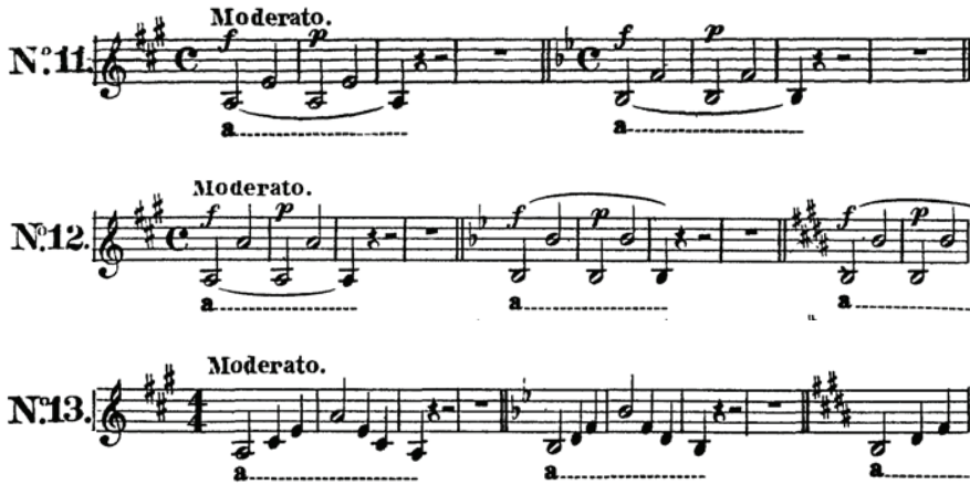
Şekil 9. Portamento Üzerine Etüt No: 11- No: 12- No:13

Üçlemeler ve onaltılık notalarla oluşturulmuş bu arpejlerin, seslendirilmesi entonasyon bakımından büyük bir dikkat gerektirmektedir. Bu nedenle öğretmenin tempo tutarken son sese vurgu yapması gerekir.