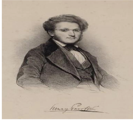
Resim 1. Heinrich Panofka 1