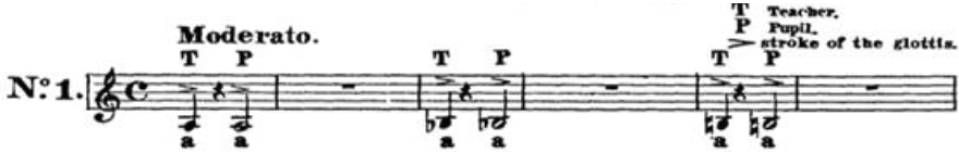
Şekil 1. Sesin Aktarılması Üzerine Etüt No: 1

Heinrich Panofka'ya göre, bir tonun güzel olması için onun saf, açık ve gür olması gereklidir. Saflık, hançerenin küçük bir hareketiyle elde edilir. Bu, mükemmel bir entonasyon elde etmek için güvenilir bir yoldur. Tondaki açıklık "a" vokalinin doğru üretilmesiyle elde edilecektir. Gürlük ise, ağzın uygun ölçüde açılmasına bağlıdır. Ancak sonorite problemleri yaşamamak için ağız açıklığını en doğal şekilde yapmak gerekir.