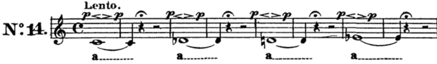
Şekil 10. Seslerin Genişletilmesi Üzerine Etüt No: 14

netliğinin ve nefes kontrolünü sağlanabilmesi için öğrenci çok dikkatli çalıştırılmalıdır. Bu etütlerin hem forte, hem de piano seslendirilmesi portamento tekniğinin kavranması açısından önemlidir.