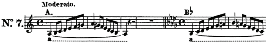
Şekil 6. Minör Dizi Üzerine Ettüt No: 7

Bu etüdün tamamı eşit ve gür bir biçimde seslendirilir. Bu üç dizinin seslendirilmesinde en önemli adım sesin tam yerinin belirlenmesidir. Hançere bir tür klavye hâlini almalı ve her bir sesin yeri net olmalıdır. Öğrenci söylemeye başlamadan önce çıkartacağı sesi düşünürse, yanlış söyleme ihtimali azalır.