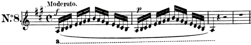
Şekil 7. Genişletilmiş Oktav Üzerine Ettüt No:8

Melankolik bir karaktere sahip bu dizi seslendirilirken çok dikkat edilmelidir. Bunun nedeni, çıkıcı dizinin altıncı ve yedinci sesleri arasında bulunan artmış ikili aralığını seslendirmedeki zorluktur. Bu etütte öğrencilerin en dikkat etmesi gereken husus bu aralığın entonasyonudur.