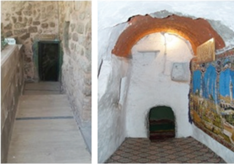
Resim 2: Somuncu Baba Çilehanesi- Aksaray