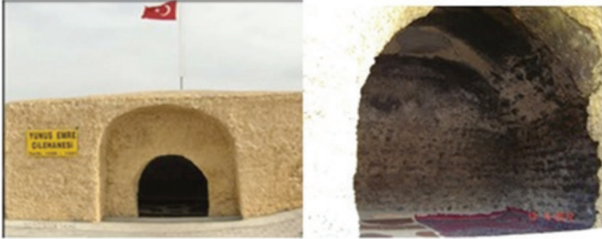
Resim 4: Yunus Emre Çilehanesi (1239-1321) – Aksaray