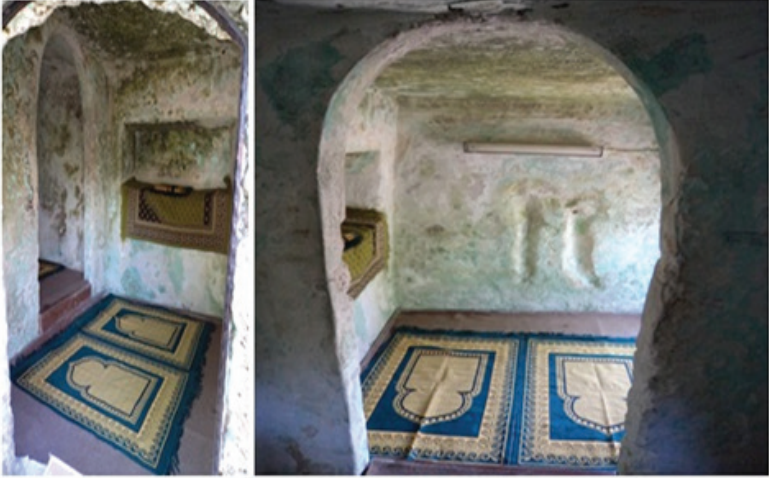
Resim 7: Çilehanenin giriş mekânı, karşı duvarda seccade koyulan niş ve yan odaya geçiş görülmektedir. Sağdaki resimde ise yan odadan giriş mekânının görünümü görülmektedir