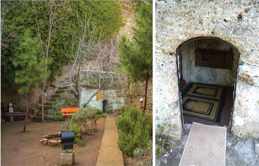
Resim 6: Çilehanenin dışarıdan görünümü ve dış kapıdan giriş