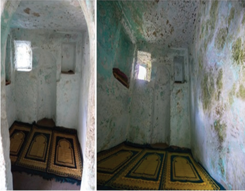
Resim 8: Çilehane iç odada kibleye bakan duvarda mihrap, niş ve pencere boşluğu (Soldaki fotoğraf yazar tarafından belgelenmiştir, http://www.canakkale.gov.tr/tr/canakkale-fotografлари/gelibolu/gelibolu-cilehane )