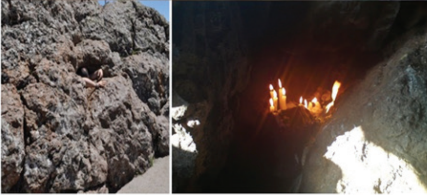
Resim 3: Hacı Bektaş Veli Çilehanesi- Nevşehir ( http://www.arastiralim.net/haci-bektas-dergahinda-mahzuni-ve-delikli-tas.html )