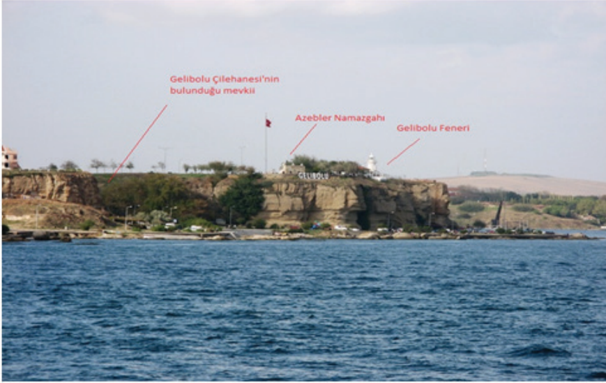
Resim 5: Denizden Gelibolu Fener mevkii ve çilehanenin konumu