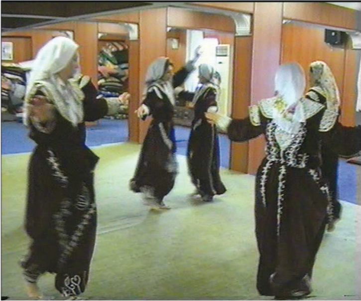
Fotoğraf 30: Hoplatma Dedeyi Temsilen Halkanın Ortasında Pervazcının Etrafında Elleri Kenetleyip Dönme