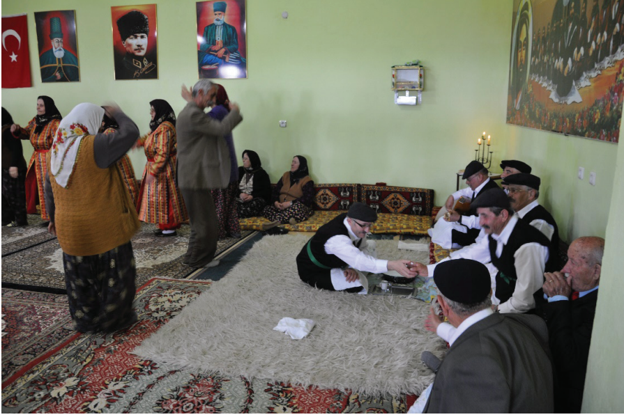
Fotoğraf 19: Dem Geldi Semahı Dönülürken Âşîğın Okuduğu Nefeste Dem Sözü Geçince Sâki Dem Dağıtırken