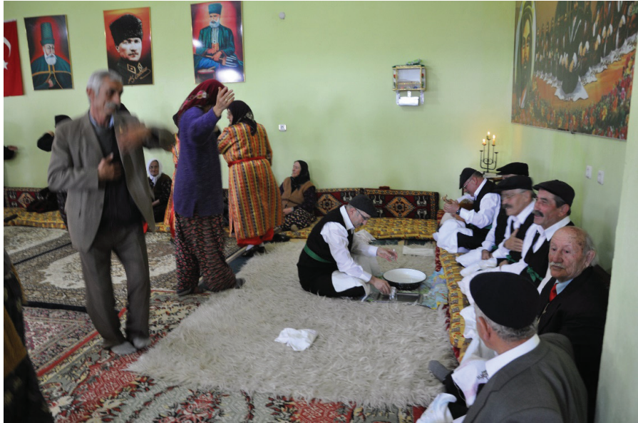
Fotoğraf 20: Veli Baba Sultan Ocağı, Meydanda Halka Halinde Semah Dönerlerden Bir Enstantane