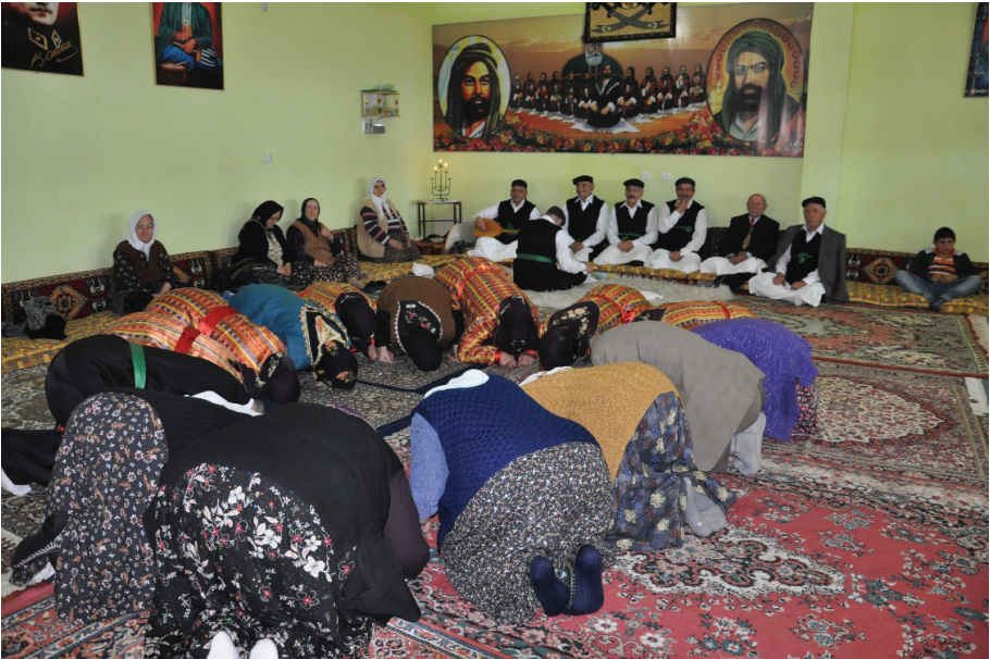
Fotoğraf 22: Veli Baba Sultan Ocağı Duadan Sonra Yere Niyaz Eden Semahçılar