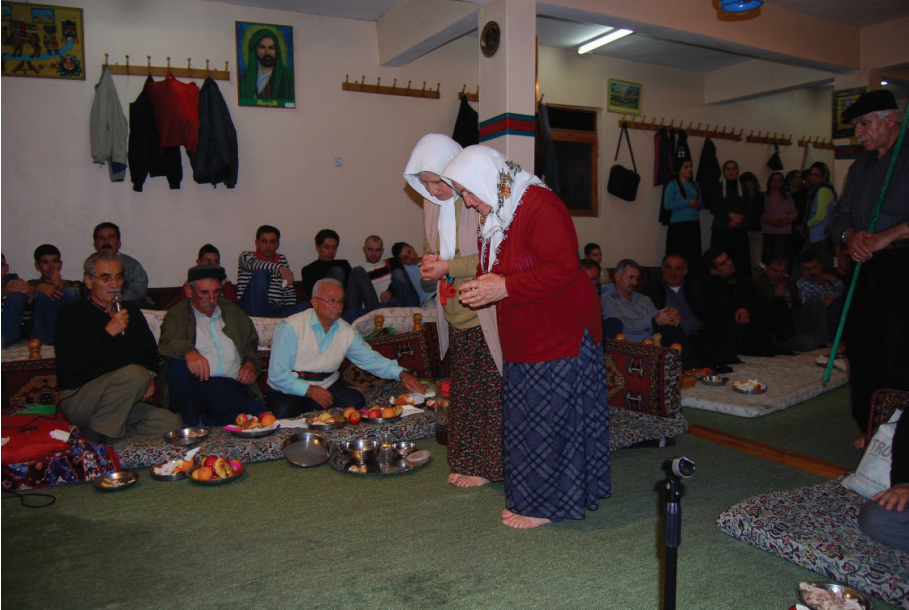
Fotoğraf 15: Çankırı Şabanözü Mart Köyü, Kadıncık Ana ve Gaip Erenler Dolusu Sunan Kadınlar