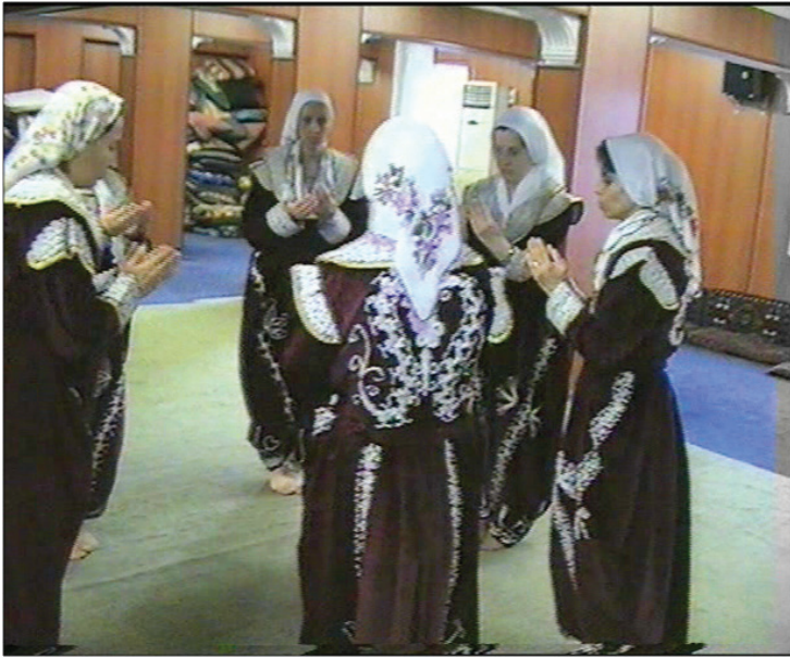
Fotoğraf 24: Eskişehir Seyitgazi Arslanbeyli Köyü, Dem Geldi Semahı Ağrlama