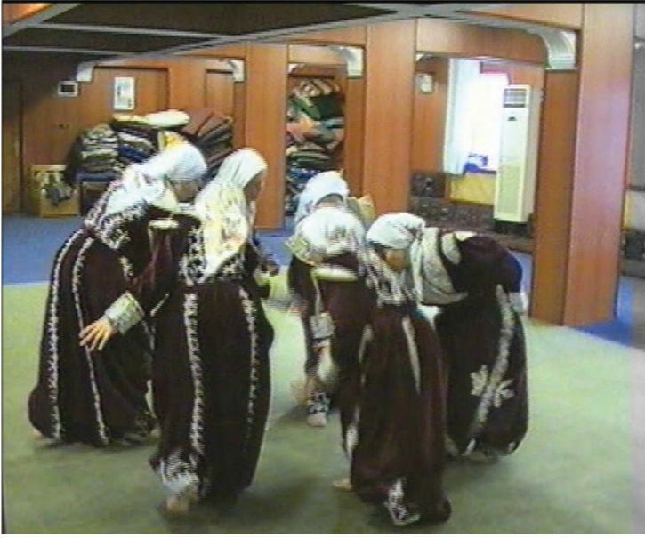
Fotoğraf 27: Eskişehir Seyitgazi Arslanbeyli Köyü, Dem Geldi Semahı Karşılama Yere Niyaz