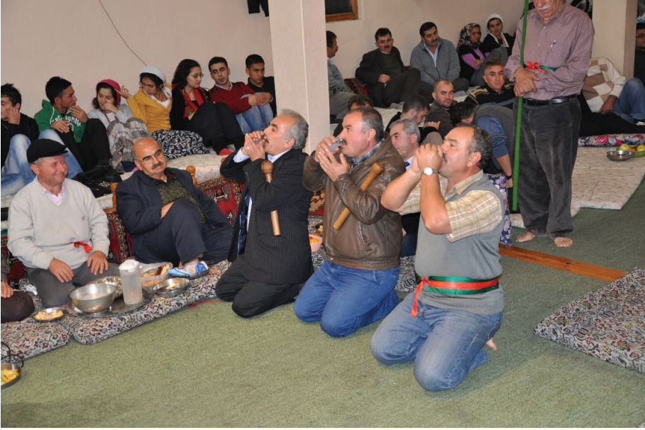
Fotoğraf 14: Çankırı Şabanözü Mart Köyü, Yasavur ve Pazvantlar Hizmet Dolusu Alırken