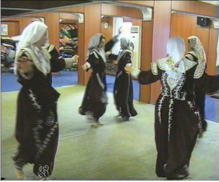
Fotoğraf 29: Dem Geldi Semahı Hoplatma Dedeyi Temsilen Halkanın Ortasında Pervaz Dönen Semahçı