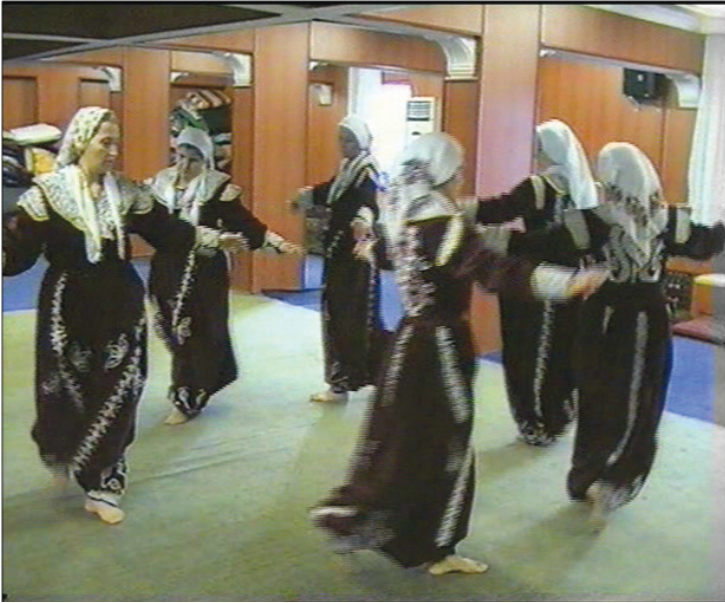
Fotoğraf 28: Eskişehir Seyitgazi Arslanbeyli Köyü, Dem Geldi Semahı Karşılama Pervaz Dönme