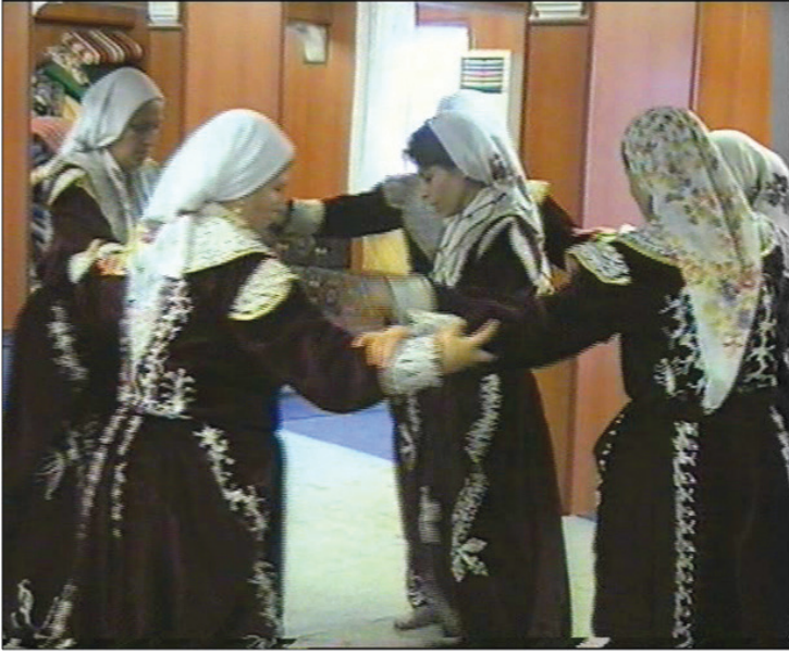
Fotoğraf 31: Hoplatma Dedeyi Temsilen Halkanın Ortasında Pervazcının Etrafında Elleri Kenetleyip Dönme