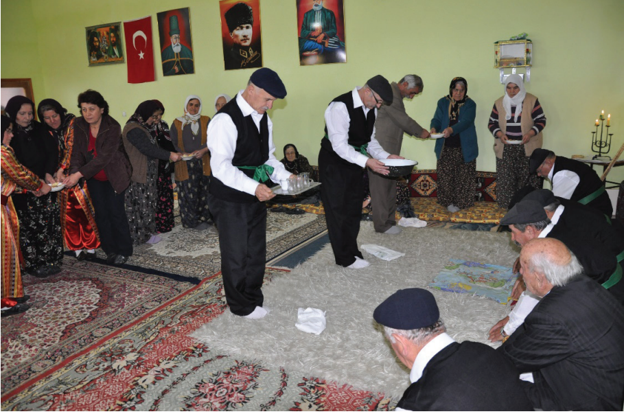
Fotoğraf 17: Demin Meydana Lokmalarla Birlikte Dualanmak Üzere Gelişi

“Bismişah Allah Allah, Ellerimiz dolu olsun, hep gönüller Gani olsun. Yardımcımız Şâh-ı Merdan Ali olsun. Yiyenlere helâl, yediren canlara delil olsun. Kızıldeli, Akyazılı Sultan Efendimizin dem-i devranı yürüsün. Gerçeğe Hü!”