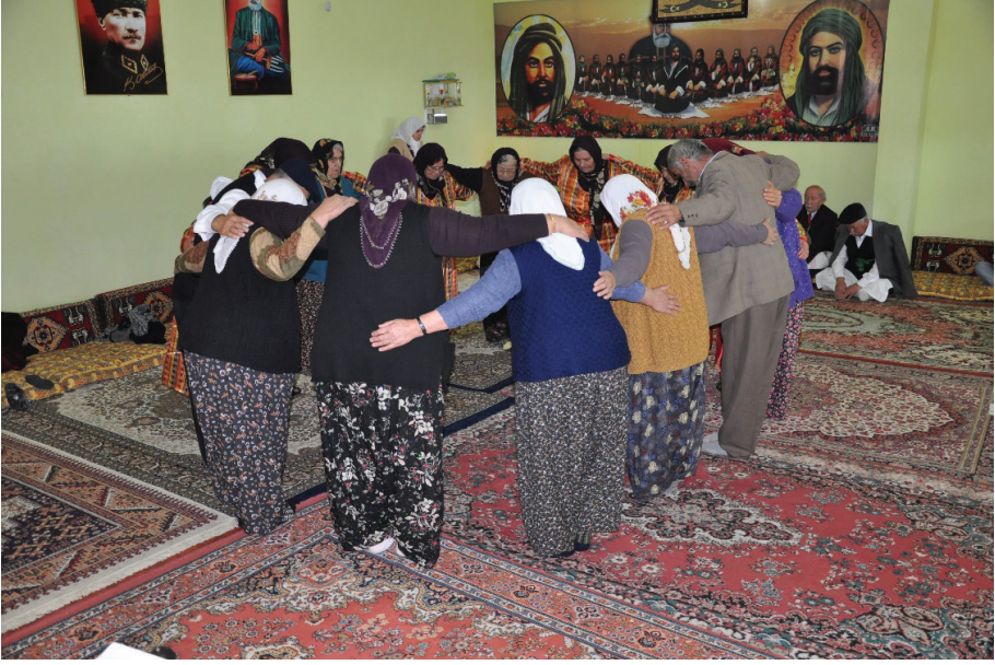
Fotoğraf 21: Veli Baba Sultan Ocağı, Semah Tamamlanınca Dualarını Alan Semahçılar