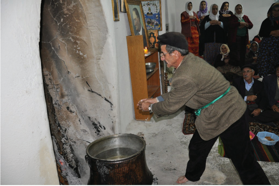
Fotoğraf 12: Ankara Çubuk Yukarı Emirler Köyü, Ocağa Dem Sunma (Gürgür Baba Dolusu)