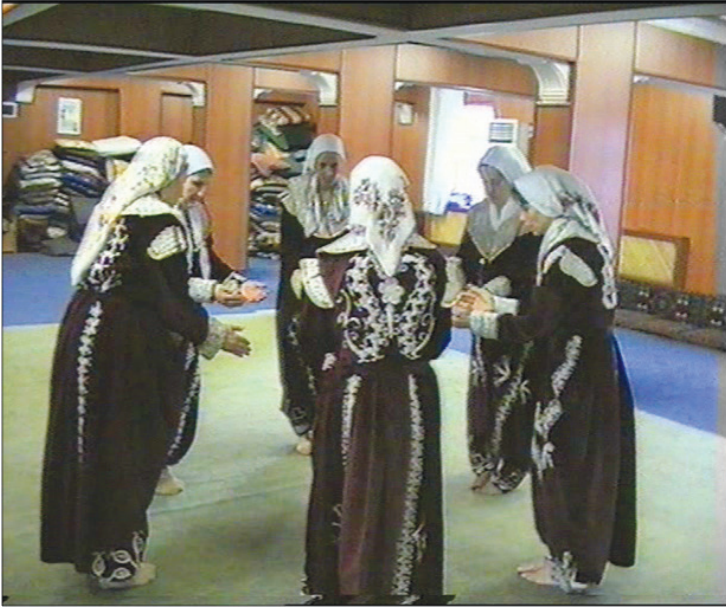
Fotoğraf 23: Eskişehir Seyitgazi Arslanbeyli Köyü, Dem Geldi Semahı Ağrlama