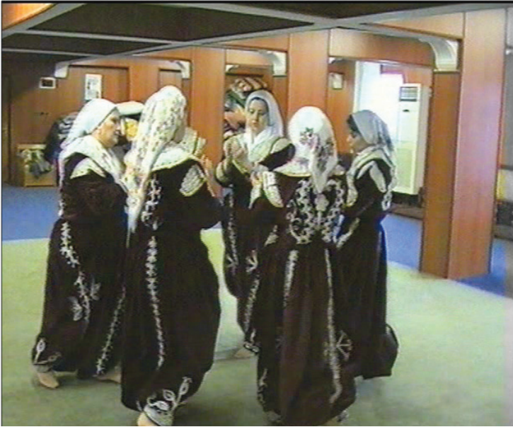
Fotoğraf 26: Eskişehir Seyitgazi Arslanbeyli Köyü, Dem Geldi Semahı Karşılama