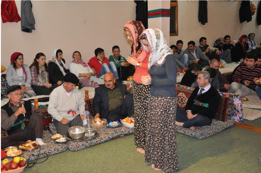
Fotoğraf 5: Çankırı Şabanözü Mart Köyü Sâki Yardımcısı İki Genç Kız