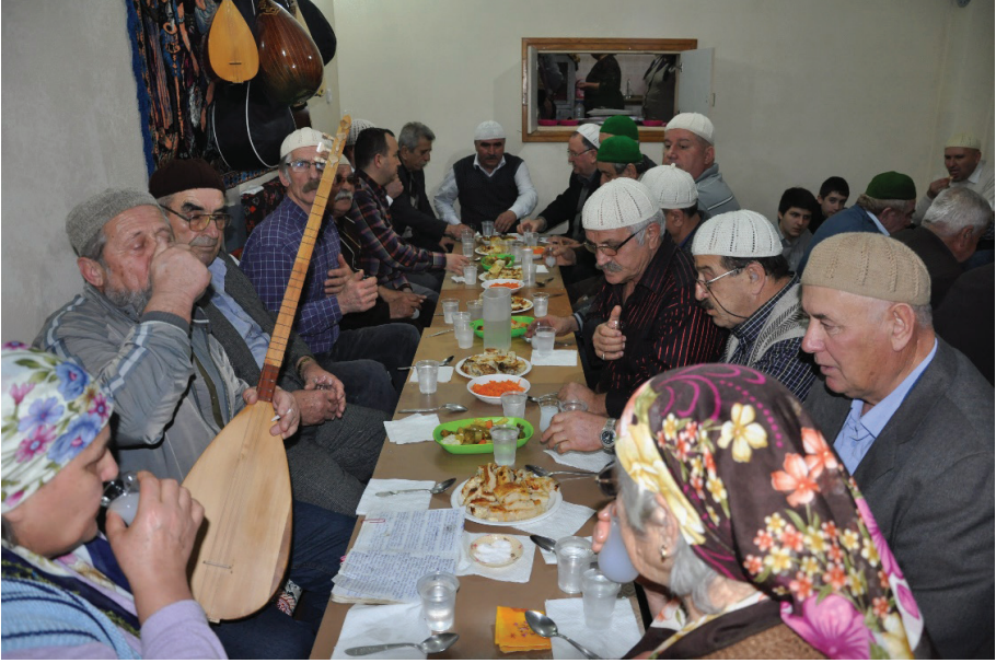
Fotoğraf 9: Tekirdağ Çorlu Çeşmeli Köyü, Âşıklık Hizmeti Sonrası Dem Alma