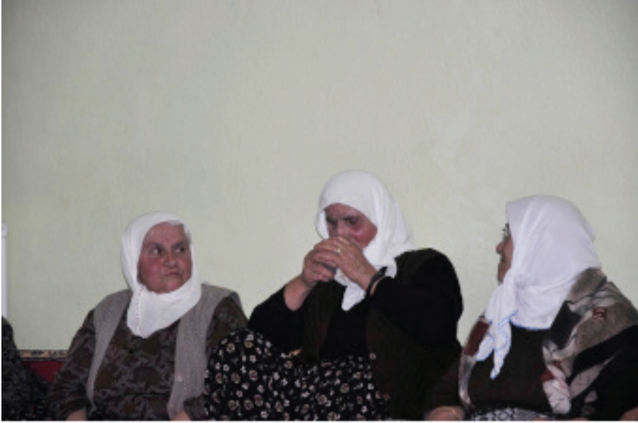
Fotoğraf 11: Isparta Senirkent Uluğbey Beldesi, Geçmişler Demi Alan Kadın Talip

Dem ile ilgili farklı bir pratiği de Tahtacı Alevilerinde tespit ettik. Tahtacı Alevilerinde ölüm merkezli birçok pratik vardır. Bunlardan bir kısmı da ölüm sonrası mezar başında icra edilmektedir. Çanakkale Ayvacık Uzunalan köyünde yaptığımız saha araştırmasında ölünün sevdiği meyve ve içeceklerin mezarına götürüldüğünü tespit ettik. Ölmeden önceki yaşantısında içkiyi seven bireylerin mezarının başına gidilerek içki içildiği ve her kadehte bir kabre içki döküldüğü kayıt altına alınmıştır. Mezar başında yemek yeme ve içki içme ile ilgili uygulamalara Çuvaş Türklerinde de rastlanılmaktadır (Güzel, 2015: 106).