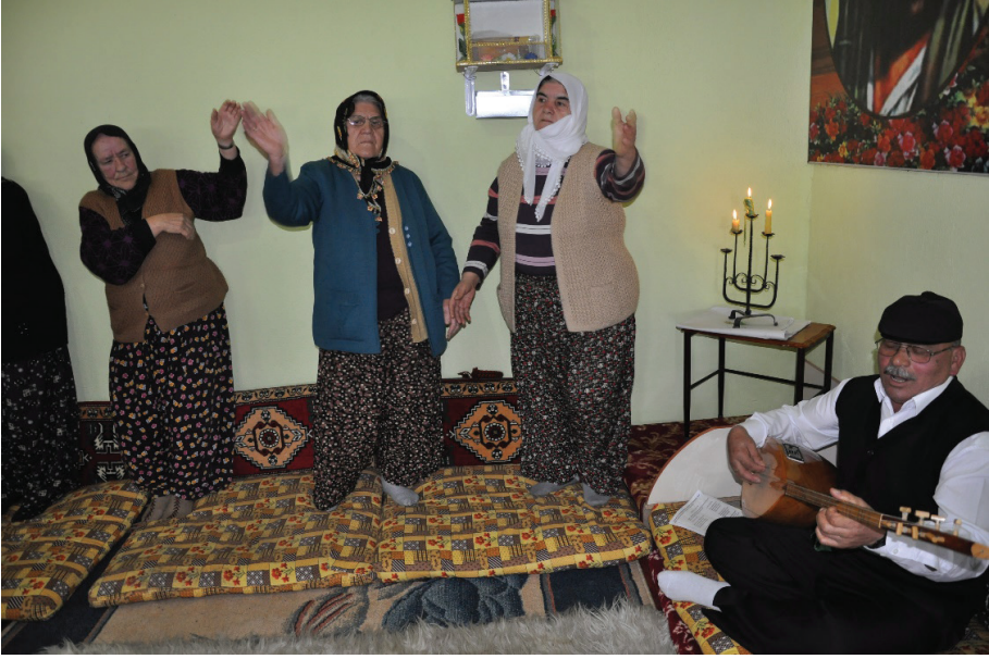
Fotoğraf 18: Veli Baba Sultan Ocağı, Yerlerinde Ayağa Kalkarak Dem Geldi Semahı Döner Kadın Talipler

Dede gülbengini verince Eskişehir bölgesinde Sücaeddin Veli Ocaklılarının Dem Geldi Semahı son bulur. Semahın hoplatma bölümünde icra edilen eser ve icra şekli Alevi ocaklarında tespit ettiğimiz Kerbela Semahlarına benzemektedir. Semahın hoplatma kısmında Kerbela hadisesi ve orada Hz. Zeynelabidin'in Ehlibeyt kadınları tarafından kurtarılışı canlandırılmaktadır. 19