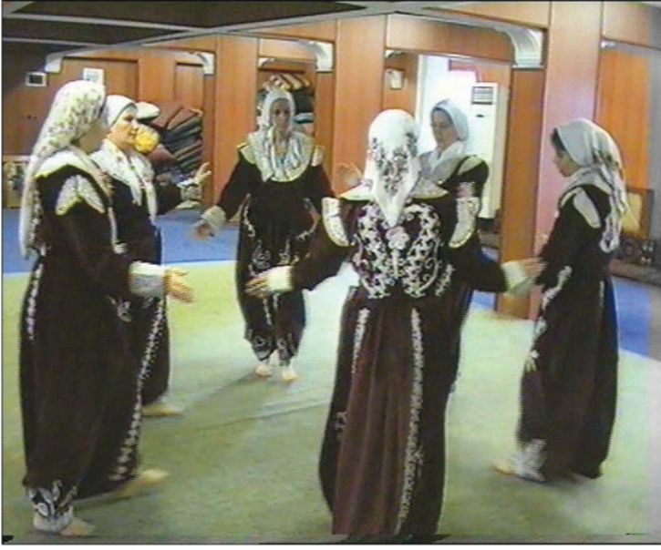
Fotoğraf 25: Eskişehir Seyitgazi Arslanbeyli Köyü, Dem Geldi Semahı Karşılama