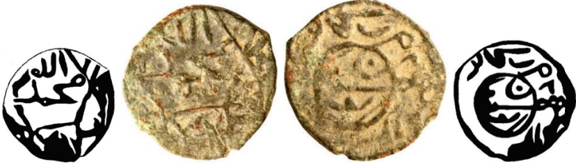
Resim 7. Ç.:15.5x15.3 mm, A.:1.006 gr. AE. RRRR. Fels.