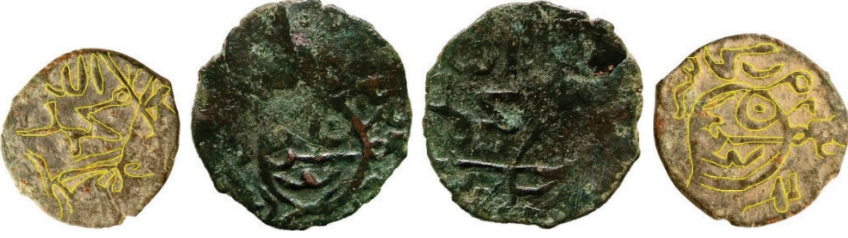
Resim 8. Ç.:17 mm, A.:1.15 gr. AE. RRRRR. Fels.