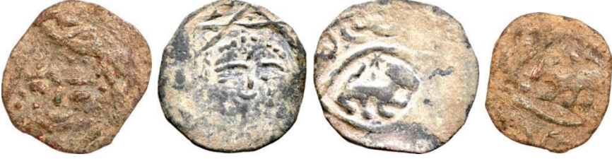
Resim 6. Ç.:19 mm, A.:1.52 gr. AE. RRRR. Fels.