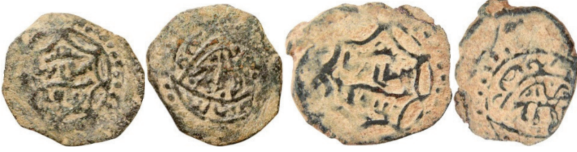
Resim 18. Ç.:18.7 mm, A.:1.40 gr. AE. RR. Fels.