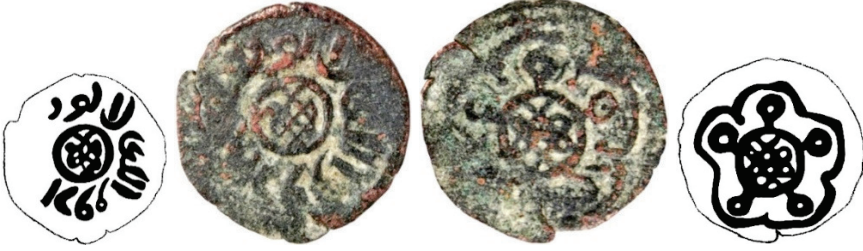
Resim 12. Ç.:18.17.8 mm, A.:1.565 gr. AE. RRRR. Fels.

Ön yüzünde çember içinde saadet düğümü, etrafındaki yazıda sultan-ı Erzurum ?, arkasında çember içinde saadet düğümünün kenarlarında beş yapraklı-pentafoil yer almaktadır. Sikkenin bugüne kadar literatüre kaydedilmiş okunabilir bir örneği tespit edilememiştir. Bulunduğu yerin Erzurum olması sebebiyle, Mutaharten ya da İlhanlı sikkesi şeklinde kabulü söz konusudur. Kâmil Eron tarafından Anonim İlhanlı felsi olarak sınıflandırılmıştır (Zeno 257127).