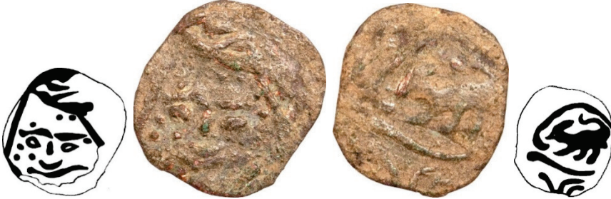
Resim 5. Ç.:14.5x13 mm, A.:928 mg. AE. RRRR. Fels.