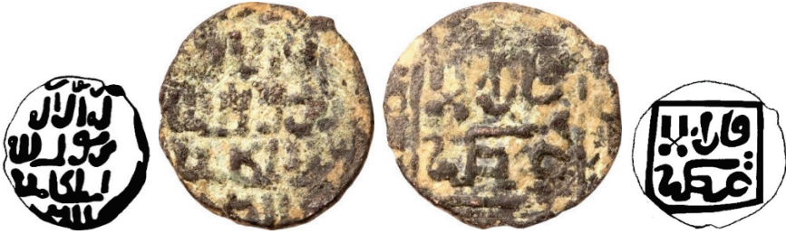
Resim 9. Ç.:18.5x17.5 mm, A.:1.864 gr. AE. RRRRR. Fels.

سيواس لاله الا الله محمد رسول الله السلطان ملك الله قان لاعظم