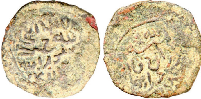
Resim 15. Ç.:20x19.5 mm, A.:2.092 gr. AE. RR. Fels.

لا اله الا الله محمد رسول الله ضرب ارزنجان المنة الله غازان قان محمود