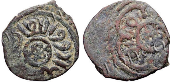
Resim 13. Ç.:18.5x18 mm, A.:2.211 gr. AE. RRRR. Fels. Resim 14. Ç.:19 mm, A.:2.36 gr. AE. RRRR. Fels.

Ön yüzünde çember içinde saadet düğümü, etrafındaki yazıda sultan-ı Erzurum ?, arkasında çember içinde saadet düğümünün kenarlarında beş yapraklı-pentafoil yer almaktadır. Kâmil Eron'a ait olan bu örneğin bir yüzündeki yazılar daha nettir, duribe Erzurum ve sultan yazısı açıkça okunabilmektedir. www.zeno.ru'da yer alan örnekler, bu sikkenin diğer kısımlarını okumak için yeterli olan detayları ihtiva etmemektedir (Eron 7214).