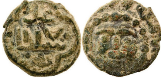
Resim 4. Ç.:14.x13 mm, A.:1.939 gr. AE. RRRRR. Fels.

لعادل سلطان حلد ضرب ارزروم لاله الله محمد رسول الله