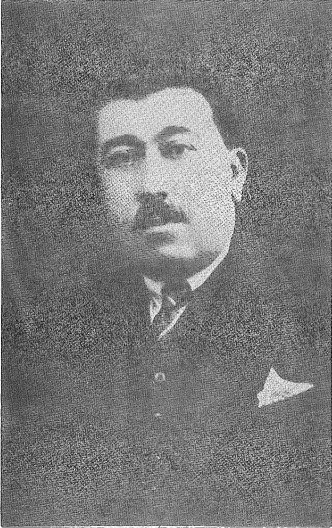
Ali Cemal Bardakçı'nın 22 Ocak 1932'de Çorum Valisi iken çekilmiş bir fotoğrafı.