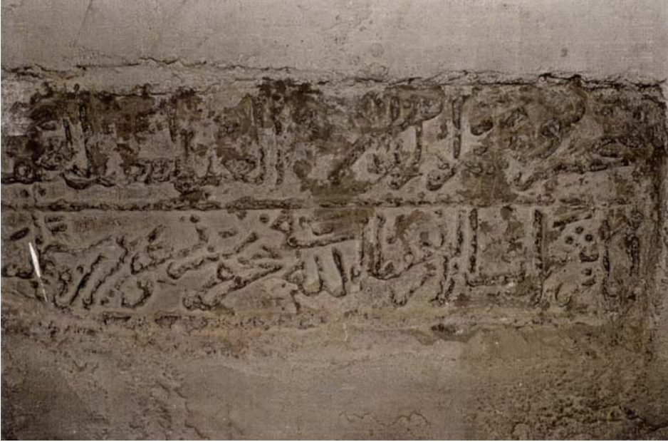
Resim-8 En-nahif Ayaz-ı Şarab-sâlâr afaullah fi Muharrem sene tis'un ve işrine ve sittemie ( 629/1231)