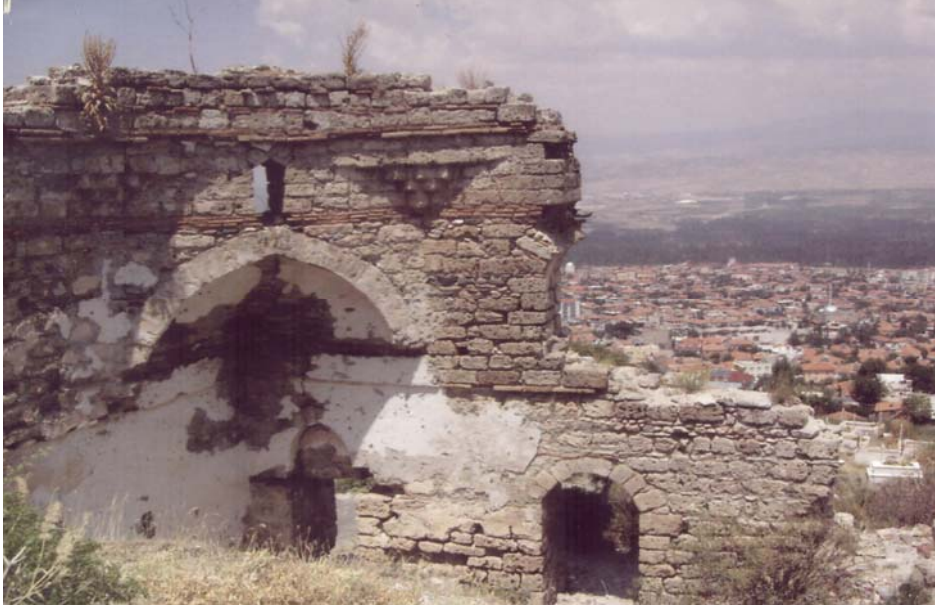
Resim-2 Eski Honaz