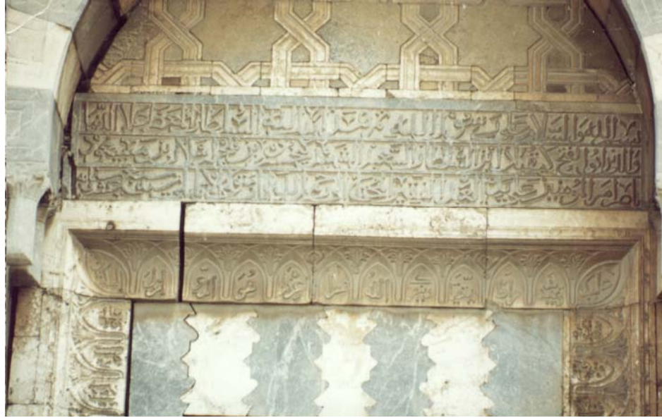
Resim-6 (Bu kitabeye göre camii mütevellî Atabeyi Ayaz'ın elinde Alaeddin Keykubad zamanında 617 yılında tamamlanmıştır.)