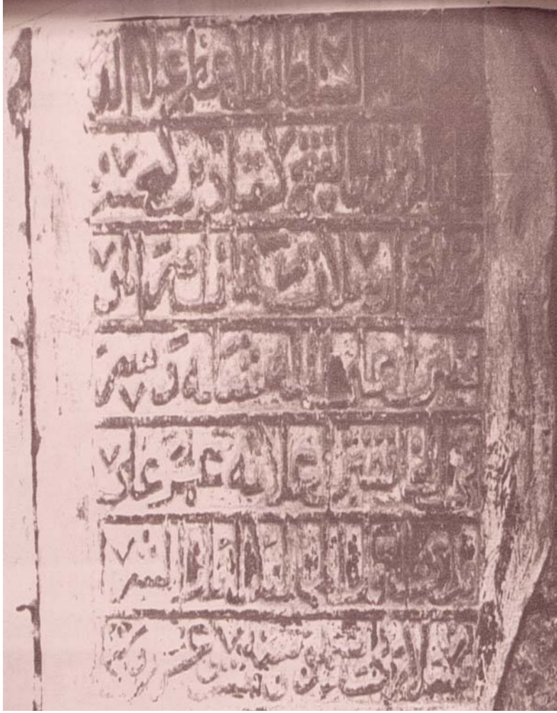
Resim-9 Ayaz-ı Şarab-sâlâr ismi yanlış Ayaz eş-şerre's-sâlârî olarak okunmuştur