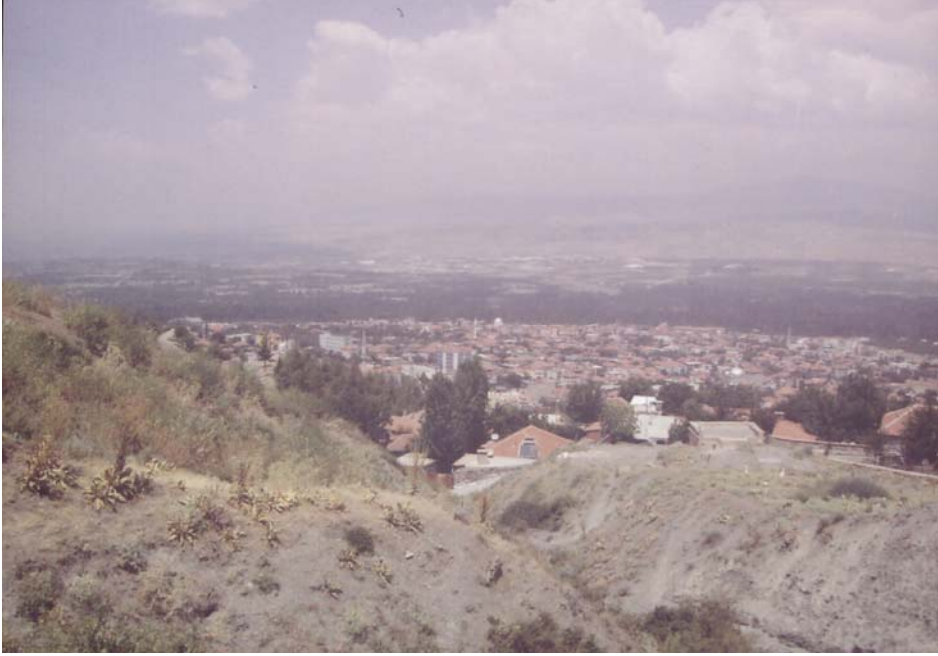
Resim-1 (Eski Honaz'dan yeni Honaz manzarası)