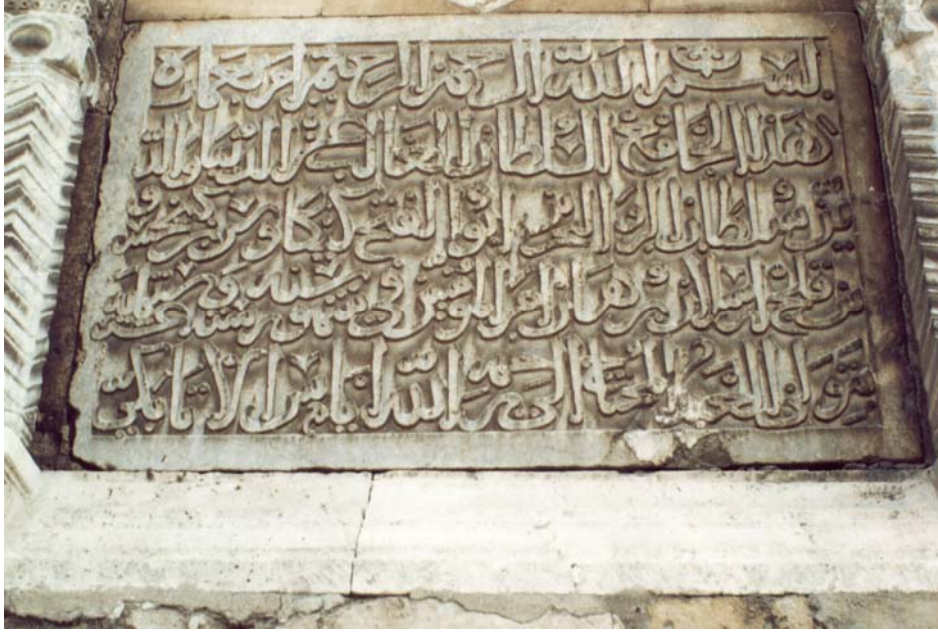
Resim-5 (Bu kitabeye göre Camiin inşasını 616 yılı aylarında I. Keykavus emretmiştir. Mabedin inşasına da mütevellî Atabeki Ayas nezaret etmiştir.)