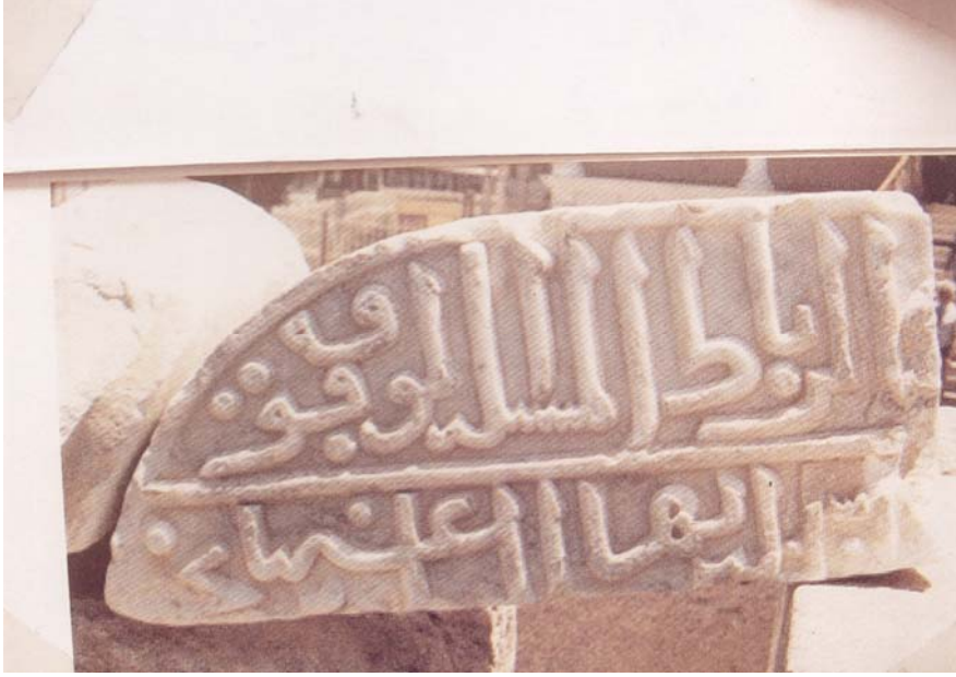
Resim-10 Vakfedilmiş silsile halindeki han...(er-ribatü'l-musilleti'l-mevkufe)"