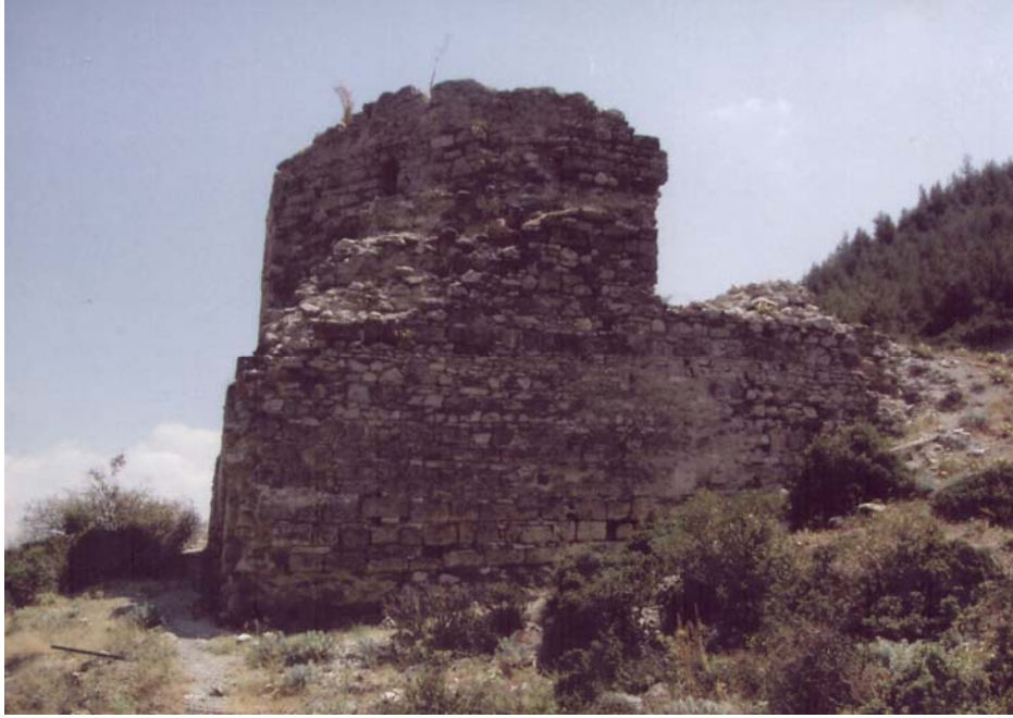
Resim-3 Eski Honaz