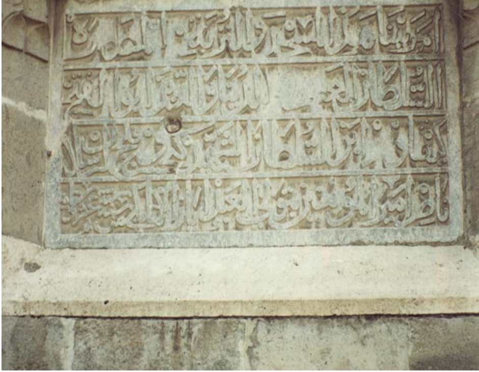
Resim-4 (Bu mescidin ve türbe-yi mutahharanın yapılmasını; Emirü'l-mümininin yardımcısı fetih babası, Kılıç Arslan zade şehit Sultan Keyhüsrev oğlu Alaeddin Keykubad; Ayaz Atabekî'nin tevliyeti ile 616 senesinde emretti) Burada I. İ. Keykavus'un ismi silinmiş görünüyor