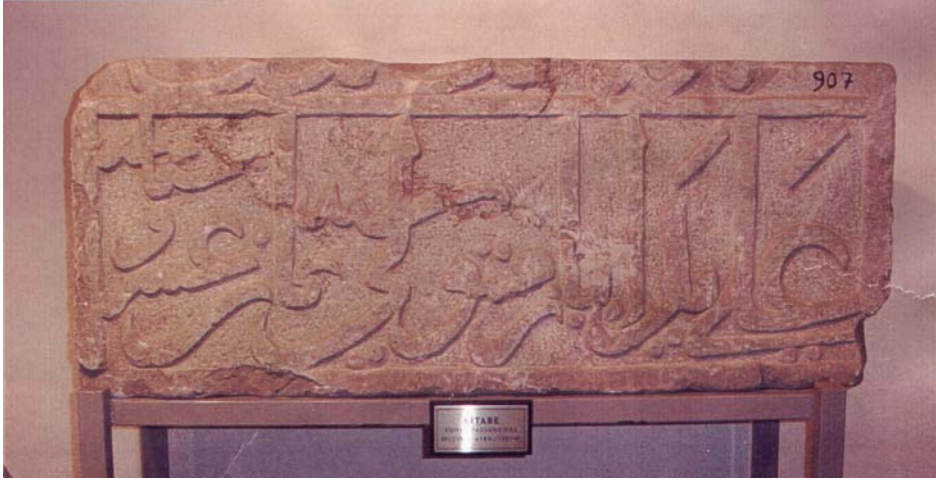
Resim-11. Bu taş kitabe kalenin kuzey kapılarından Ayaz Kapısına aittir. Kitabenin tarihi de kalenin inşaa tarihine uymaktadır.