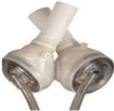
Şekil 3. SynCardia TAH

Aynı zamanlarda; perkütan hatlara ihtiyacı olmayan tamamen implante edilebilir bir TAH olan AbioCor cihazı geliştirilmiştir. Cihazın FDA onayı almasında tromboembolizm ve atriyal emmeden kaynaklanan komplikasyonlar sebebiyle gecikmeler yaşanmış ve 2006 yılında kısmi şekilde onay alınmıştır [24].