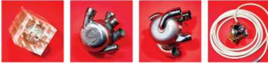
Şekil 6. BIVACOR gelişimi; ilk tasarım(sol), hayvan denemeleri için geliştirilen 2 prototip(orta), insan anatomisine uygun nihai tasarım(sağ) [32]