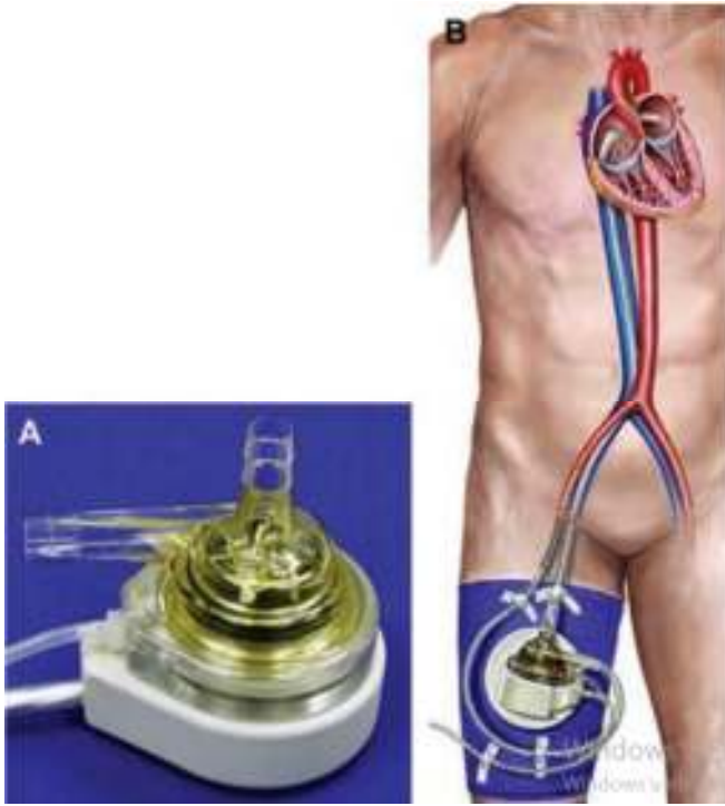
Şekil 1. (A) TandemHeart cihazı, (B) TandemHeart Sistemi [17]

RVAD tedavisinin sıklıkla kullanıldığı klinik durumlar; akut miyokard enfarktüsü, miyokardit, pulmoner hipertansiyon, pulmoner emboli, postkardiyotomi şoku, kalp transplantasyonu ve LVAD implantasyonudur. Bunun yanında tam kalp yetmezliği hastalarının yaklaşık yarısı sol ventrikül implantasyonundan sonra RVAD'a veya farklı tedavilere ihtiyaç duyar [15]. Çünkü LVAD cerrahisi sonrası RV komplikasyonları hem nispeten sıktır hem de morbidite ve mortalite açısından oldukça önemlidir. SynCardia kalp transplantasyonuna köprü oluşturabilir (BTT-Bridge-To-Transplant -) veya dâhili mekanik destek sağlarken, Impella RP, TandemHeart ve CentriMag RVAD gibi diğerleri perimekanik destek köprüleri olarak katkı sağlamaktadır [16]. Şekil 1'de TandemHeart cihazı gösterilmektedir.