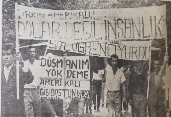
Çirkin Amerikalı : Üniversite Bahçesindeki konuşmalarda bütün hatırlar, bilhassa Amerikalıların para ile herşeyi satın almasıyla ilgili olarak, gençleri tarafından hatırlanan ve Amerika'yı hedef tutan dövizlerden birkaçı görülmüştür. Öndeki dövizde, "Çirkin Amerikalı, dolar değil insanlık" yazıyordu.