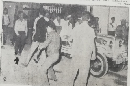
Nümayişçiler Sıvayı Rusya pavyonunu tahrip ederken, Erişimde, mimarisiyle hücumunu bir grup Rus pavyonunu tahrip ederken görüntüler.

Kübra olayların vakitini dük kal almıştı. İzmir dün yeniden bu sahnelar et- ken sahnelarına kadar 6 - 7 EYLÜL olaylarını bir benzeri- ni daha yaşattı.