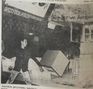
Amerikan pavyonunu tahrip edenler bir sahne daha... Nümayişçiler bugün, çen- ge kapalıdır.