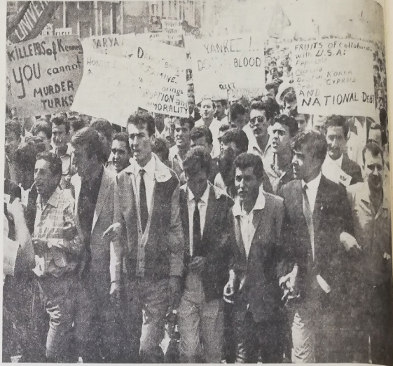
Anladıkları dille : Dün yapılan mitingin Kıbrıs meselesinde ilk gündemleri Türk tezi aleyhine yanlış bir politika takip eden Amerika'yı tenkit etmekti. Gençler, ellerinde taşıdıkları dövizlerde buna dille getirmişlerdir. Herkesin bilmesi için Amerika'nın para ve silahla Türk Milletini satın almasıyla ilgili olarak, Amerika aleyhindeki dövizler ve Kıbrıs davasıyla ilgili olarak, Amerika'nın Kıbrıs'ta tek başına savaşa girişmesini istemediklerini belirttiler ve bu uğurda açılan biribirlerine kenetlenmiş gençler görülmektedir.