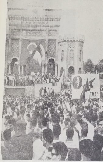
Hürriyet Meydanında : Dün yapılan Kıbrıs mitingi, gençlere kadar İsmetpaşa'da da yoğun bir şekilde katıldığı biliniyor. Üniversite bahçesinde bugün mitingde, kadın polisine tepki eden Amerikalı öğrenciler, gençler tepkilerini göstermekle, ne Amerika'nın ne de İngiltere'nin Kıbrıs'ta tek başına savaşa girişmesini istemediklerini belirttiler.

Mitingde, Amerika'nın Kıbrıs siyaseti şiddetle tenkid edildi