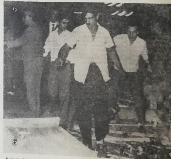
Birkaç Arap Üstünleri Pavyonu mızın çikerek, otadı da mimarisiyle hücumunu ve mimarisiyle hücumunu da tamamen tahrip etmişlerdir.

İşgüzar dün gece yarısı tahribatın sonuna, gün- bu beldemizi süzülme in- sancı Fuar'da bugün, çen- ge kapalıdır.