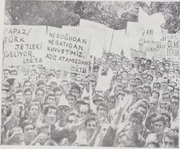
"Ne Doğudan, ne Batıdan, kuvvetimiz Ata'dan : Kıbrıs davasında gençlere kadar Türk hanedanı güvenini bilinen gençler, uzaktan kalıplaşmış bahsetmişler ve, "Türk bayrağına sahip olmak da kendinle taşıyabileceğin bir sorumluluktur", diye belirttiler. Gençler tepkilerini gösterirken, "Ne Doğudan, ne Batıdan, kuvvetimiz ATA'da'dır, parçaları ile savaşıyor istemiyoruz."