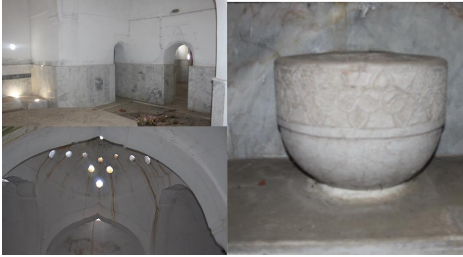
Foto. 4. Sıcaklık

dikdörtgen formlu pencere su deposuna açılmaktadır. Yine sıcaklığın batı eyvanının kuzey cephesi üzerinde yer alan diğer bir pencerede su deposuna bakmaktadır.