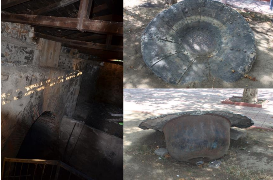
Foto. 5. Külhan Ocağı ve Bakır Kazan

Su deposu "L" şeklinde bir plana sahip olup üzeri beşik tonozla kapatılmıştır. Su deposunda bulunması gereken orijinal kazan günümüzde Uluköy'de yer alan bir parkın içerisinde sergilenmektedir. Hamamın külhanına doğu cephesi üzerine açılan kapıdan girilir. Külhanın üzeri ahşap çatı ile kapatılmıştır. Külhan ocağı ve bacası tuğladan inşa edilmiştir (Foto. 5).