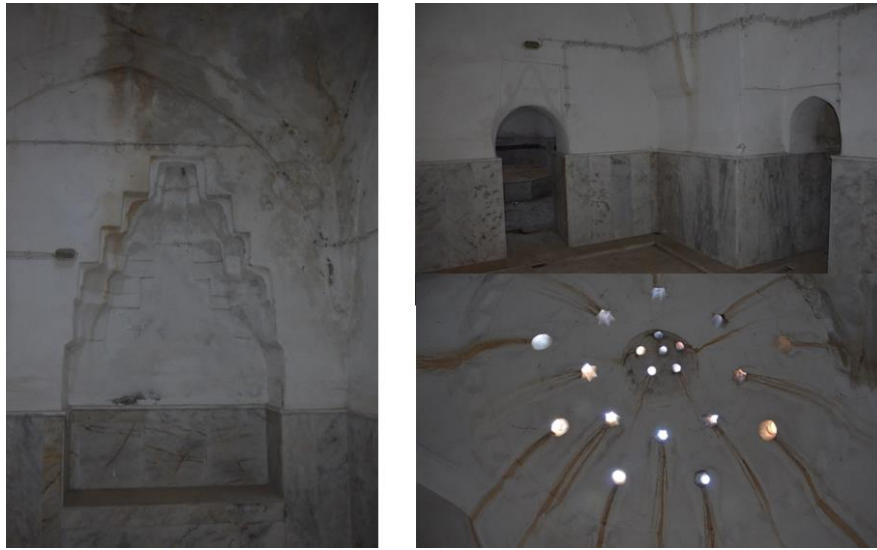
Foto. 3. Ilıklık

Ilıklık 5,11 x 4,11 m. ölçülerinde kareye yakın dikdörtgen planlı olup üzeri pandantiflerle geçilen kubbe ile kapatılmıştır (Foto. 3). Mekân kubbe üzerine açılan on dört adet altıgen ve sekiz adet altı kollu yıldız formundaki ışık gözleri ile aydınlatılmaktadır. Ilıklığın doğu duvarı üzerinde mukarnas kavsaralı bir niş bulunmaktadır. Mekânın güney duvarı, kademeli şekilde yukarı doğru daralan bir niş ile vurgulanmış olup burada bulunan yuvarlak kemerli kapıdan geçilerek tıraşlık ve helaya girilir.