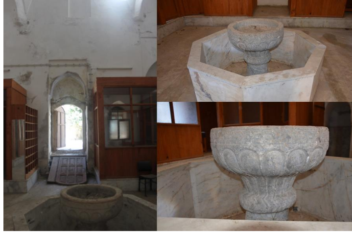
Foto. 2. Soyunmalık

Ilıklık 5,11 x 4,11 m. ölçülerinde kareye yakın dikdörtgen planlı olup üzeri pandantiflerle geçilen kubbe ile kapatılmıştır (Foto. 3). Mekân kubbe üzerine açılan on dört adet altıgen ve sekiz adet altı kollu yıldız formundaki ışık gözleri ile aydınlatılmaktadır. Ilıklığın doğu duvarı üzerinde mukarnas kavsaralı bir niş bulunmaktadır. Mekânın güney duvarı, kademeli şekilde yukarı doğru daralan bir niş ile vurgulanmış olup burada bulunan yuvarlak kemerli kapıdan geçilerek tıraşlık ve helaya girilir.