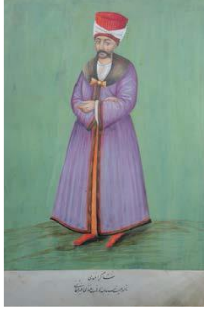
Resim 2. Bozoklu Osman Şakir Efendi

Bozoklu Osman Şakir Efendi (Unat, 1968: 207; Özkan, 2013: 433-434) tarafından 1811 yılında yazılmış ve resimlenmiş olan bu eserde İstanbul'dan İran'a kadar olan yolculuk sırasında uğranılan, konakların 31 adet kasaba ve şehirlerin suluboya resimlerini yaparak bilgiler vermiştir. Üsküdar'dan başladığı yolculuğu sırası uğranılan yerlerin isimleri ve birbiri arasındaki mesafeleri saat olarak yazmıştır. Osman Şakir Efendi bu eserinde Merzifon'a kadar uğranılan yerlerin tarihi ve coğrafi özellikleri hakkında bilgiler verirken; Amasya, İran'da Zengan, Siyahdehân, Ebher, Kazvin, Kışlak ve Tahran'ın sadece resimlerini yapmış metin bölümleri boş bırakılmıştır. Bu da eserin tamamlanamadan yarım bırakıldığını göstermektedir (Osman Şakir Efendi, 2018: 17). Ramazan'ın 20. Günü 1225 tarihinde (19 Ekim 1810) İstanbul'dan başlanılan yolculuk sırasında Üsküdar, Kartal, Gebze, Hereke Hanı, İzmit, Sapanca, Geyve, Taraklı, Göynük, Mudurnu, Bolu, Köroğlu Çeşmesi, Gerede, Bayındır, Çerkeş, Karacalar, Karacaviran, Koçhisar, Tosya, Hacıhamza, Sarmaşikkaya, Osmancık, Dingil Hüseyin Derbendi, Merzifon, Amasya, Zengan, Siyahdehân, Ebher, Kazvin, Kışlak üzerinden Tahran'a ulaşılarak yolculuk son bulur (Kavak, 2016: 49).