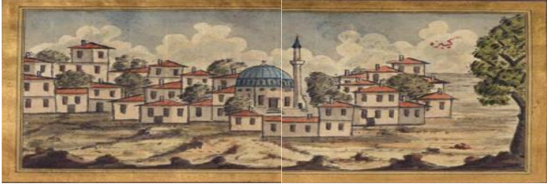
Resim 3. Gebze Minyatürü (Bozoklu Osman Şakir Efendi)

Bu eserde geçilen şehir ve kasabaların tarihi, idarecileri, mimari özellikleri ve insanları hakkında bilgilere yer verilmiştir. Osman Şakir Efendi, 1225 yılı Ramazan ayının 25. Günü Üsküdar'dan hareket ederek 4 saatlik bir yolculuktan sonra Kartal'a ulaşır. Burada konakladıktan sonra bir sonraki durak yeri olan Gebze'ye 5 saatte ulaşır. Gebze suluboya bir çizimini yaprak şehir hakkında şu bilgileri bizlere aktarır: “Oradan da sabah vaktinde yel gibi esen atlara binerek himmet atının sevki ve gidiş dizginlerinin bırakılmasıyla hızlı bir şekilde Gebze'ye doğru yolumuza devam ettik. Beş saat sonra Gebze'ye vardığımızda kendimiz sağanak yağmurdan iyice ıslanmıştık, elbiselerimiz de sırlıklam olmuştu. Ancak önden giden konakçımızın mahkemeye varıp büyükelçinin gelişini haber vermesine ve rütbesini bildirmesine rağmen Gebze ayanı olan Semerci Bayraktarın -anlayışsız ve haydut bir eşek idi-konaklama yeri ayırmaması sebebiyle harap bir evde konakladık. Gebze'nin de resmi olduğu gibi tasvir edildi (Osman Şakir Efendi, 2018: 63). O gece de Gebze'de dinlendik, ancak aşırı soğuktan hayli eziyet çektik. Sabahleyin sırtı yüklü atlara binerek hareket ettik. İzmit tarafına yöneldik ve Hereke Hanı diye bilinen yerde durduk. Hereke Hanı, Gebze ile İzmit arasında bulunmakta, birkaç dükkân ve handan oluşmaktadır” (Osman Şakir Efendi, 2018: 67).