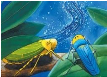
Resim 2: Salkımsöğütteki Orkestra, Karakterler

"Salkımsöğütteki Orkestra" adlı eserde, nicelik bakımında çocuk seviyesine uygun olarak, Anne ağustos böceği, Mavi isimli ağustos böceği ve Yeşil isimli ağustos böceği şeklinde 3 karakter yer almaktadır.