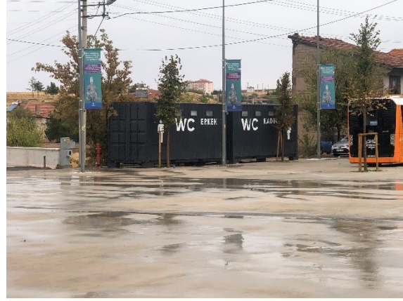
Şekil 6: Alan çevresinde bulunan tabela ve konteynerlerin oluşturduğu çirkin görüntü