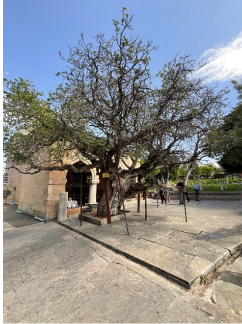
Şekil 10: Bektaşî inancına göre kutsal olarak nitelendirilen Morus nigra bitkisi

Avlu içerisinde Balım Sultan Türbesi önünde çalışma alanının özgün kimliği ile bütünleşen, Bektaşî kültüründe kutsallık atfedilmiş ağaçlardan biri olan Morus nigra bitkisi bulunmaktadır. Soliter kullanılan Morus nigra bitkisi avlu içerisinde gerek kaligrafik yapısıyla gerekse yaşı ile (rivayete göre 700 yıllık) dikkat çekmektedir (Şekil 10).