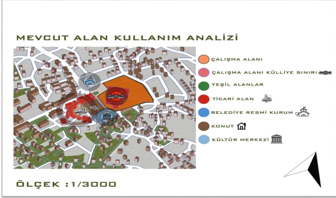
Şekil 4. Çalışma alanı ve yakın çevresi alan kullanım analizi