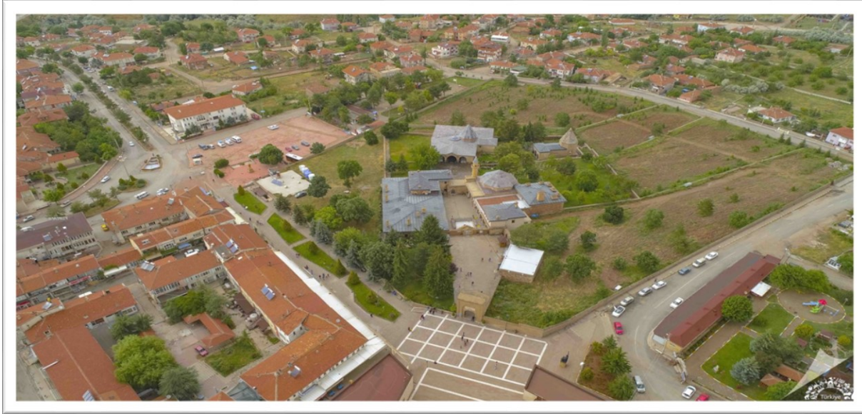
Şekil 2. Çalışma alanı hava fotoğrafı (Anonim, 2022)

UNESCO geçici kültürel miras listesinde (13 Nisan 2012) yer alan külliye, 14. yüzyılda kurulmuştur. Horasan erenlerinden Hacı Bektaş Veli Nişabur'dan taşındığında eski adı Sulucakarahöyük olan bugünkü Nevşehir ili Hacıbektaş ilçesine yerleşmiş ve burada Bektaşiliğin temelini atmıştır (Ocak, 1996). Daha sonrasında ilçenin adı Hacı Bektaş Veli'nin 1337 yılında vefatından sonra insanlık zemininde inşa ettiği hoşgörü ortamının anısına değiştirilmiştir (UNESCO, 2022). Bektaşiliğin merkezi olan Hacıbektaş ilçesinde zaman içerisinde Bektaşilikle ilgili başka yapı eklentileri ile bugünkü Hacı Bektaş Veli Külliyesi oluşmuştur (Tanman, 1996; Bayrakal, 2010) (Şekil 2).