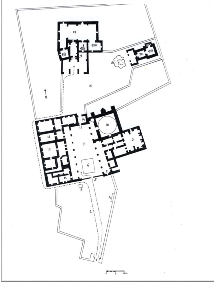
Şekil 3. Hacı Bektaş Veli Türbesi yerleşim düzeni ve avlu yapısı 1) Kompleksin ana giriş yolu; 2) Birinci avlu; 3) Bilet gişesi; 4) Üçler Çeşmesi; 5) Müze alanına giriş; 6) Havuz; 7) İkinci avlu; 8) Arslanlı Çeşme; 9) Mutfak; 10) Tekke Camii; 11) Sergi salonları; 12) Meydan Evi; 13) Bilet kontrolü; 14) Atatürk heykeli; 15) Üçüncü Avlu; 16) Çilehane; 17) Kırklar Meydanı; 18) Hacı Bektaş Türbesi; 19) Dut Ağacı; 20) Balım Sultan Türbesi; Kesikli çizgi, Ağustos ayında Hacı Bektaş Şenlikleri sırasında giriş ve ziyaret güzergahını gösterir; Noktalı çizgi, yılın geri kalanında giriş yolunu gösterir. (Harmanşah vd., 2014).

İşlevlerine göre birimlerin çevresine yerleştiği avlulu Türk Saraylarının yerleşim düzenine sahip olan külliye, 1. avlu (Nadar), 2. avlu (tekke) ve 3. avlu çevresindeki yapılardan oluşmaktadır (Şekil 3).