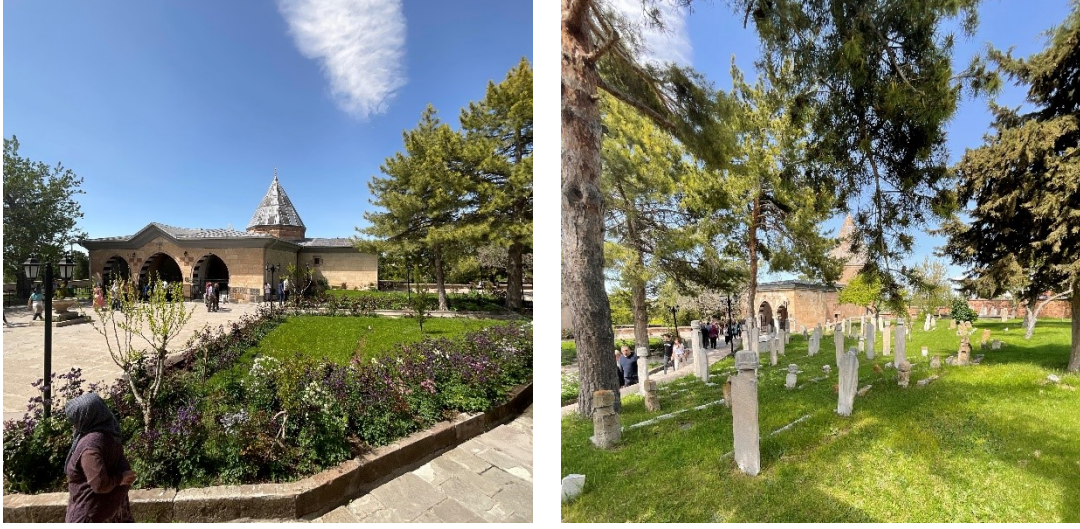
Şekil 9: Üçüncü avluya ait bitkisel düzenlemeler

Avlu içerisinde Balım Sultan Türbesi önünde çalışma alanının özgün kimliği ile bütünleşen, Bektaşî kültüründe kutsallık atfedilmiş ağaçlardan biri olan Morus nigra bitkisi bulunmaktadır. Soliter kullanılan Morus nigra bitkisi avlu içerisinde gerek kaligrafik yapısıyla gerekse yaşı ile (rivayete göre 700 yıllık) dikkat çekmektedir (Şekil 10).