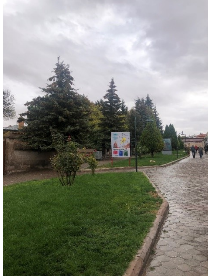
Şekil 8: Külliye'ye doğru çıkan yaya yolu

Atatürk Bulvarı'ndan Külliye'ye doğru çıkan geçiş alanının ortası yeşil alanlarla hareketlendirilmiştir. Bu alanda Thuja orientalis 'Pyramidalis' ve Picea pungens bitkileri ile çizgisel etki yaratılmış ve yayaların külliye girişine doğru yönlendirilmesi sağlanmıştır (Şekil 8). Ancak mevcut düzenleme hem estetik hem de fonksiyonel anlamda yeterli değildir. Ana giriş kapısının olduğu bölgede kullanılan Cedrus libani ve Picea orientalis gibi yüksek boy ve çap yapan bitkiler görüşü giriş kapısına değil yukarı yönlendirmiştir.