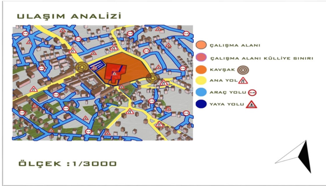
Şekil 5. Çalışma alanı ve çevresi ulaşım analizi

Külliye, Kapadokya turizm merkezine 60 km uzaklıktadır. Nevşehir-Kırşehir karayoluna paralel Atatürk Bulvarı ilçe merkezine ulaşımı sağlayan ve ana aksı oluşturan tek yoldur. Atatürk Bulvarı, Aşık Mahsuni Şerif Caddesi ve Cemalettin Çebi Caddesi birinci derece, Salih Niyazi Baba Sokak ikinci derece öneme sahip yollardır ve alan bu yollar ile çevrelenmiştir. İlçe Belediye Binası, Atatürk Evi ve tören alanının oluşturduğu düğüm noktası ilçenin meydanını oluşturmaktadır. Bu meydandan Aşık Mahsuni Şerif Caddesine dik uzanan ara yol ile Külliye ulaşım yaya olarak sağlanmaktadır (Şekil 5).