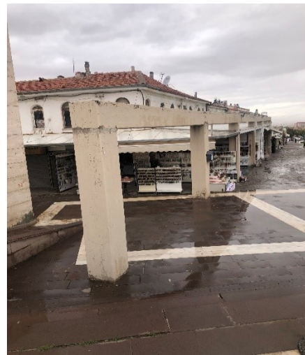
Şekil 7: Alan çevresinde yer alan ticari yapıların oluşturduğu görsel kirlilik