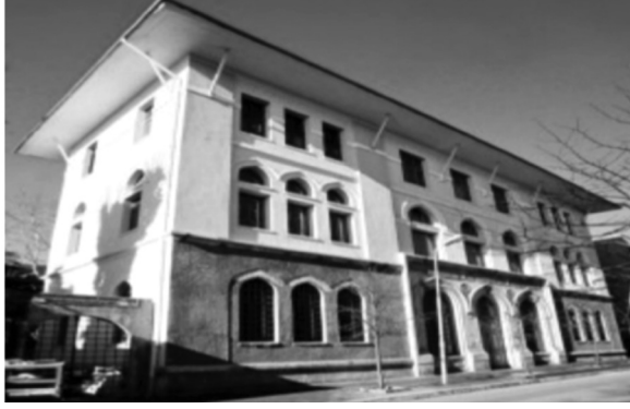
Şekil 3: Medresetü'l-Kudât Binasının Günümüzdeki Hali. Bina İstanbul Üniversitesi Nadir Eserler Kütüphanesi olarak hizmet vermektedir. Kaynak: Mehmet İpşirli, “Medresetü'l-Kudât”, s. 343-344.