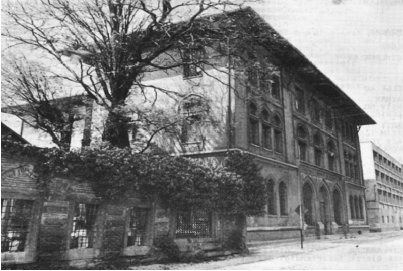
Şekil 2: 1913'te İnşa Edilen Medresetü'l-Kudât Binası, Kaynak: Yıldırım Yavuz, Mimar Kemalettin ve Birinci Ulusal Mimarlık Dönemi , s. 239.