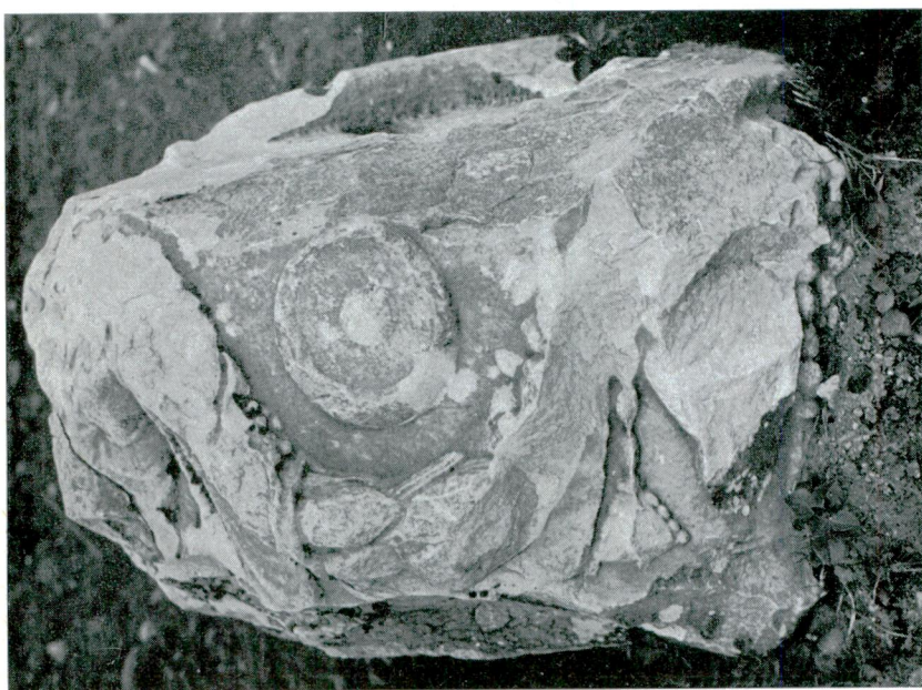
Abb. — Res. 2