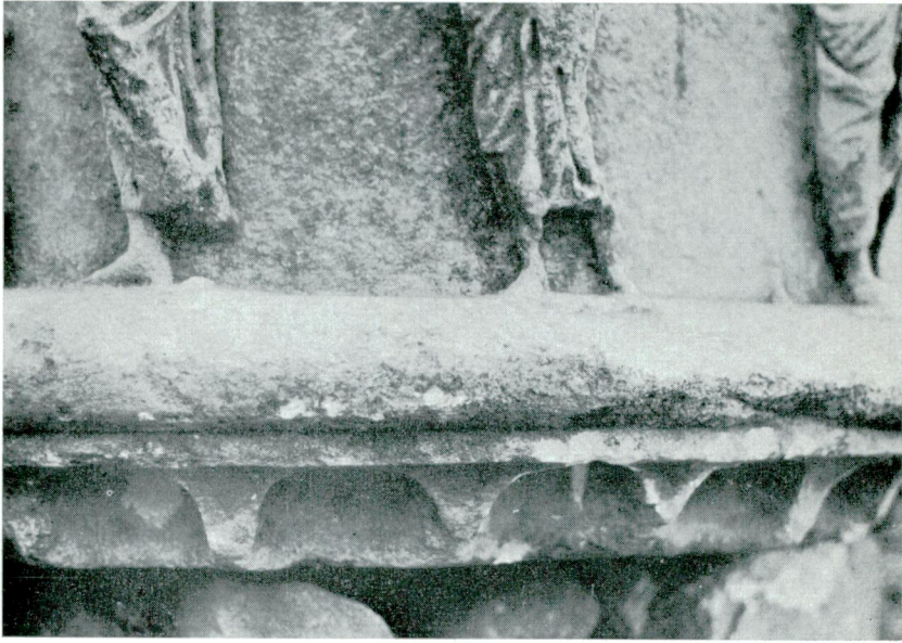
Abb. — Res. 3