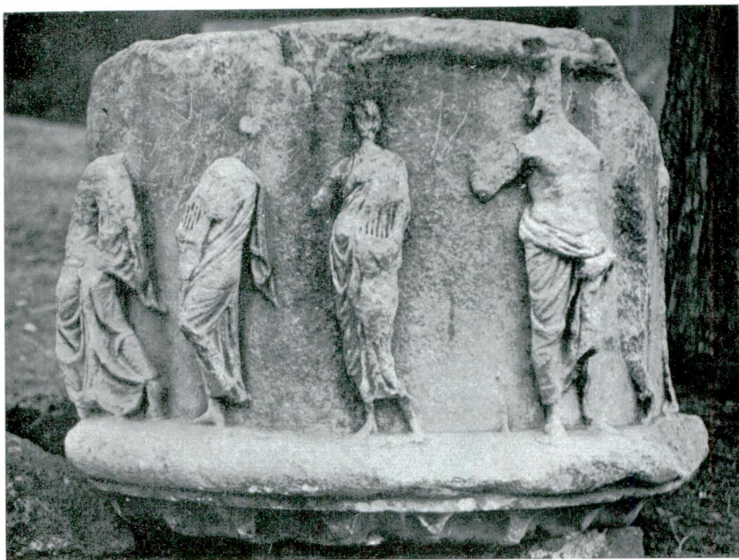
Abb. — Res. 1