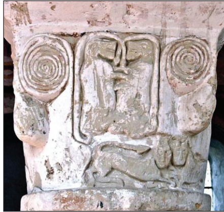
Foto 13: Lavardin St Genest Kilisesi XI. yy, https://www.tripadvisor.com/Lavardin_Saint_Genest_Church-LavardinLoir_et_Cher_Centre_Val_de_Loire.html , Erş. Tar.02.2019)