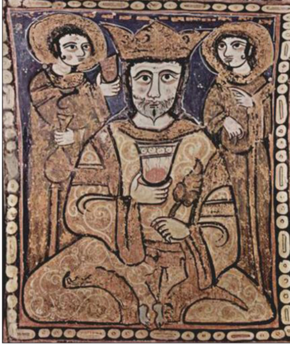
Foto 9: Cappella Palatina Ahşap Tavan Süslemesindeki Figürler-Sicilya. Türk oturuşu olarak bilinen figürün elinde de kadeh tutması, Gök-Türk heykel sanatına özgü, elinde hayat suyu tutan heykellerle benzerliği dikkat çekicidir.