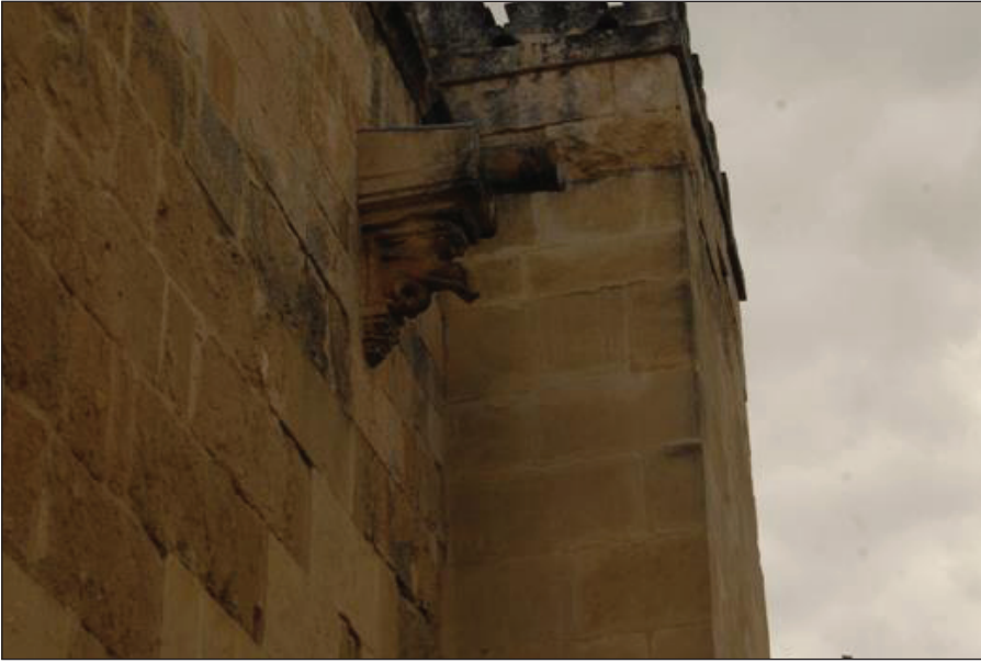
Foto17 : Avrasya Üslubunda Bir Çörtlen / Malaga Katedrali-İspanya (Y. Berkli).

İlerleyen dönemlerde de başta mimaride sivri kemerler olmak üzere (Akurgal, 1944, s.530), Türk İslam mimarisinin çift minare geleneğinin Avrupa sanatına tesiri olarak cep- hede yer alan çift çan kuleleri, cephelerdeki ve çörtlenlerdeki bir kısım Orta Asya etkili grifon heykelleri tekstil, maden ve cam işleri (Mack, 2005, s. 92-95), pencerelerdeki ka- fes işleri (Mack, 2005, s. 92-95) bu etkilerin bir kısmı olarak görülebilir (Foto:17).