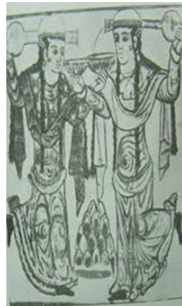
Foto 11: Cevsak-ul Hakani duvar resimleri. Abbasi dönemi/ Samerra (S.K. Yetkin).