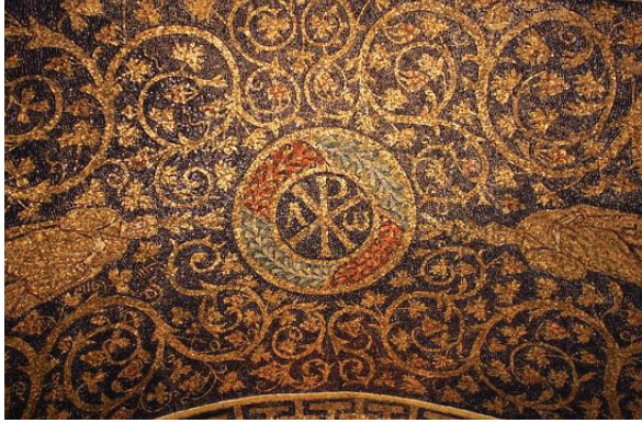
Foto 12: Kemer İçi Süslemelerde Helezonik Kıvrımlar/ Galla Placidia/İtalya