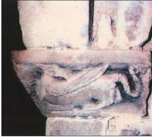
Foto 8: Kilise Sütununda Kartal Başlı Kanatlı Grifon/Montovola- İtalya