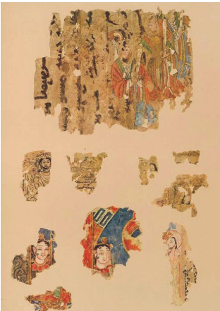
Foto 10: Uygur duvar resimlerinden örnekler (Yanaklardaki zülüflerin benzerlikleri).