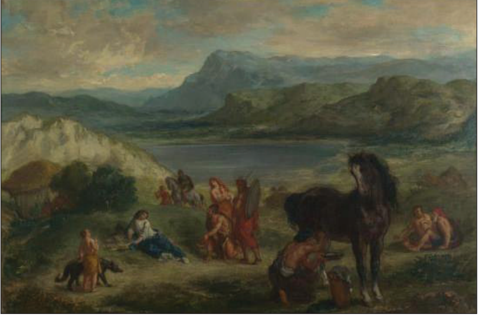
Foto 7: İskitler Arasında Ovid-Eugène Delacroix (1859) National Galeri Londra.

Avrupa’da ikona kırıcılık (İnalçık, 2013, s. 177-178) olmasaydı belki de günümüzde bu etkilerin varlığının tartışılması yerine, oluşturulan Avrupa Sanatı üzerindeki Orta Asya Türk Sanatı etkilerinin alt üslup özelliklerinin dönemsel özelliklerinin boyutlarını tartışıyor olacaktık.