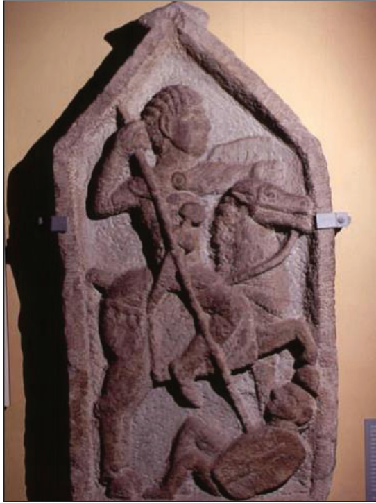
Foto 3: Roma yardımcı askeri sınıftan bir komutana ait mezar taşı. Süvarinin atının kuyruğunun örgülü ve düğümlü oluşu özellikle vurgulanmıştır. (Gloucester City Museum and Art Gallery)

262) en önemli etken oldukları (Çoruhlu, 2011, s.34), bıraktıkları eserler ve bu eserlerin etki ettiği Avrupa sanatındaki örneklerinden, rahatlıkla anlaşılmalıdır. Bu etkiler, Avrupa'nın hemen tamamında kendisini hissettirecek kadar güçlüdür. Artık Orta Asya Türk sanatı ve kültürüne ait etkilerin sadece sanatsal faaliyetlerle sınırlı kalmadığı, günlük hayata da tesir edecek kadar güçlü olduğu hatta bu dönemde "Cermen ve Slavların Avrupa Hunlarının asil sınıfına benzemeye çalıştıkları" kaynaklarda geçmektedir (Brion, 2008, s. 5-9). Öyle ki Bizans'ta günlük yaşamda Hun kıyafetleri ve yaşam biçimi moda olarak kabul görüyor, Hunların saç biçimleri de Bizanslılar arasında sevilerek kullanılıyordu (Prokopius, 1999, 49-50). Hatta Kıyafetler ve kompozisyonu oluşturan figürlerin işleniş biçimlerinden bu etkilerin, Roma heykel sanatına yansiyacak kadar derin ve güçlü oldukları, ortaya konulan eserlerden anlaşılmalıdır. Bu tür heykellerde süvarilerin kıyafetlerindeki Atlı bozkır kıyafetinin en önemli özelliği olan pantolon, çizme gibi özelliklerin yanında atların kuyruklarının da düğümlü olması bir tesadüf değil, Avrasya üslubunun Roma'ya derin tesirinin en açık delillerindendir (Foto: 3). Ayrıca bu kompozisyonlardaki konular da Avrasya üslup özelliğinin bir yansıması olarak bir yandan Pers ve devamında Sasanilere diğer yandan da Avrupa sanatına etki edip sevilerek kullanılmıştır.