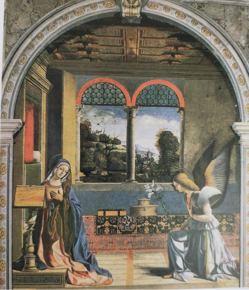
Foto 1: Andrea Previtali'ye ait Meryem'e Müjde tablosundaki (1507) Selçuklu üslubu Türk halı motifleri (Rosamond E. Mack. Doğu Malı Batı Sanatı s.107).

Erken dönem sanatsal etkilerin de İslam Sanatı çerçevesinde değerlendirilerek batıya aktarıldığı, İslam Sanatı içerisinde de Türk sanat ve üslup etkilerinin varlığı bilinmektedir (Özkeçeci, 2006, s. 2). Bilhassa Abbasi, Tolunoğlu ve Fatimi dönemlerinde Orta Asya ve Uygur etkilerinin yoğun bir şekilde İslam coğrafyasına etki ettiği ve İslam sanatının kendi şahsiyetini oluşturmasında en önemli etkiye sahip olduğu görülür.