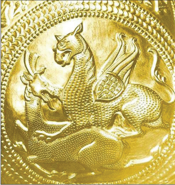
Foto 4: Nagyszentmiklos Vazosundaki Grifon Sığın mücadele sahnesi.

Etkilerin ilerleyen dönemlerde de yok olmadığı, aksine artarak devam ettiği görülür. Macaristan'ın Nagyszentmiklos köyünde 1799 yılında bulunan bir kısım altın malzeme üzerindeki kompozisyonlar (Nemeth, 1932, s.13-17), Avrasya üslup özelliklerinin geç dönemlerde dahi sevilerek kullanıldığını göstermesi bakımından önem arz eder (Foto:4-5-6). Ayrıca dönemin Avrupalı ressamlarının da bu etki içerisinde eserler ürettikleri dikkati çekmektedir. Mesela Eugène Delacroix, bu etkiler içerisinde eserler üreten Fransız ressamlardan birisidir. Delacroix'in "İskitler Arasında Ovid" adlı tablosunda, kısraktan süt sağma sahnesi canlandırılarak, Asya etkilerine açık bir gönderme kendisini belli eder (Foto: 7).