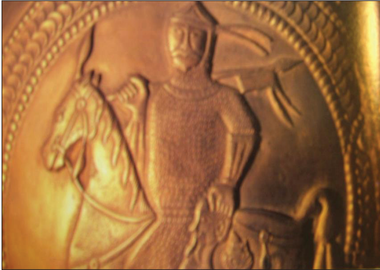
Foto 6: Nagyszentmiklos Vazosunda Avrasya üslubunda işlenmiş savaştan dönen savaşçı. (Atın kuyruğunun düğümlü olması önemlidir.).