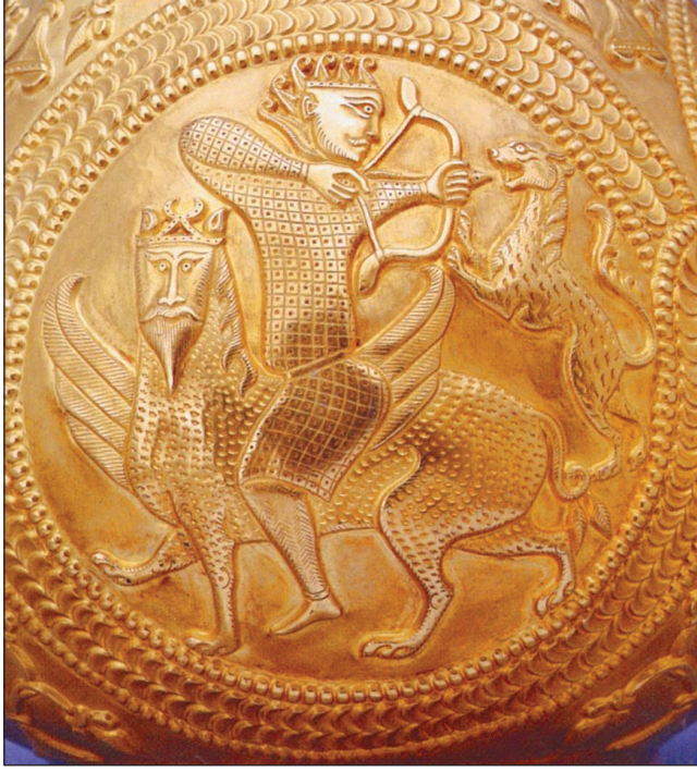
Foto 5: Nagyszentmiklos Vazosunda Avrasya üslubunda işlenmiş av sahnesi.