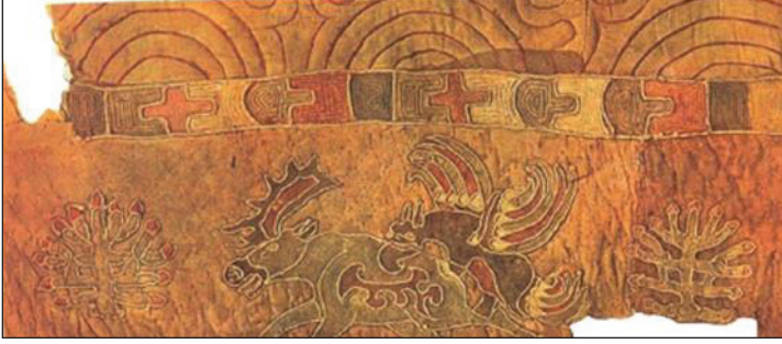
Foto 14: Pazırık Kurganı Helezonik kıvrımlı figürlü applike (Hermitage Museum).