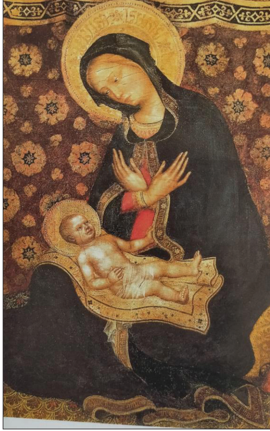
Foto 2: Gentile da Fabriano'ya ait 1422 tarihli Meryem ve Çocuk İsa tablosunda Meryem'in giydiği giysinin yaka ve etek manşetlerindeki Küfi yazı karakteri (Rosamond E. Mack. Doğu Malı Batı Sanatı s.107).

Avrupalı ressamın tablolarında karşımıza çıkan Türk-İslam hat sanatının güzel örnekleri, (foto: 2) dönemin sanatçıları tarafından sevilerek ve öykünülerek önemli kişilerin giydiği kıyafetlerde kullanılıyor ve bu bir övünç meselesi olarak sanatçılar arasında değer buluyordu (Mack, 2005, s. 72-73). Barthold'un da ifade ettiği gibi "Avrupa Tarihi ve medeniyetini anlamak için Doğu tarihini anlamak gerekir. Doğu araştırmaları tarihinde de Türklerin özel bir yeri vardır" (İnalçık, 2013, s. 297) tespitleri, konunun anlaşılması açısından ayrı bir önem arz eder.