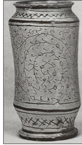
Foto 16: Osmanlı etkisi ve üslubunda Cenova veya Savona'da üretilmiş Ecza Kavanozu Liguria 1575. British Museum Londra (Doğu Malı Batı Sanatı'ndan S. 178).

Helezonik kıvrımların Türk Sanatında derin anlamlar içerdiği ve sürekli farklı mekân ve malzemelerde kullanıldığı bilinmektedir. Pazırık kurganlarındaki erken örneklerin, (Foto:14) daha geç örneklerde de görülmesi Türk sanatının köklü, sürekli ve kendini yenileyebilme özellikleri ile ilişkilidir (Foto: 15-16). Orta Asya petroglif kaya resimlerinde ki en eski örneklerde de karşılaştığımız bu motiflerin astral/kozmetik anlamlar yüklenen motifler olduğu, ilerleyen dönemlerde ki kullanılan yer ve yüklenen anlamlardan anlaşılmaktadır. Zaman içerisinde özellikle İslami Dönemde çark-ı felek ismi ile isimlendi-