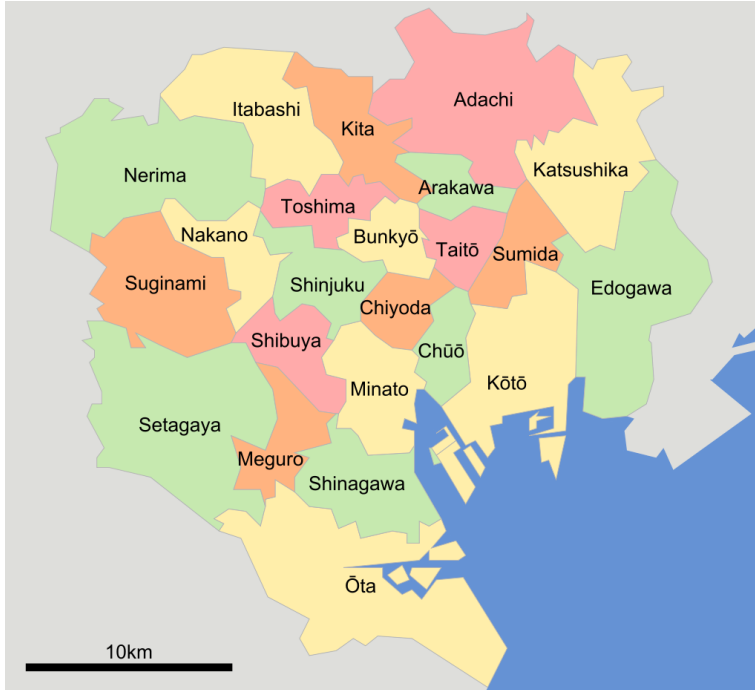
Tokyo’nun Özel Semtleri