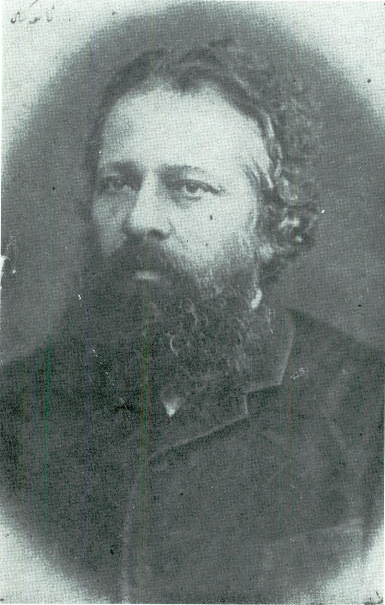
O yıllarda Namık Kemal