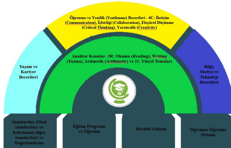
Şekil 1. 21. yüzyıl becerileri (Battle for Kids, 2021).