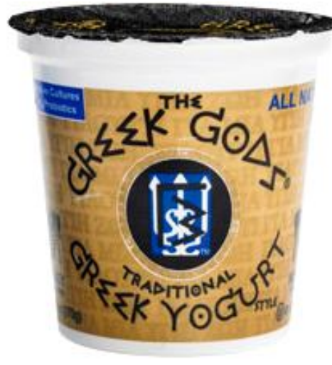
Fotoğraf 1:Çoban Grek Yoğurdu ve Grek Tanrıların Geleneksel Grek Yoğurdu