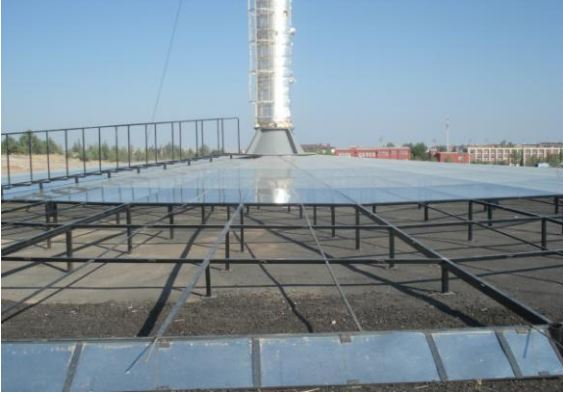
Şekil 3 Güneş bacası sistemi kollektör imalatı [15]

Güneş bacası sisteminin en önemli kısımlarından olan baca imalatında öncelikle türbin ve jeneratörün monte edileceği ve kollektör altından bacaya doğru yönlendirilen havanın türbinden düzgün bir dağılımla geçip bacaya girmesini sağlamak için 0.07 m kalınlığında metal sac' dan ana huni ve iç huni üretilmiştir. Daha sonra ana huninin taşıyıcı ayaklarla ve baca ile bağlantısını sağlamak için ana huninin alt ve üst kısımlarına 0.2 m kalınlığında flanşlar monte edildi. En son olarak 0.07 m kalınlığında metal sac' dan yapılmış 15 m yüksekliğinde 0.8 m çapında baca imal edilip ana huni üzerine yerleştirildi. Bacanın iç kısmını düşük sıcaklıkta tutmak için baca çevresi 0.05 m kalınlığında alüminyum folyolu cam yünü ile kaplandı.