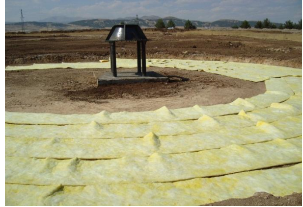
Şekil 2 Güneş bacası sistemi zemin imalatı [15]

Adıyaman Üniversitesi kampüs alanına kurulan güneş bacası sisteminde, öncelikle 27 m çapında 0,5 m derinliğinde açılan çukura 0,05 m kalınlığında alüminyum folyolu cam yünü döşenerek, gündüz zemine depolanacak ısının toprağa geçmesi engellenmiştir. Daha sonra alüminyum folyolu cam yünü üzerine 0.10 m kalınlığında çakıl, 0.05 m ince kum, 0.05 m (15 ton) cam parçaları, en üst yüzeye ise 0.25 m asfalt döşenerek özel zemin hazırlanmıştır.