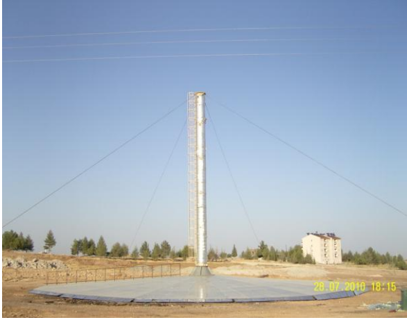
Şekil 4 Güneş bacası enerji santral prototipinin bitmiş hali [15]

Güneş bacası sisteminin en önemli kısımlarından olan baca imalatında öncelikle türbin ve jeneratörün monte edileceği ve kollektör altından bacaya doğru yönlendirilen havanın türbinden düzgün bir dağılımla geçip bacaya girmesini sağlamak için 0.07 m kalınlığında metal sac' dan ana huni ve iç huni üretilmiştir. Daha sonra ana huninin taşıyıcı ayaklarla ve baca ile bağlantısını sağlamak için ana huninin alt ve üst kısımlarına 0.2 m kalınlığında flanşlar monte edildi. En son olarak 0.07 m kalınlığında metal sac' dan yapılmış 15 m yüksekliğinde 0.8 m çapında baca imal edilip ana huni üzerine yerleştirildi. Bacanın iç kısmını düşük sıcaklıkta tutmak için baca çevresi 0.05 m kalınlığında alüminyum folyolu cam yünü ile kaplandı.