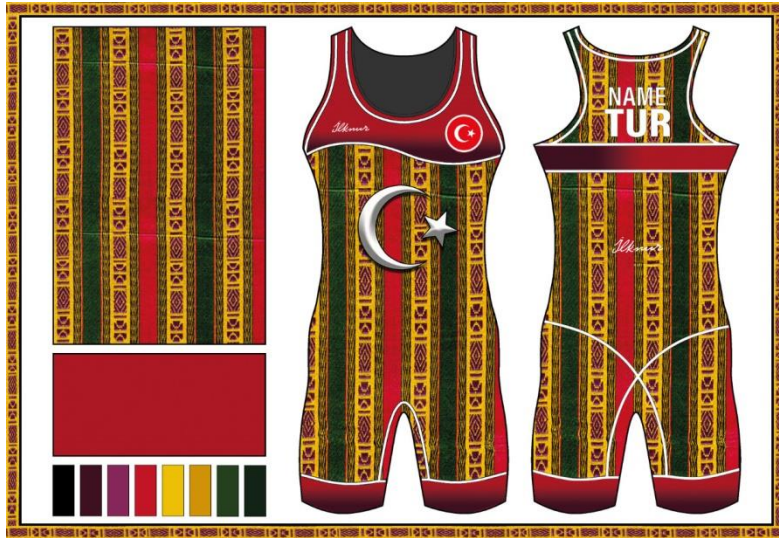
Resim 5. Çiçek Motifli Kerasi Tasarımı

Bağlama sedefli kutnu kumaşı kullanılarak tasarlanan modelin moda panosu resim 4'te gösterilmektedir. Gaziantep yöresinde özgü kutnu kumaş deseni kullanılarak tasarlanan kadın güreş mayosunda kullanılan çeşit bağlama sedeflidir. Tasarımda kullanılan kutnu kumaş desenin de gri, kırmızı, hardal, beyaz ve bordo renkleri mevcuttur. Boyuna üç çeşit çizgiden oluşan desende ilk çizgide gri rengin tonlamaları, ikinci çizgide kırmızı renkten beyaz renge geçiş ve üçüncü çizgide ise siyah zemin üzerinde kullanılan sarı noktalar kullanılmıştır. Tasarımın kutnu kumaş deseni kullanılmadığı zemininde kırmızı rengin, gri renge geçişi mevcuttur. Geleneksel kumaşların kullanıldığı Bağlama sedefli kadın güreş mayosu tasarımına hakim ana renk koyu tonlarda olan gridir. Gri, siyah içine beyaz, beyaz içine siyah rengin katılmasıyla elde edilen hareketsiz ve nötr bir ara renktir. Hareketsiz ve tınısızdır. Açık kül renginin de ismi olan gri, Fransızca 'duman' anlamına gelen 'gris'ten gelmektedir. Gri renk, karasızlığın, hüznün, tarafsızlığın, karamsarlığın ve sıkıntının rengi olarak simgeleştirilen bir renktir (Ercan , 2010, s. 9). Burada rengin fiziksel anlamının yanısıra fiziksel etkisi de önemlidir. Örneğin insanın parlak renklere verdiği tepki ile mat renklere verdiği tepki farklı olabilmektedir. İnsan parlak renklere daha olumlu tepkiler vermektedir (Jiang & Bian, 2013, s. 189)