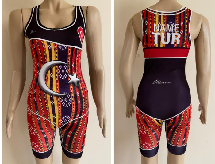
Şekil 5. Çiçek Motifli Mecidiye Tasarımı Nihai Hali

Dijital baskı yöntemiyle desen kumaşa aktarılmış ve dikim atölyesinde desen sabitlenmiştir (Şekil 4). Kumaş yüzeyine 1 adet ön beden ve 1 adet arka beden olarak basım işlemi tamamlanan tasarım, 1 cm dikiş payı bırakılarak kesilmiştir. Dikim işlemi basımı gerçekleştirilen ön ve arka bedeni bir bütün haline getirme işlemi kapsamaktadır. Kesimi tamamlanan modelin sanayi tipi overlok makinesinde, overlok işlemi yapıldıktan sonra sanayi tipi dikiş makinesinde dikim işlemi gerçekleştirilmiştir. Modelin dikim işlemi yaklaşık 15 dakika sürmüştür.