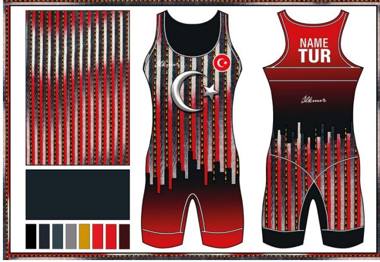
Resim 4. Bağlama Sedefli Tasarımı

Bağlama sedefli kutnu kumaşı kullanılarak tasarlanan modelin moda panosu resim 4'te gösterilmektedir. Gaziantep yöresinde özgü kutnu kumaş deseni kullanılarak tasarlanan kadın güreş mayosunda kullanılan çeşit bağlama sedeflidir. Tasarımda kullanılan kutnu kumaş desenin de gri, kırmızı, hardal, beyaz ve bordo renkleri mevcuttur. Boyuna üç çeşit çizgiden oluşan desende ilk çizgide gri rengin tonlamaları, ikinci çizgide kırmızı renkten beyaz renge geçiş ve üçüncü çizgide ise siyah zemin üzerinde kullanılan sarı noktalar kullanılmıştır. Tasarımın kutnu kumaş deseni kullanılmadığı zemininde kırmızı rengin, gri renge geçişi mevcuttur. Geleneksel kumaşların kullanıldığı Bağlama sedefli kadın güreş mayosu tasarımına hakim ana renk koyu tonlarda olan gridir. Gri, siyah içine beyaz, beyaz içine siyah rengin katılmasıyla elde edilen hareketsiz ve nötr bir ara renktir. Hareketsiz ve tınısızdır. Açık kül renginin de ismi olan gri, Fransızca 'duman' anlamına gelen 'gris'ten gelmektedir. Gri renk, karasızlığın, hüznün, tarafsızlığın, karamsarlığın ve sıkıntının rengi olarak simgeleştirilen bir renktir (Ercan , 2010, s. 9). Burada rengin fiziksel anlamının yanısıra fiziksel etkisi de önemlidir. Örneğin insanın parlak renklere verdiği tepki ile mat renklere verdiği tepki farklı olabilmektedir. İnsan parlak renklere daha olumlu tepkiler vermektedir (Jiang & Bian, 2013, s. 189)