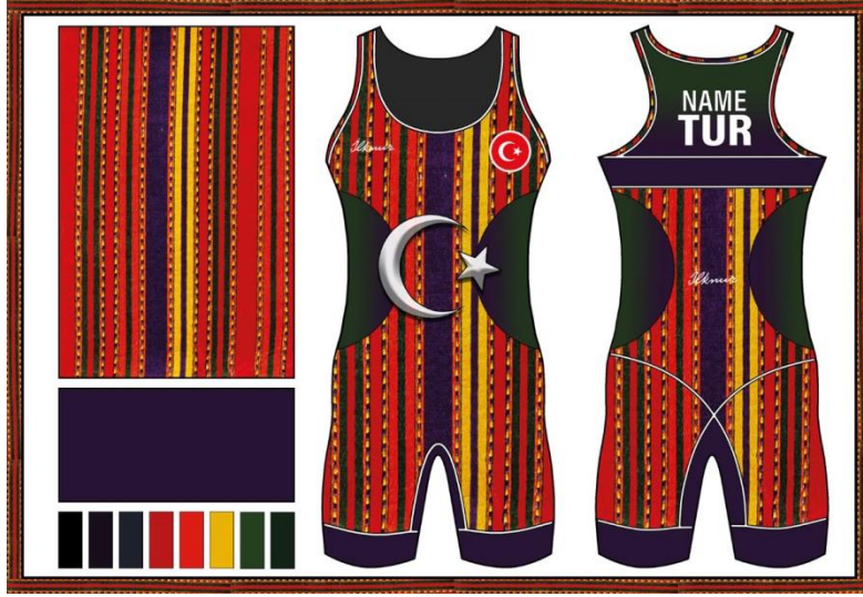
Resim 6. Düz Çizgili Mecidiye Tasarımı

Çiçek motifli kerasi tasarımına ait moda panosu resim 5'te gösterilmiştir. Modele ait moda panosu içeriğinde tasarımda kullanılan kutnu kumaş deseni, tasarımın eskiz çizimi, renk skalası ve modelde kullanılan en yoğun renk bulunmaktadır. Yöresel kumaşların renk kattığı kadın güreş mayosu tasarımında kullanılan kutnu kumaş deseni çiçek motifli kerasi olmaktadır. Tasarımı gerçekleştirilen modelin eskiz çiziminde toplam beş renk kullanılmıştır. Kutnu kumaş deseninde mor, sarı, kırmızı, yeşil ve siyah renkleri kullanılırken mayonun zemininde siyahtan kırmızı rengine geçiş sağlanmıştır. Tasarımda kullanılan en yoğun renk sarı olmaktadır. Sarı renk, birçok gelenekte güneşin sembolü olarak görülmektedir. Güne başlamak için bir işaret olmakla birlikte, güneşin doğduğunu hatırlatmaktadır. Uyanmayı ve yeniden doğuşu simgelemektedir. Sarının ateşin içindeki renklerden birisi olması devinimi ve hareketi ifade etmektedir (Yüksel, 2020, s. 14-15). Ancak rengin anlamsal ifadesi özünde kişiye nasıl bir duygu kazandırdığı her zaman aynı olmayabilir. Kişinin kendi yaşamışlığı bu manayı değiştirebilir (Johnston, 1992, s. 221). Hatta kişinin o andaki psikolojisi, şartlanmış refleksleri, sosyal kimliği, moda, dönem stilleri, yaşı-cinsiyeti, yaşadığı coğrafya, toplumsal yargılar, gelenekler – inanç sistemi de bu manayı etkiler (Özdemir, 2005, s. 391).