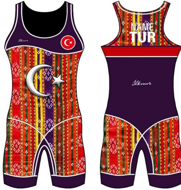
Şekil 1. Çiçek Motifli Mecidiye Tasarımı Teknik Çizimi

Geleneksel kutnu kumaşı kullanılarak üretimi sağlanacak olan kadın güreş mayosu tasarımının ilham kaynağı Gaziantep yöresine özgü olan kumaşların ülkemizi temsil etme düşüncesi olmaktadır. Güreş spor kıyafeti üretiminin ilham kaynağını belirlemek için; yöresel kıyafetler araştırılmış, geleneksel modayı içeren moda eğilimleri gözlemlenmiş, yöresel kumaş bilgilerini içeren kitaplar incelenmiş, spor kıyafetleri tasarımında kullanılabilir renk hikâyeleri oluşturulmuş, çeşitli kumaş ve materyal örnekleri toplanmıştır. Her tasarımcının kendine özgü bir tasarım süreci bulunmaktadır. Uygulamalı anlatımın benimsendiği bu çalışmanın tasarım süreci; model tasarımın elde edilmesi, kalıp tasarımı ve üretimdir.