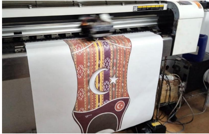
Şekil 3. Çiçek Motifli Mecidiye Tasarımı Basım İşlemi

Şekil 2’de modelin kalıp aşaması gösterilmektedir. Kalıp tasarımı tasarlanan giysinin tüm ölçülerinin açık bir şekilde belirlenmesiyle oluşturulur. Kalıp tasarımı hazırlanırken tasarımın biçimi belirlenmiş, fonksiyonelliği araştırılmış ve üretim tekniği oluşturulmuştur. Sportif yapının benimsendiği model tasarımının kalıp ölçüleri bedeni saran bir yapının oluşturulması için dar çalışılmıştır. Modelin yapımında 38 beden kadın ölçüleri esas alınmıştır. Modelin ölçülendirilmesi tasarımcı tarafından belirlenmiştir. Giysinin kalıp tasarımı photoshop bilgisayar programı kullanılarak gerçekleştirilmiştir.