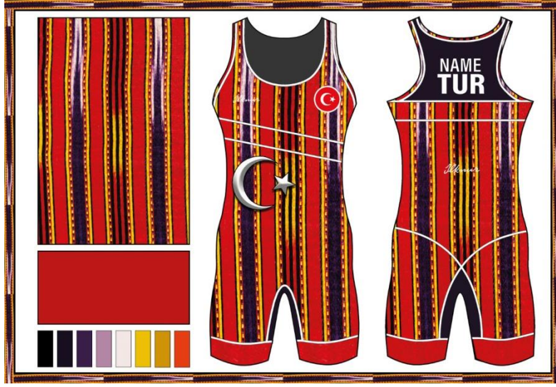
Resim 3. Düz Çizgili Mecidiye Tasarımı

İnsanların üzerinde güçlü ve başarılı imajı bırakmaktadır (İnnap, 2012, s. 35). Popüler görüşte rengin duygusal bir anlamı olduğu savunur ve insanları bu yönden etkilemeye çalışır (Jonaskaite, Althaus, Dael, Dan-Glauser, & Mohr, 2019, s. 272). Popüler kültür dışında yerel yaşamda ise her kültür rengine kendine ait duygular katmış ve farklı anlamlar yüklemiştir. Bu anlamlar coğrafya, bayrak, giyim-kuşam, kullanılan çeşitli eşyalar ile nevrüz kutlamalarındaki renklerin anlamları, sembolik değerleri ve renklere yüklenen çeşitli manalar şeklindedir (Küçük, 2010, s. 185).