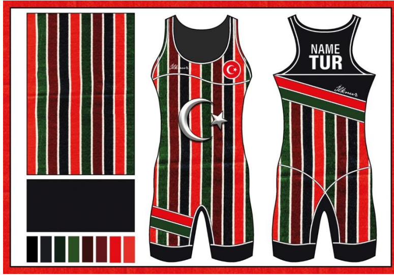
Resim 2. Düz Çizgili Hindiye Tasarımı

Düz Çizgili Hindiye kutnu kumaş çeşidi kullanılarak tasarlanan modele ait moda panosu resim 2’de gösterilmektedir. Düz çizgili hindiye kutnu kumaş çeşidi kullanılarak tasarlanan kadın güreş mayosuna ait tasarıma özgü teknik çizim, kullanılan kutnu kumaş görseli, tasarımda kullanılan en yoğun renk ve renk skalası bir bütün haline getirilerek moda panosu oluşturulmuştur. Kadın güreş mayo tasarımında kullanılan kutnu kumaş deseni düz çizgili hindiye ismini alan desen olmaktadır. Toplam beş renkten oluşan desende tüm renkler eşit miktarda ve boyuna çizgiler halinde kullanılmıştır. Düz çizgili hindiye kutnu kumaşıyla tasarlanan kadın güreş giysisinde kullanılan en yoğun renk lacivert olmaktadır. Lacivert koyu tonlarda olmasının yanı sıra kurumsal mecralarda en sık tercih edilen renktir. Gökyüzü mavisi, gece mavisi gibi farklı isimlerle kullanılan lacivert, bilgeliği, tarafsızlığı, bağlılığı ve adaleti temsil etmektedir. Lacivert, kozmik bir renk olarak kabul edilmektedir. Sonsuzluğu, verimliliği ve otoriteyi simgeler. Bunun için dünyadaki firmaların birçoğu logolarında lacivert kullanmaktadır. Lacivert giyen kişiler çok daha inandırıcı ve karizmatik hissederler.