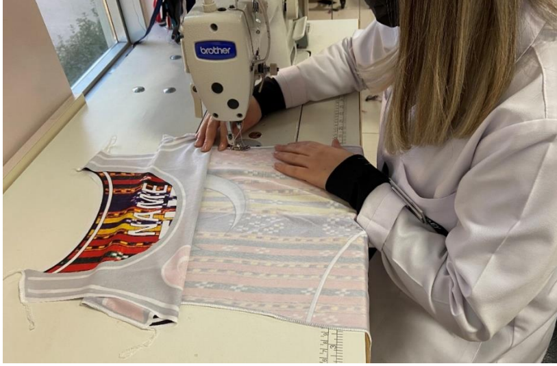
Şekil 4. Çiçek Motifli Mecidiye Tasarımı Dikimi

Dijital baskı yöntemiyle desen kumaşa aktarılmış ve dikim atölyesinde desen sabitlenmiştir (Şekil 4). Kumaş yüzeyine 1 adet ön beden ve 1 adet arka beden olarak basım işlemi tamamlanan tasarım, 1 cm dikiş payı bırakılarak kesilmiştir. Dikim işlemi basımı gerçekleştirilen ön ve arka bedeni bir bütün haline getirme işlemi kapsamaktadır. Kesimi tamamlanan modelin sanayi tipi overlok makinesinde, overlok işlemi yapıldıktan sonra sanayi tipi dikiş makinesinde dikim işlemi gerçekleştirilmiştir. Modelin dikim işlemi yaklaşık 15 dakika sürmüştür.