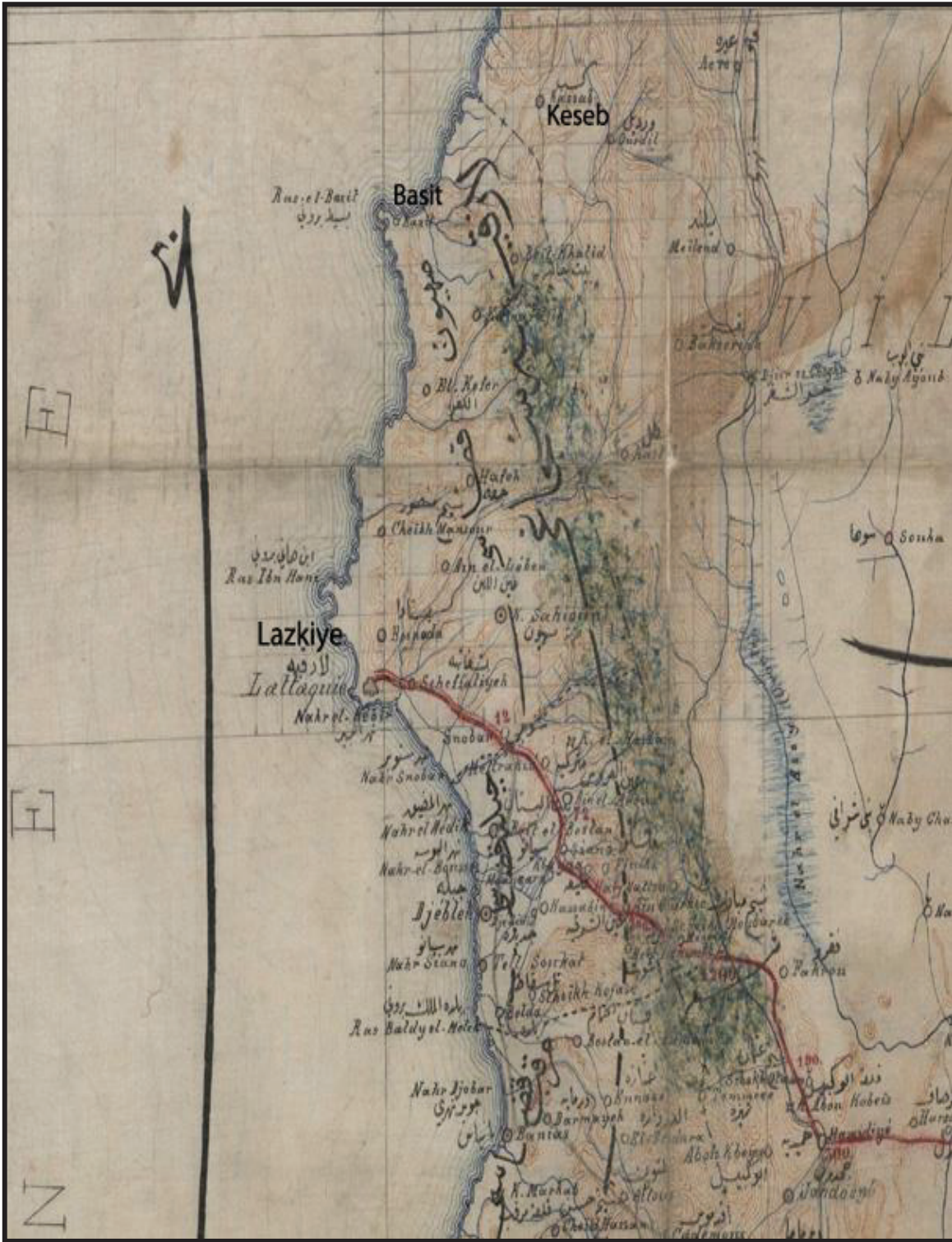
1890'da Beyrut Vilayeti'nin Kuzeyi (BOA. HRT.h. 521)