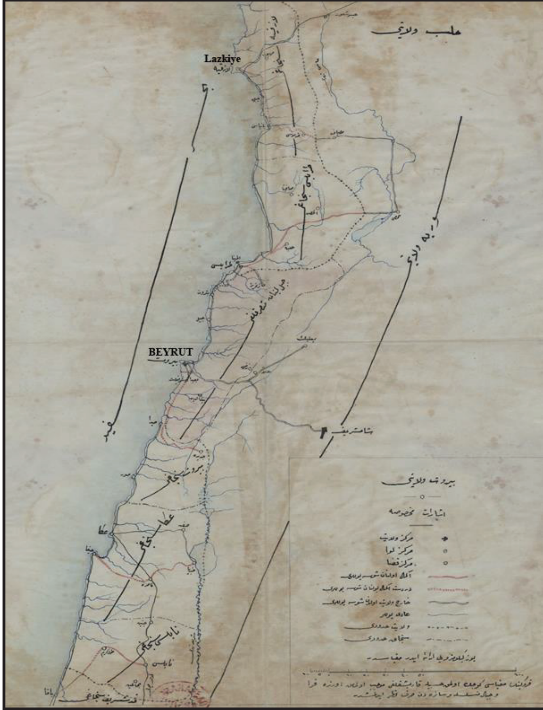
Beyrut Vilayeti Haritası (BOA. HRT.h. 1401).