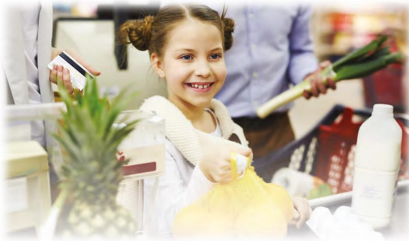
Görsel 2. Tüketici hakları (Evirgen vd., 2020, s. 142)

Aşağıda 5. sınıf Sosyal Bilgiler ders kitabında vergi okuryazarlığı kapsamında olduğu belirlenen görsel 2'ye yer verilmiştir.