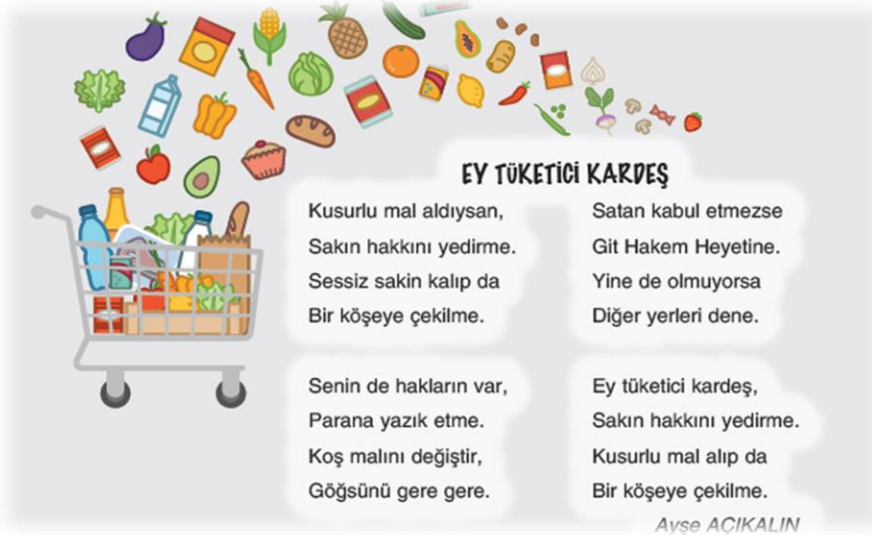
Görsel 1. Belgemizi alalım (ey tüketici kardeş) (Tüysüz, 2020, s. 137)

Aşağıda 4. sınıf Sosyal Bilgiler ders kitabında vergi okuryazarlığı kapsamında olduğu belirlenen görsel 1'e yer verilmiştir.