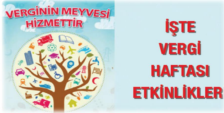
Görsel 3. Vergi haftası etkinlikleri (Şahin, 2019, s. 183)

Aşağıda 6. sınıf Sosyal Bilgiler ders kitabında vergi okuryazarlığı kapsamında olduğu belirlenen görsel 3 sunulmuştur.