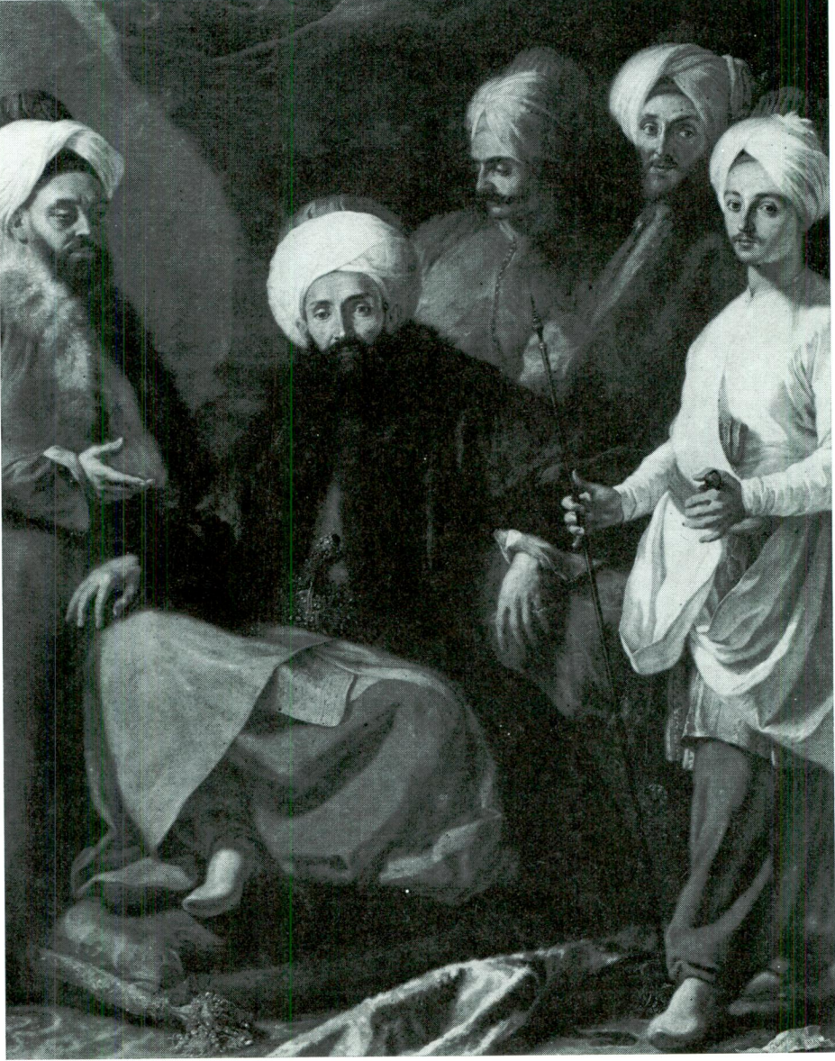
Res. 1 — Elçi Küçük Hüseyin Efendi'nin ressam Bonito tarafından yapılan tablosu (Madrid'de Museo del Prado'da)