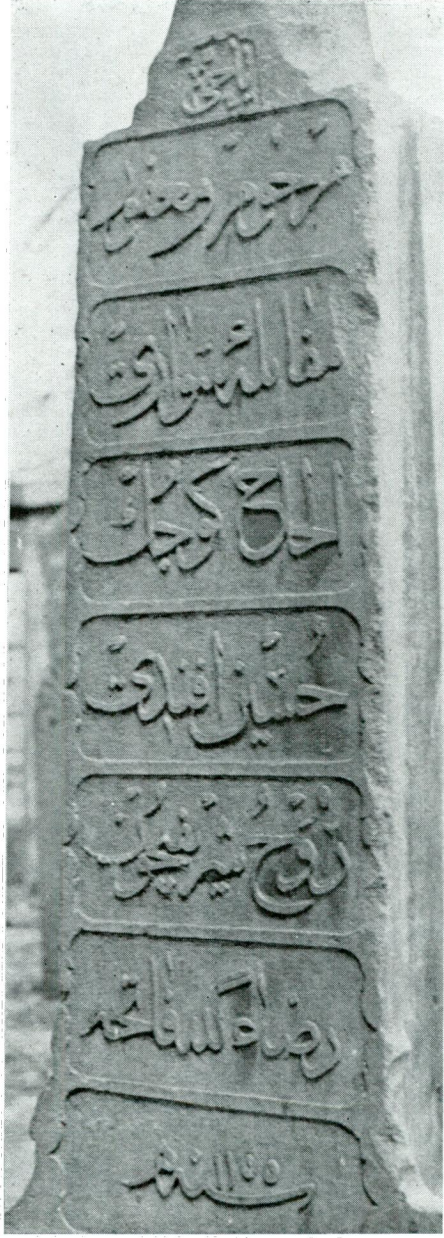
Res. 5 — Küçük Hüseyin Efendi'nin mezar taşı kitabesi