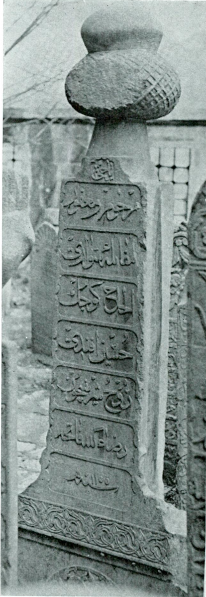
Res. 4 — Küçük Hüseyin Efendi'nin İstanbul'da Atik Ali Paşa camii haziresindeki mezarı