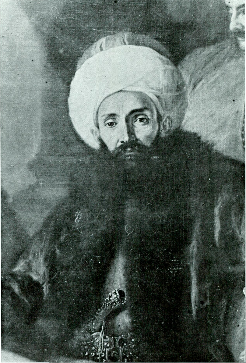
Res. 9 — Türk elçisi Küçük Hacı Hüseyin Efendi'nin baş resmi