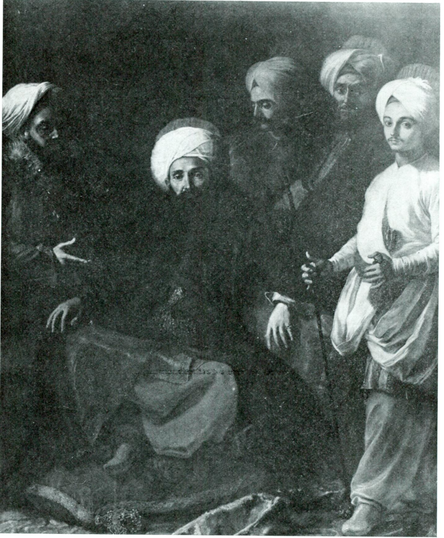
Res. 2 — Elçi Küçük Hüseyin Efendi'nin ressam Bonito tarafından yapılan tablosu ( Napoli'de Palazzo Reale'de )