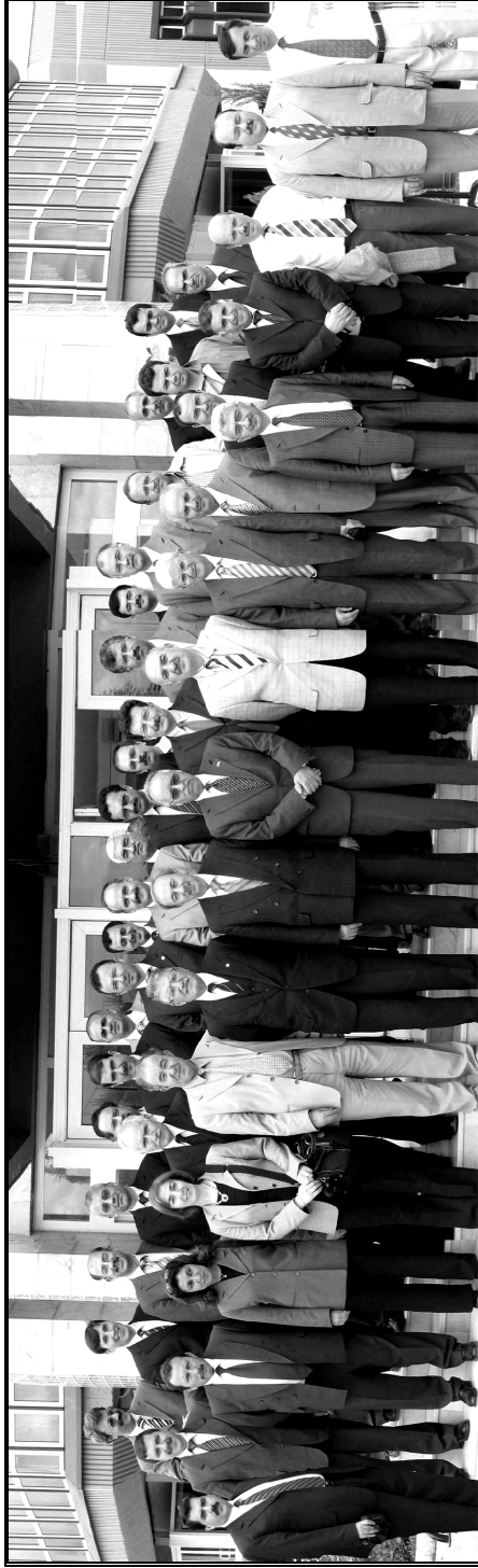
1-2 Haziran 2005/Konya İslam Tarihi Öğretim Elemanları Toplantısı Katılımcıları toplu halde.