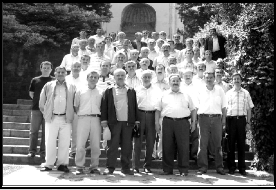
Resim 1: Yeşil Türbe – BURSA