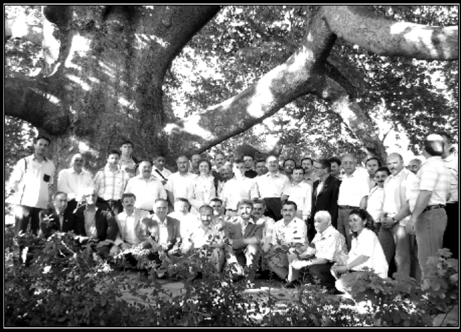
Resim 2: İnkaya Çınarı – BURSA