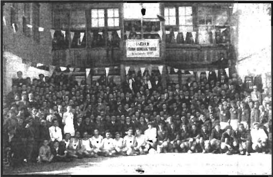
Ek:5) İşkeçe Türk Gençler Yurdu