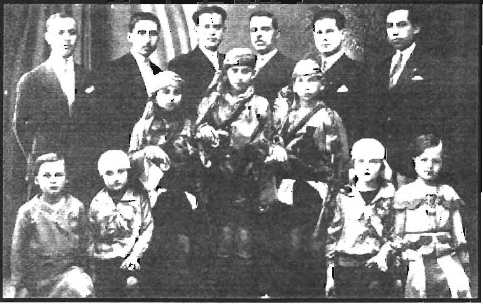
Ek:6) Işkeçe Türk Birlięi Kurucu ve Üyeleri