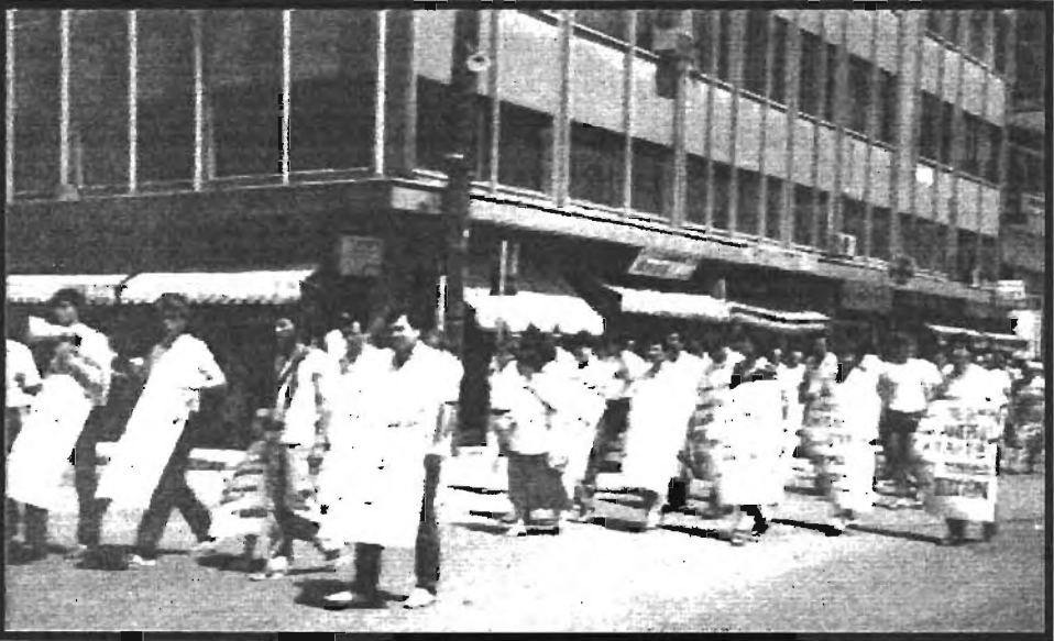
Ek:7) Üniversite Diplomalari Taninmayan Batı Trakyalı Gençlerin Protesto Yürüyüşü