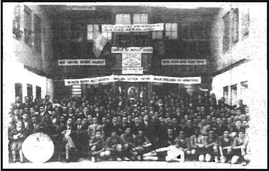
Ek:4) İşkeçe 1933