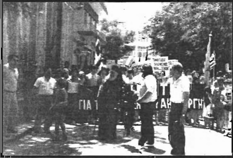
Ek:3) Gümülcine Metropolidi Damaskinos'un Gümülcine Başkonsolosluğu'na Protesto Yürüyüşü