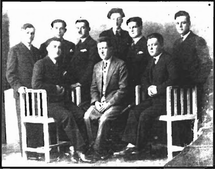
Ek:2) Işkeçe Türk Gençlik Yurdu İlk İdare Heyeti (14 Nisan 1927)