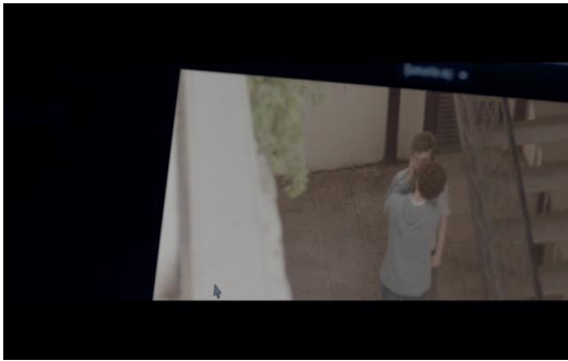
Görsel 1: Umut’un gizlice çekilen fotoğrafı

Umut’un gizlice fotoğrafının çekilmesi ve e-posta aracılığıyla yayılması filmin önemli dönüm noktalarından bir tanesidir. Çekilen fotoğrafı gördükten sonra Umut’un verdiği tedirgin ve korku dolu tepki, yaşayacağı zorbalığı incelemektedir. Bu sahneden sonra, kesme ile havuzdaki su altı sekansına geçilir. Metaforik olarak daha sonra yaşanacakların habercisi niteliğinde olan bu sekans, Umut’un ötekileştirileceğinin, “boğulacağının” bir ön izlemesi gibidir. Söz konusu fotoğraftan sonra arkadaşları tarafından mimlenen Umut, sözlü ve fiziksel aksiyonlara maruz kalır. Bu sahne itibarıyla Umut damgalanmıştır. Şüphelerin fotoğraf üzerinden gerekçelendirilmesi, güvencesizlik hissinin giderek kronik bir hal almasına neden olmuştur. Zira, Umut’un endişeli ve sıkılgan bakışları “yerleştirildiği kategorinin olumlu olduğu hallerde bile içten içe onu sahip olduğu damga üzerinden tanımlayacaklarını bilmesinden ileri gelir” (Goffman, 2020, p. 42).