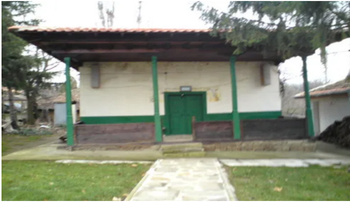
Şekil 2: Alvanlar (Yablanovo) Osmanlı döneminden kalan eski cami.

Bu bağlamda belirtmelidir ki Yablanovo/Alvanlar köyü Alevi-Bektaşileri o güne kadar yabancı oldukları bir ilgiyle karşılaşmışlardır. Bu ilgi İran Şiiileri tarafından gösterilmekte ve Alvanlar Bulgaristan genelinde ilk çalışma sahasına eklenmektedir. Yeni caminin inşaatını İran Büyükelçiliği finanse etmektedir. Bu çok özel ve araştırmaya değer bir konu olduğu için ayrı bir makale başlığı altında ele alınacaktır. Burada sadece Alvanlar köyü sakinleri Alevi-Bektaşilerin böyle bir durumla karşı karşıya kaldıklarını belirtmek için değindik.