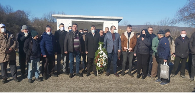
Şekil 1: Kotel'in (Kazan) Yablanovo (Alvanlar) köyünde Bulgarlaştırma sürecine karşı protesto eylemleri sırasında şehit düşenlerin anısına yapılan anıt çeşmesine her yıl çelenk ve çiçek bırakılarak anılmaktadır.

Makalenin amacı günümüz Alvanlar köyü halkının kendilerini tanımlarken tercihlerini ve dini durumlarını tespit etmektir. (Seyman, 2006, 96-104). Bulgaristan yetkililerinin tüm platformlarda Türklere karşı “etnik tolerans model siyaseti” uyguladıkları iddiasıdır. Bu çerçevede Bulgaristan Cumhuriyeti yöneticileri tarafından sıklıkla söz konusu uygulamanın başka bir örneğinin bulunmadığına yönelik ifadeleri oldukça önemlidir (Dalkılıç-Biçer-Demirli, 2012; Kışman-Aydın, 2019, 639-657; Alptekin-Lika-Dağdelen-Erdoğu, 2020). Bunun doğruluğu veya pratikteki uygulamalarının sonuçları ancak bilimsel yöntemlerle yapılacak olan bir çalışma ile tespiti mümkündür. Bu araştırma günümüzde Bulgaristan Cumhuriyeti vatandaşı Türk kökenli vatandaşların bahsi geçen uygulamadan haberdar olup olmadığı ve pratikte hayatlarına yansıma durumu yapılacak araştırmalarla tespit edilip ortaya çıkarılabilir.