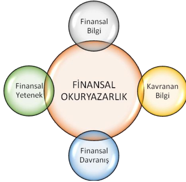
Şekil 1. Finansal okuryazarlık becerisi kavramsal modeli (Hung, Parker & Yoong, 2009)

Şekil 1'deki söz konusu bileşenlerin esasında birbiriyle doğrudan ilişki içinde olup nihayetinde harmanlanarak finansal okuryazarlık becerisini oluşturduğu söylenebilir (Bozkurt & Toktaş & Altner, 2019).