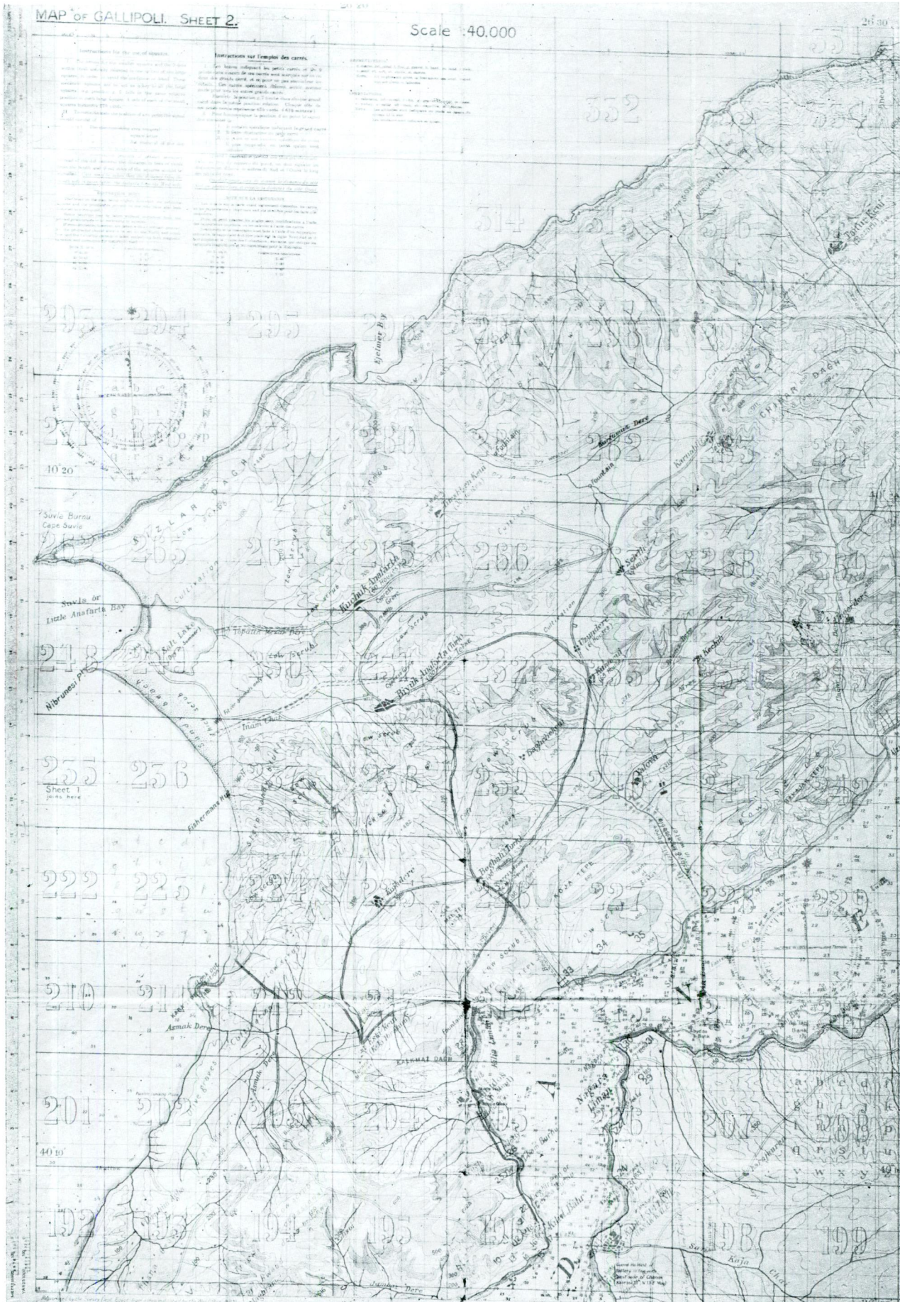
Çanakkale’de Arıburnu cephesinde İngilizlerden elde edilen ve Gelibolu yarımadasının bir kesimini gösteren harita