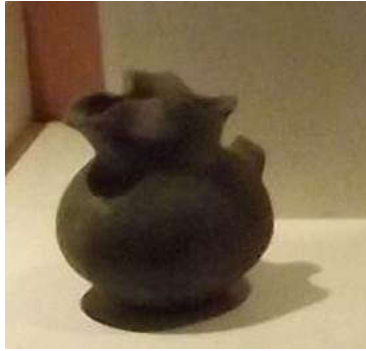
Şekil 7: Pişmiş Toprak Testi

Şekil 5'te müzenin steller seksiyonunda sergilenen eserlerden biri görülmektedir. Roma dönemine ait mermerden yapılmış olan yuvarlak formlu, bitki motifleri ile bezenmiş bu eserin incelikli bir el işçiliğini yansıması bakımından etkili bir örnek olabileceği düşünülmüştür.