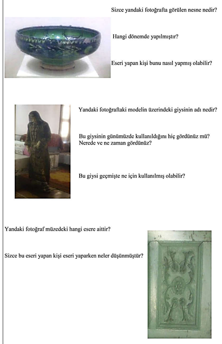
Şekil 2: Bağlamsal Sanat Tarihi Çalışma Sayfası

kurulması, böylelikle geçmişe ait kültürün yorumlanmasını sağlamak amacıyla hazırlanan Bağlamsal Sanat Tarihi Çalışma Sayfası aşağıda yer almaktadır.