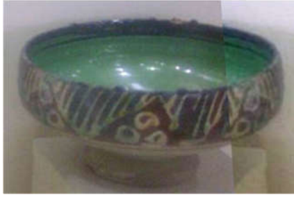
Şekil 15: Porselen Kâse