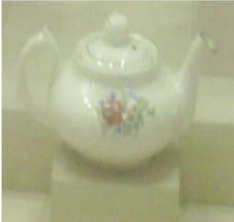
Şekil 13: Porselen Demlik

Nizamoğlu Konağı Etnografya Müzesine yönelik uygulamalar için müzedeki eserlerin görselleri Gümüş'ün (2013) Etnografya Müzelerinde Sergileme ve Teşhirin Hikâyesi (Ankara, Çankırı, Eskişehir, Yozgat Etnografya Müzeleri Örneği ile) başlıklı yüksek lisans tezinden alınmıştır. Seçilen eserler ve öğrencilerin sanatsal çalışmalarından bazı örnekler aşağıda verilmiştir. Müzenin eski kapılarındaki kabartmalar ve müzede sergilenen 19. yy. Osmanlı İmparatorluğu dönemi seramikleri, kahve ve baharat kapları ortaokul öğrencilerine yönelik yaptırılabilir eserler olarak tespit edilmiştir.