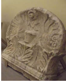
Şekil 5: Stel