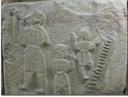
Şekil 11: Alaca Höyük Sfenksli Kapı

Şekil 9 Alaca Höyük Sfenksli Kapı Batı Kulesi, Boğa/Fırtına Tanrısı ve tapınma sahnesinin betimlendiği bir rölyef, Şekil 10 ise ilgili rölyeften yola çıkılarak yapılan öğrenci çalışmasını yansıtmaktadır. Batı kulesinde kapıya yakın köşeden itibaren kült töreni sahneleri başladığı bu rölyefin Hititlerin kültürünü yansıtan bir örnek olabileceği düşünülmüştür.