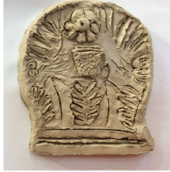
Şekil 6: Öğrenci Çalışması

Şekil 5'te müzenin steller seksiyonunda sergilenen eserlerden biri görülmektedir. Roma dönemine ait mermerden yapılmış olan yuvarlak formlu, bitki motifleri ile bezenmiş bu eserin incelikli bir el işçiliğini yansıması bakımından etkili bir örnek olabileceği düşünülmüştür.