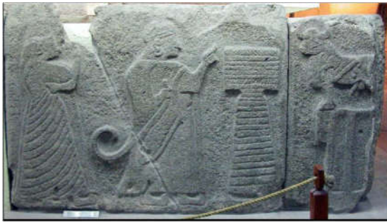
Şekil 9: Alaca Höyük Sfenksli Kapı Batı Kulesi,

Alacahöyük Müzesine yönelik sanatsal uygulama örnekleri için, Alacahöyük'teki Sfenksli Kapıda bulunan Hitit uygarlığına ait rölyeflerden ve öğrencilerin yaptığı sanatsal çalışmalardan iki örnek aşağıda verilmiştir.