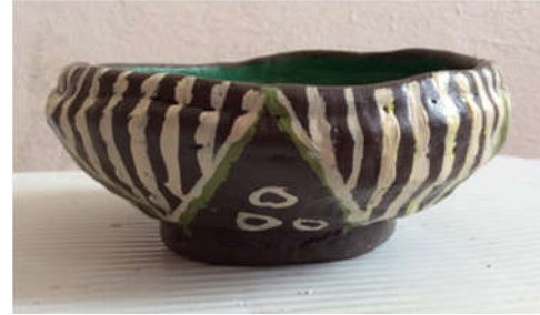
Şekil 16: Öğrenci Çalışması

Şekil 15'de müzenin porselen eserler seksiyonunda teşhir edilen 19. – 20. yüzyıl Osmanlı dönemine ait seramik bir kâse görülmektedir. Şekerlik olarak işlev gördüğü düşünülen kâsenin içi yeşil sırla kaplanmış, dış yüzeyi ise ters yönlü olarak düzenlenmiş üçgenlerle biçimlendirilmiştir. Zemininde kızıl kahvenin kullanıldığı kâse, krem renginin kullanıldığı ince bordür ve küçük çemberlerle bezenmiştir. Bu esere ilişkin öğrencinin yorumunu yansıtan sanatsal çalışma Şekil 16'da görülmektedir.