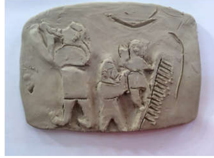
Şekil 12: Öğrenci Çalışması

Şekil 11'de Alaca Höyük Sfenksli Kapı Batı Kulesi Akrobatlar Ortostati'nı gösteren bir rölyef yer almaktadır. Sfenksli Kapı'nın batı kulesine, ait ilk kabartma dizisinde, girişe göre beşinci sırada bulunmuş olan ortostat üzerinde üç kişinin bulunduğu bir kompozisyondur. Şekil 12'de kil tablet üzerine öğrenci sanatsal çalışmasında bu sahnenin yeniden yorumlanmasını göstermektedir.