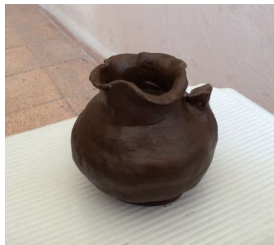
Şekil 8: Öğrenci Çalışması

Şekil 7'de müzenin üst katında camekânlı seksiyonlarda sergilenen Roma dönemi pişmiş topraktan yapılan testiler görülmektedir. Dönem özelliklerini yansıması bakımından bu testilerin ilginç formlarının da kültürel özellikleri yansıttığı ve üç boyutlu sanatsal uygulamalara uygun bir form olarak değerlendirilmiştir.