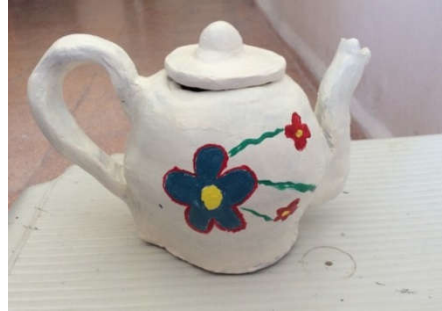
Şekil 14: Öğrenci Çalışması

Şekil 13'te müzenin porselen eserler seksiyonunda teşhir edilen 19. – 20. yüzyıllara ait Osmanlı dönemi porselen demlik görülmektedir. Ana formda beyazın kullanıldığı bu eserin yan yüzeyinde yeşil, kırmızı ve mavi renklerin kullanıldığı stilize edilmiş çiçek motifleri yer almaktadır. Şekil 14'de de öğrencinin bu eseri ve süslemelerini yorumlayışı görülmektedir.