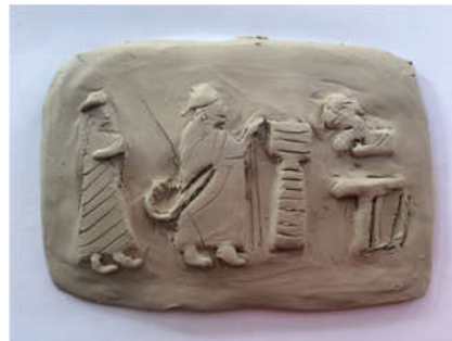
Şekil 10: Öğrenci Çalışması