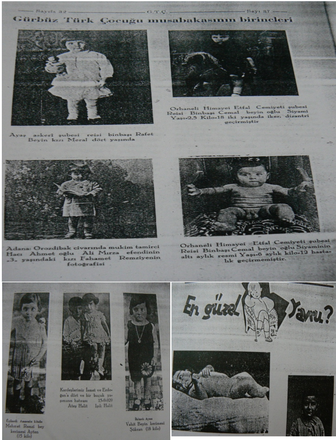
Foto 17-22: Gürbüz Türk Çocuğu ve En Güzel Yavru Yarışması sonuçları