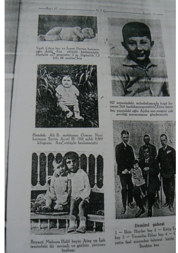
Foto 13-16: Gürbüz Türk Çocuğu yarışmasının sonuçlanması ve kazananların ilanı