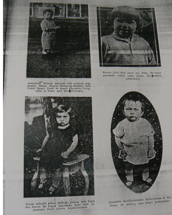
Foto 9-12 Gülbüz Çocuk Müsabakasına katılan ve dereceye giren çocukların fotoğrafları