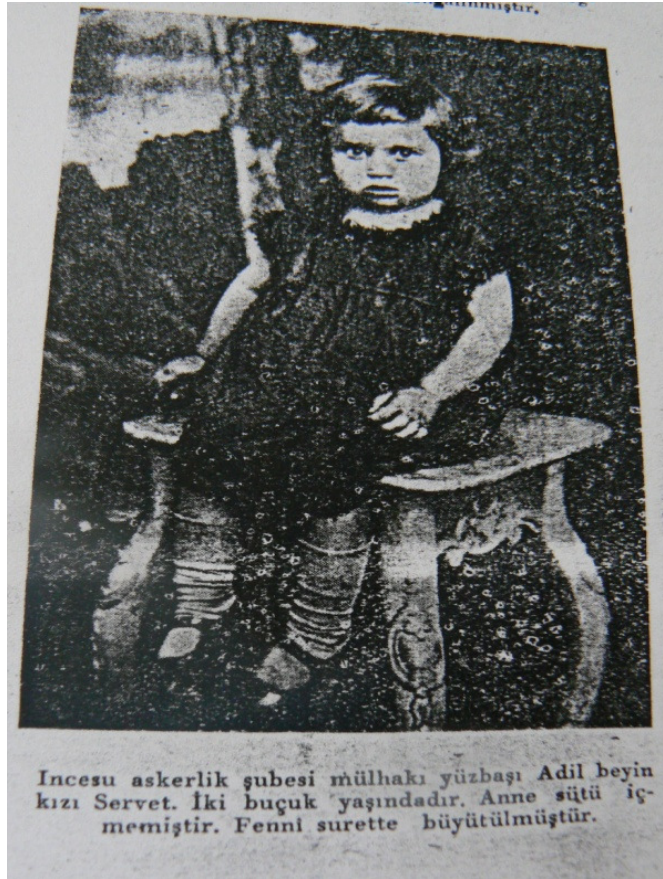
Foto 7- Yarışmaya katılan çocuklardan biri