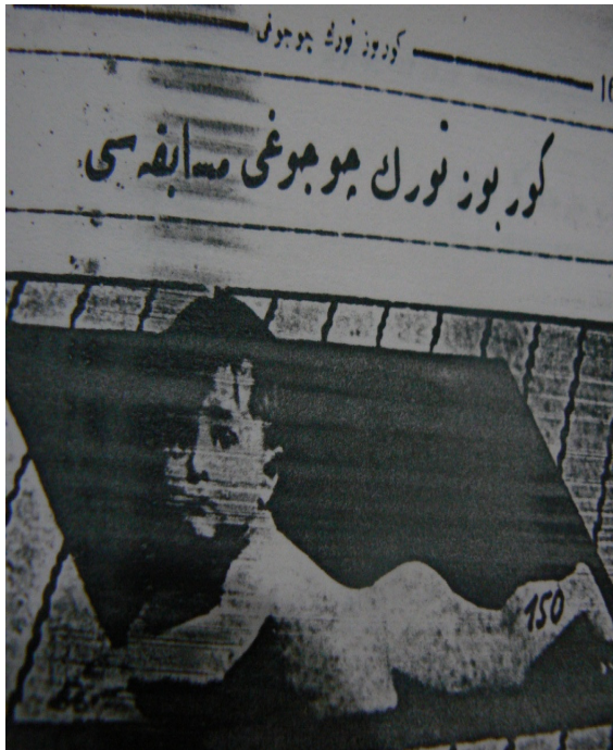
Foto 3-4: Gürbüz Türk Çocuğu müsabakasını kazanan gürbüz çocuklardan örnekler