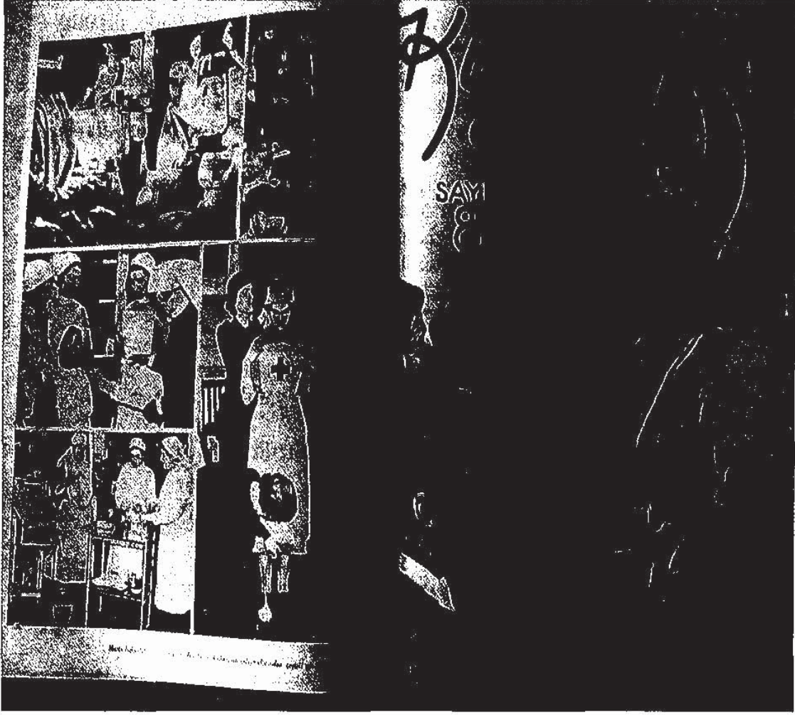
Kızılay, VIII, Şubat 1943.