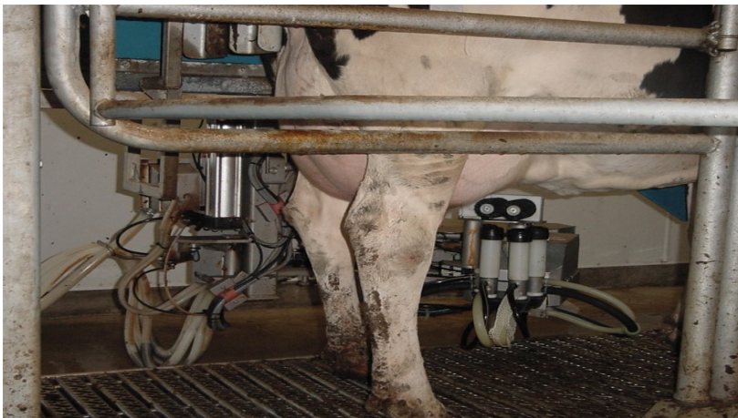
Şekil 1. Robotlu Sağım Sisteminde Sağım Bölmesi

Sağım bölmesi, giriş ve çıkışı otomatik olarak kontrol edilebilen, ineğin girebileceği büyüklükte bir odacıktır (Şekil 1). Bölmenin ön tarafına ineklerin girmelerini teşvik edici, konumu hayvanın bedenine göre ayarlanabilen bir yemlik yerleştirilmiştir. Sağım bölmesi ahırın tam orta noktasında bulunabileceği gibi ahır içinde farklı bir yere de konumlandırılabilir (Halachmi et al 2000, Halachmi et al 2003, Türkyılmaz 2005).