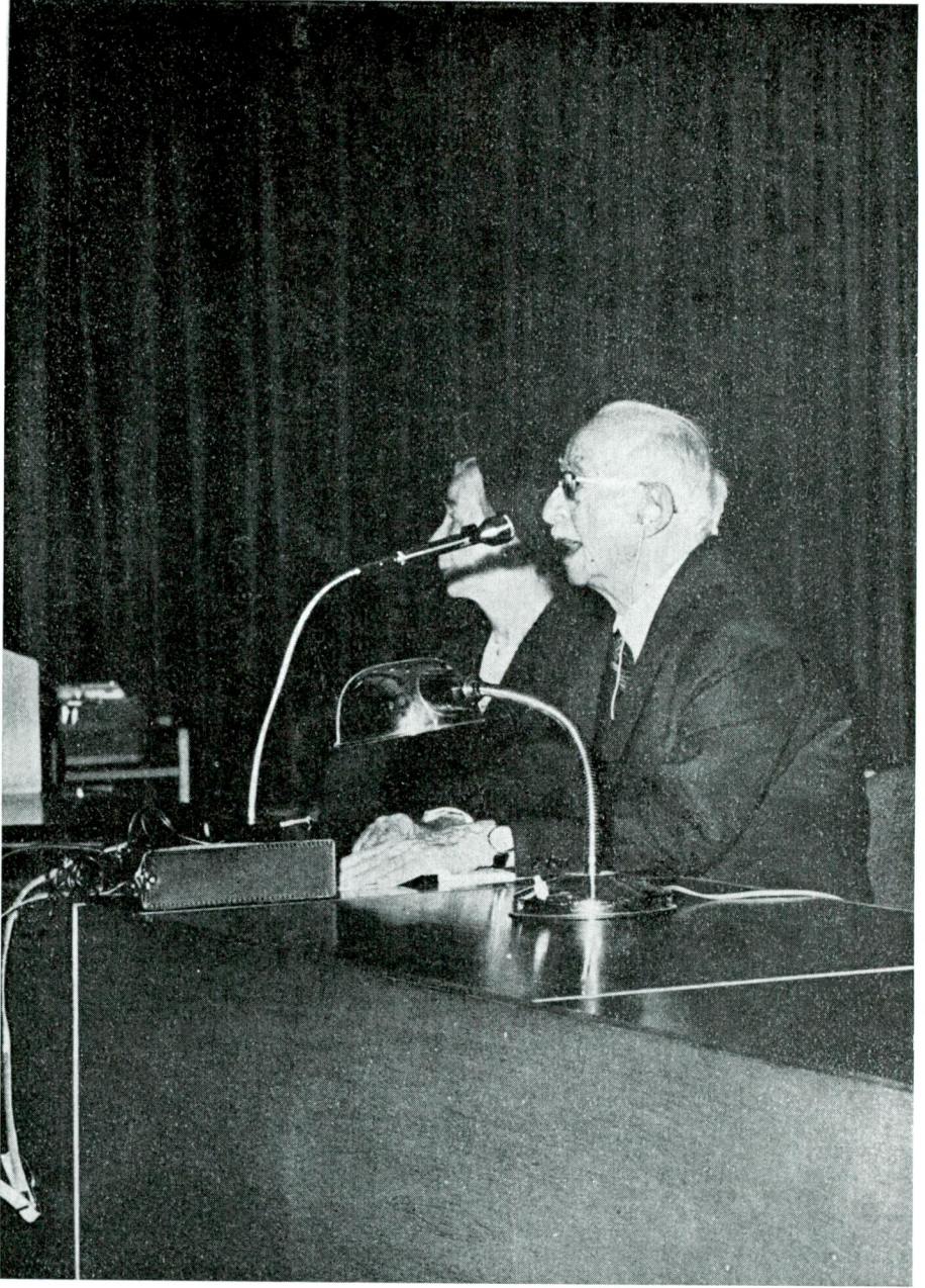
Sayın İnönü seminerde konuşmasını yaparken (yanında sayın eşi)