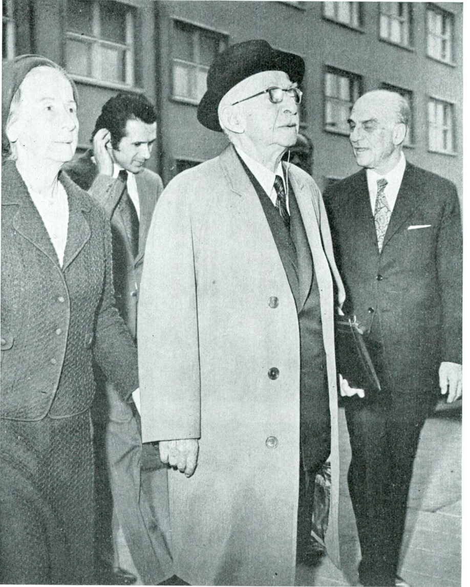
Sayın İnönü seminare gelirken sayın eşi ile birlikte