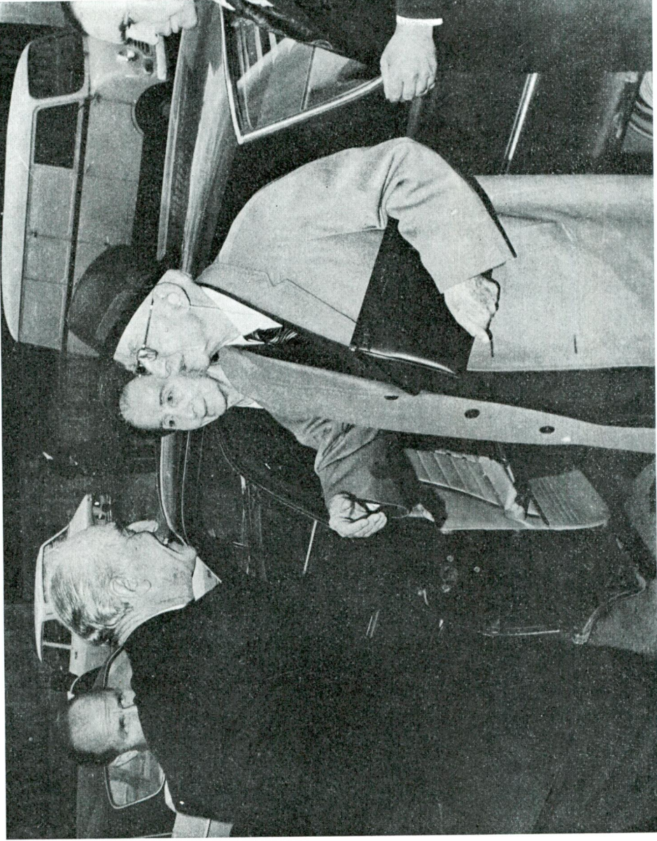
Sayın İnönü, Türk Tarih Kurumunca düzenlenen "Cumhuriyetin 50. yıldönümü" seminerinde konuşmasını yapmak üzere 23 Ekim 1973 günü Kuruma gelirken