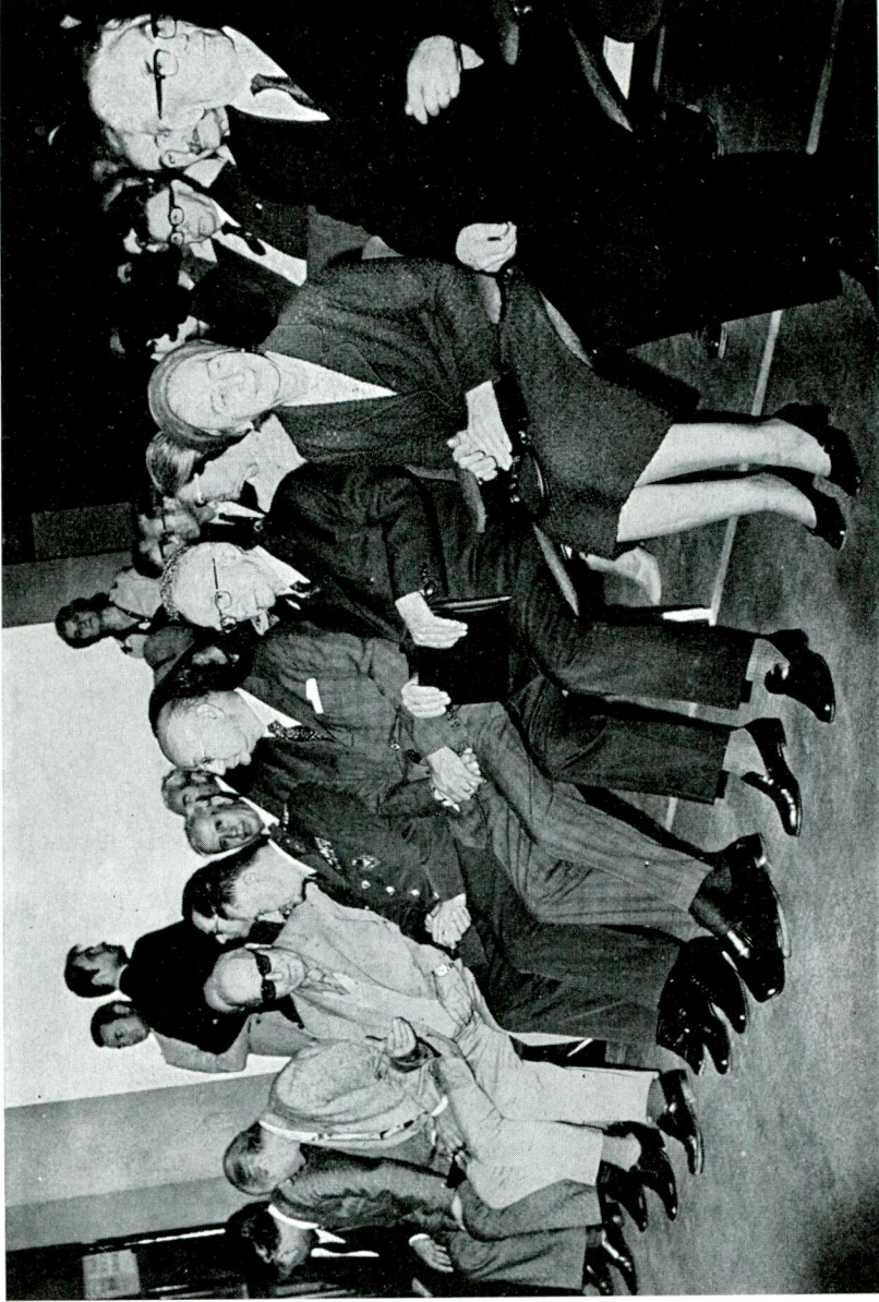
Sayın İnönü ve eşi seminare katılanlar arasında