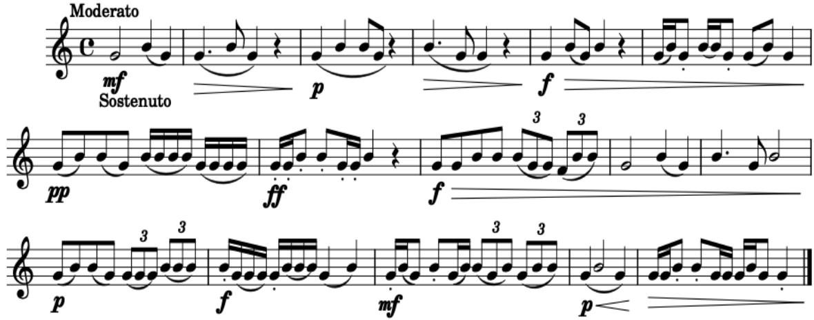
Şekil 7. Eser Çalışması 2

Eser çalışmaları edinilen bilgi ve birikimin sanata dönüştüğü yerdir. Bir eseri yorumlamak ve herkese hitap eden bir atmosfere dönüştürmek çok meşakkatli bir yoldur. Eseri sabırla, özveriyle ve azimle