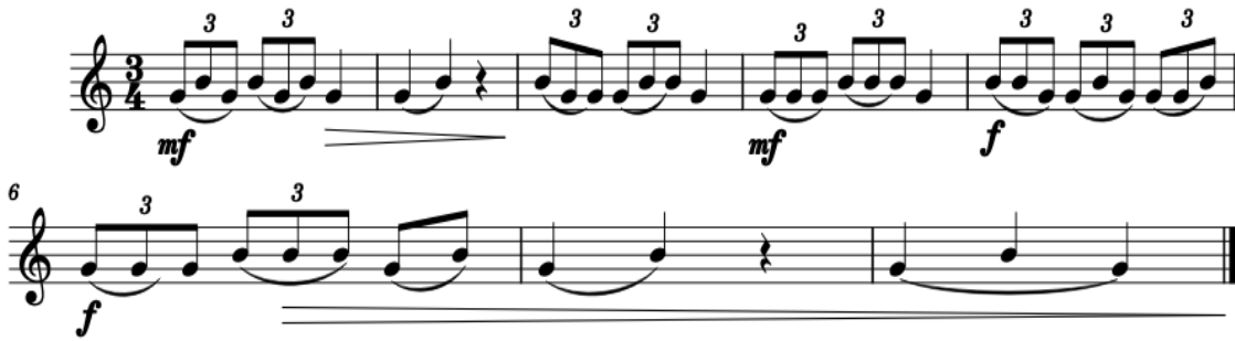
Şekil 5. Çalışma Önerisi 5

Çalışma 4’de onaltılık tekrarlanan notaların sık bir şekilde çalınması sağlanacaktır. Parmak ve dil hareketinin aynı anda olması çalışmanın amacıdır. Bağlı ve dilli artikülasyonlara dikkat edilmelidir. Bir yandan nüans farkları ortaya çıkarılırken bir yandan da seslerin tane tane gelmesine özen göstermeliyiz. Crescendo (sesin giderek yükselmesi) Decrescendo (sesin giderek alçalması) için piyano nüansının belli bir ayarda başlaması tonumuzu ve ses yükselişini kontrol etmek açısından önemlidir.