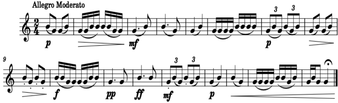
Şekil 6. Eser Çalışması 1

diyaframı iyi kullanmak seslerin daha dolgun gelmesini sağlayacaktır. Nüans farklarına dikkat etmek ise nefesimizi tasarruflu kullanmamızı ve kendimizi çok yormadan uzun saatler çalışmayı sağlayacaktır.