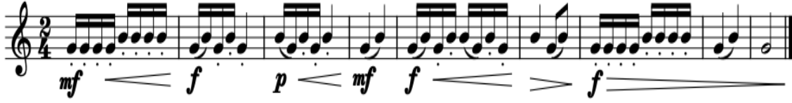
Şekil 4. Çalışma Önerisi 4

Çalışma 4’de onaltılık tekrarlanan notaların sık bir şekilde çalınması sağlanacaktır. Parmak ve dil hareketinin aynı anda olması çalışmanın amacıdır. Bağlı ve dilli artikülasyonlara dikkat edilmelidir. Bir yandan nüans farkları ortaya çıkarılırken bir yandan da seslerin tane tane gelmesine özen göstermeliyiz. Crescendo (sesin giderek yükselmesi) Decrescendo (sesin giderek alçalması) için piyano nüansının belli bir ayarda başlaması tonumuzu ve ses yükselişini kontrol etmek açısından önemlidir.