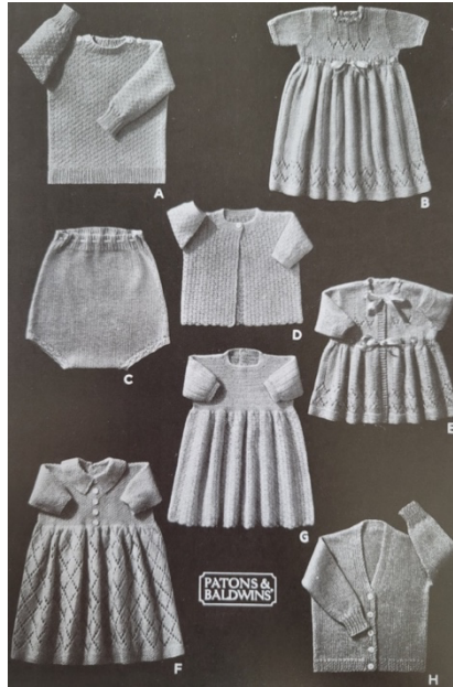
Görsel 11: Çocuk örme giyim katalogu, Woolcrafts dergisi, 1937

16. ve 17. yüzyıllarda sanayileşmeye kadar evde örgü örmek kabul gören bir kazanç aracı olmuş, 19. yüzyılın ortalarından itibaren, özellikle kadınları hedef alan küçük örme makineleri ev kullanımına girmiştir. Gereçleri ne olursa olsun domestik bir aktivite olan örücülük, çocuk giysileri, iç çamaşırları, kazak gibi sıcak tutan giysiler ve battaniye gibi ürünlerle ailenin ve toplumun ihtiyaçlarını karşılamıştır (Black, 2012, s.103). Eldiven, çorap, şapka, bere, kazak ve iç çamaşırı gibi örme giyim ürünleri, evde aile için elle yapılan en temel ürünlerden olmuştur. Günlük yaşamın temel parçaları olan söz konusu ürünlerle, örme kumaş yapısının doğal esnekliğinden yararlanılarak vücudun şeklini alan pratik giysiler oluşturulmuştur. Zamanla bu ürün yelpazesine yenileri eklense de birçok öge yüzyıllardır temelde değişmeden kalmıştır (Black, 2012, s.110). Özellikle çocuk örme giyimine moda döngüsü çok az dokunmuş, çocuk giysileri form, desen, renk açısından sabit kalmıştır. Ev içi emeğine dayanan çocuk örme giyim üretimi, 20. Yüzyılın sonuna kadar devam etmiştir. Çocuk örme giyim ürünlerine dair örnekler erken dönem örme dergilerinden çağdaş dönem dergilerine kadar izlenebilmektedir (Görsel 11) (Black, 2012, s.112).