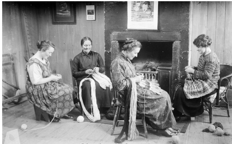
Görsel 7: Örücü kadınlar, Shetland Adaları

Kadın kimliğinin inşasında el örücülüğünün analizini yapan Abrams (2006), Shetland Adaları örneğini incelemiştir. Buna göre, bölgede ticari faaliyetin merkezinde yer alan el örücülüğü kadın merkezli bir kültür yaratmıştır. Abrams (2006), Shetland Adalarında 19. ve 20.yüzyılda yünlü el örmesi giyim ana ekonomik faaliyet haline gelmesinin nedeninin kadınların kilit bir emek performans sergilemeleri olduğunu söylemiştir. Buna göre bölgede örücü kadınlar örme giyim piyasasını ticarete entegre etmiş ve geniş çevrede ekonomik ilişkilere dayanan bir kimlik yaratmışlardır. 1920'lerde Galler Prensi tarafından popüler hale getirilen ada desenli kazaklar bölge örücülüğünün kimliği haline gelmiştir. Bugün dahi kadınların ürettiği bu el örgüsü ürünler Shetland'ın kendini dış dünyaya tanıtmaya araçlarından biridir. Farklı renklerle oluşturulan geleneksel bir örme tekniği olan Fair Isle'ı kullanarak yüksek kaliteli el örgüsü ürünler üreten kadınlar, deniz aşırı pazarlarda çalışmaları için yüksek fiyatlar talep edebilir güçte ve durumdadır. El örmesinin Shetland geleneği ve kültürünün bir sembolü olarak konumlandırılması, günümüze değin büyük yankı uyandırmıştır. Bir kadın faaliyeti olan örücülük çok dar bir ekonomik temele sahip yer olan adaları kalkındırmıştır. Shetland'da ürünlerin takas edildiği nakitsiz bir ticaret sistemi kadınların karşılıklı bağlantıları üzerine kurulmuş ve örücülükte kadınların üretici kimliğini daha da şekillendirmiştir (Abrams, 2006, s.150-153).