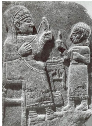
Görsel 3: Eğirici kadın tasviri, Geç Hitit Dönemi, Maraş Steli

Bu doğrultuda Antik Mezopotamya'da erkek tekstil işçisine rastlansa da tekstil işçiliği kadın işi olarak adlandırılır. Ticaret ağları genişleyip üretim hacmi arttıkça tekstil ürünleri daha organize şekilde üretilmişlerdir (Lion ve Michel, 2016, s.3). Antik Anadolu uygarlıklarında da tekstil ürünlerinin üretimine dair işlerin kadın emeğine dayandığı çeşitli tasvirlerden anlaşılmaktadır. Geç Hitit Dönemine tarihlenmiş olan mezar stelinde eğirici kadın tasviri dikkat çekmektedir (Görsel 3). Sol elinde kirmen, sağ elinde yün tutar şekilde betimlenen üretici kadın tasviri örneği Hitit Dönemi Anadolu'sunda da tekstil ürünlerinin üretiminin kadın emeğine dayandığını gösteren örneklerdendir (Pınarcık, 2020, s.153).