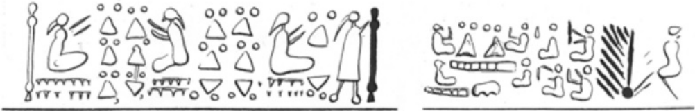
Görsel 2: Dokumacı kadın tasvirleri, Suriye

Bu doğrultuda Antik Mezopotamya'da erkek tekstil işçisine rastlansa da tekstil işçiliği kadın işi olarak adlandırılır. Ticaret ağları genişleyip üretim hacmi arttıkça tekstil ürünleri daha organize şekilde üretilmişlerdir (Lion ve Michel, 2016, s.3). Antik Anadolu uygarlıklarında da tekstil ürünlerinin üretimine dair işlerin kadın emeğine dayandığı çeşitli tasvirlerden anlaşılmaktadır. Geç Hitit Dönemine tarihlenmiş olan mezar stelinde eğirici kadın tasviri dikkat çekmektedir (Görsel 3). Sol elinde kirmen, sağ elinde yün tutar şekilde betimlenen üretici kadın tasviri örneği Hitit Dönemi Anadolu'sunda da tekstil ürünlerinin üretiminin kadın emeğine dayandığını gösteren örneklerdendir (Pınarcık, 2020, s.153).