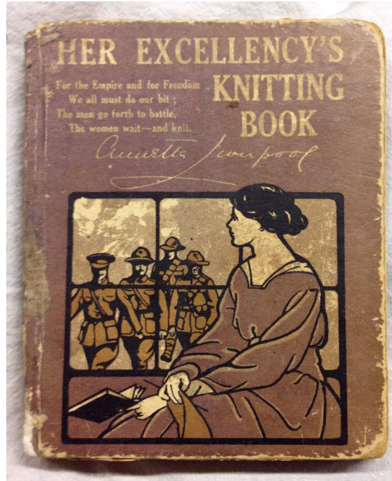
Görsel 8: “Her Excellency’s Knitting Book” kitabı

Örücülük, kadınlar arasında ev içi emeğine dayanmış olsa da I. ve II. Dünya Savaşları, Kırım Savaşı, Amerikan İç Savaşı gibi savaşlarda askeri birlikler için çorap, kar maskesi, kazak, kamuflej gibi ürünlerin üretilmesine katkıda bulunarak kamusal teminler sağlamıştır. Kırım Savaşı'ndan bu yana her büyük çatışmada, orduya giyim desteği sağlamak adına örücülük öne çıkmıştır (Rutt, 1989, s.134-135). Örücülük, savaş cephelerinde yer almayan kadınlar için “cephe ardı desteği” gibi bir işleve dayandırılmıştır (Rutt, 1989, s.139) (Görsel 8). Hatta bu çabalar yardım kuruluşları tarafından koordine edilmiştir. I. Dünya Savaşı süresince örücü kadınlar, soğuk iklim koşullarındaki ordu için bere, eldiven, atkı, fanila ve özellikle çorap üretmişlerdir (Black, 2012, s.136).