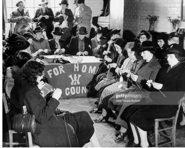
Görsel 9: II. Dünya Savaşı Dönemi Örücüleri, 1939, İngiltere

Savaş dönemindeki örücülük faaliyetlerine yönelik örme desen yayıncıları ve iplik şirketleri, bu amacı desteklemek için yayımlar yapmıştır. Zafer sloganlarıyla hazırlanan yayınlarda kar maskeleri, çoraplar ve eldivenler dâhil olmak üzere, cephe giyimi için ayrıntılı talimat broşürleri hazırlanmıştır (Görsel 10). Amerikan başkanının eşi Eleanor Roosevelt ve İngiltere Kralı George VI'nın eşi Kraliçe Elizabeth söz konusu yayımlar için poz vermişlerdir (Black, 2012, s.137).