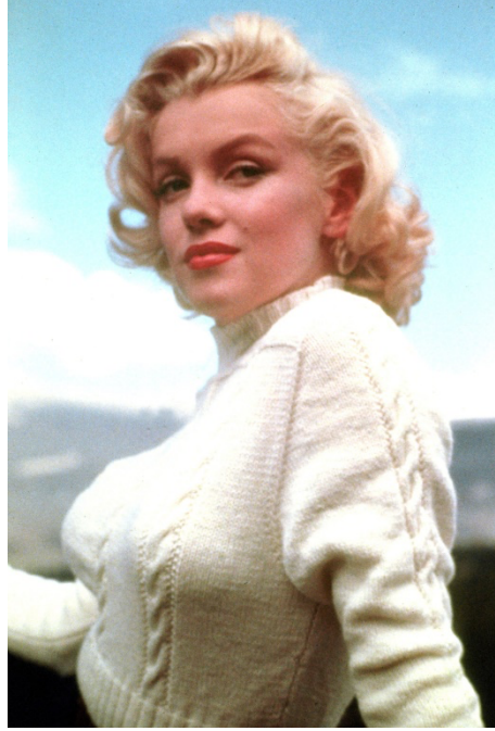
Görsel 12: Marilyn Monroe ve örme kazak modası

sayıda popüler olan düşük fiyatlı örgü kitapçıklarının ve onların desenlerinin yayınlanmasıyla desteklenmiştir. 1920 ve 1930'ların yaygın silüeti garçonne, jazz müzik dinleyici kitlesinin görseller üzerindeki etkisiyle flapper silüetine doğru evrilmiştir. Silüetteki bu değişim “domestik kadın” tarzından uzaklaşılarak daha çocuksu bir tarza gidilmesiyle sonuçlanmıştır. Dönemin örne giyiminde bu etki izlenebilmektedir (Görsel 12) (Black, 2012, s.161).