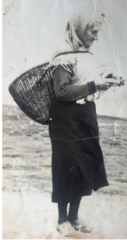
Görsel 5: Shetland'ın batı yakasında gezici örücü kadın, 1950'ler

çekilmiş fotoğraftaki gezici örücü kadın örneğinde olduğu gibi gezici örücülük modern dönemlere kadar gelen bir uygulama olmuştur (Görsel 5).