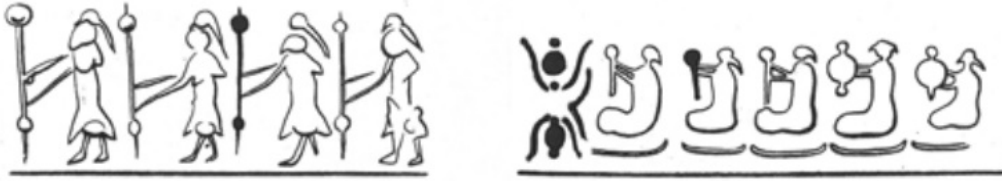
Görsel 1: Eğirici kadın tasvirleri, Cemdet Nasr dönemi, Mezopotamya

Antik Mezopotamya'da kadınlar tekstil ürünlerini önceleri hane içinde aile ihtiyaçlarını karşılamak için üretmiş, sonraları onların bu kabiliyetleri ticaret ağlarına entegre edilmiştir. Öyle ki tekstil işçiliği, dönemin ticaret hukuku metinlerinde “kadın mesleği” olarak aktarılmıştır. Çalışma alanlarının tümü cinsiyetlidir ve her toplum eril ya da dişil olduğuna dair kendi meslek kavramlarını üretmiştir. Kültürlenme sürecinin başlangıcı sayılabilecek olan Antik Mezopotamya'dan günümüze kalan tekstil ürünlerinin tasvirleri ve belgeleri mevcuttur. Şematik gravürlerde tekstil ürünlerinin yapılışı ve üretici aktörünün kadınlar olduğu görülmektedir (Görsel 1 ve Görsel 2).