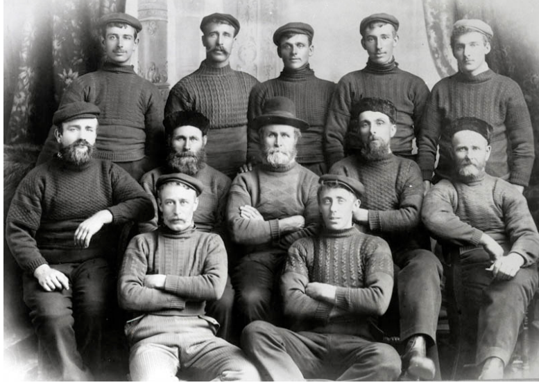
Görsel 6: Gansey kazaklar

Kadın kimliğinin inşasında el örücülüğünün analizini yapan Abrams (2006), Shetland Adaları örneğini incelemiştir. Buna göre, bölgede ticari faaliyetin merkezinde yer alan el örücülüğü kadın merkezli bir kültür yaratmıştır. Abrams (2006), Shetland Adalarında 19. ve 20.yüzyılda yünlü el örmesi giyim ana ekonomik faaliyet haline gelmesinin nedeninin kadınların kilit bir emek performans sergilemeleri olduğunu söylemiştir. Buna göre bölgede örücü kadınlar örme giyim piyasasını ticarete entegre etmiş ve geniş çevrede ekonomik ilişkilere dayanan bir kimlik yaratmışlardır. 1920'lerde Galler Prensi tarafından popüler hale getirilen ada desenli kazaklar bölge örücülüğünün kimliği haline gelmiştir. Bugün dahi kadınların ürettiği bu el örgüsü ürünler Shetland'ın kendini dış dünyaya tanıtmaya araçlarından biridir. Farklı renklerle oluşturulan geleneksel bir örme tekniği olan Fair Isle'ı kullanarak yüksek kaliteli el örgüsü ürünler üreten kadınlar, deniz aşırı pazarlarda çalışmaları için yüksek fiyatlar talep edebilir güçte ve durumdadır. El örmesinin Shetland geleneği ve kültürünün bir sembolü olarak konumlandırılması, günümüze değin büyük yankı uyandırmıştır. Bir kadın faaliyeti olan örücülük çok dar bir ekonomik temele sahip yer olan adaları kalkındırmıştır. Shetland'da ürünlerin takas edildiği nakitsiz bir ticaret sistemi kadınların karşılıklı bağlantıları üzerine kurulmuş ve örücülükte kadınların üretici kimliğini daha da şekillendirmiştir (Abrams, 2006, s.150-153).