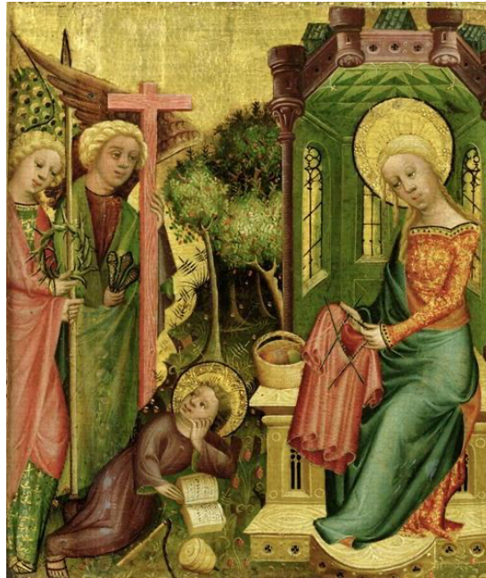
Görsel 4: “Visit of the Angel” Buxtehude Altar, Almanya

Örücülüğün domestik bir kadın pratiği olarak görülmesi modern bir olgu değildir. Orta çağ Avrupası'nda, özellikle 14. Yüzyıl İtalyan ve Alman resminde, ressamalar pek çok kadın örücü resmetmişlerdir. Motifleşen örücü kadın figürünün Erken Rönesans döneminde Meryem ile aktörleştiği görülür (Görsel 4). Steele (2005) Orta çağ Avrupası'nda örmenin genellikle kilise ile ilişkilendirildiğini bu sebeple Erken Rönesans resimlerinin pek çoğunda örgü ören Madonna motifinin görüldüğünü söylemiştir (Steele, 2005, s.308). Rutt (1989) örgü ören Madonna motifinin yoğunlaşmasının nedeninin Meryem'i kutsal bir kadın karakter olarak, alçakgönüllü ve domestik bir alana yerleştirmek olduğunu düşünmektedir (Rutt, 1989, s.44). Örücülük, kadın emeğine dayanan bir üretim olarak mütevazılığa ve evcillığe dair çağrışımlar yapmayı günümüzde de sürdürmektedir.