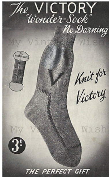
Görsel 10: II. Dünya Savaşı Dönemi Örme Yayımları

Savaş dönemindeki örücülük faaliyetlerine yönelik örme desen yayıncıları ve iplik şirketleri, bu amacı desteklemek için yayımlar yapmıştır. Zafer sloganlarıyla hazırlanan yayınlarda kar maskeleri, çoraplar ve eldivenler dâhil olmak üzere, cephe giyimi için ayrıntılı talimat broşürleri hazırlanmıştır (Görsel 10). Amerikan başkanının eşi Eleanor Roosevelt ve İngiltere Kralı George VI'nın eşi Kraliçe Elizabeth söz konusu yayımlar için poz vermişlerdir (Black, 2012, s.137).