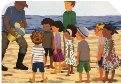
Şekil 3. Karakterlerin Aksesuarlarına İlişkin Bir Örnek

Haydi Sayalım, Denizler; (Formento, A., 2020)