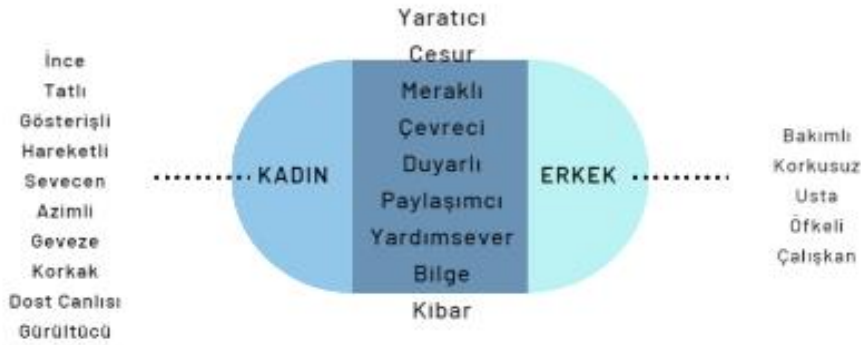
Şekil 21. Karakterlere Atfedilen Sıfatlar

Şekil 21’de görüldüğü gibi kadınlara fiziksel görünüş için daha fazla sayıda (ince, gösterişli, tatlı) sıfat kullanılırken erkeklerin dış görünüşü için sadece “bakımlı” sıfatı kullanılmaktadır. Kadın karakterler için “korkak” sıfatı kullanılırken erkek karakter “korkusuz” olarak tasvir edilmektedir. Kadınlar “dost canlısı, sevecen” gibi olumlu kişilik özellikleri ile tasvir edilirken erkekler için “öfkeli” sıfatının kullanıldığı görülmektedir. Öte yandan, yaratıcı, meraklı, çevreci, kitapsever, paylaşımçı, yardımsöver, kıbar gibi olumlu sıfatların kullanımında eşitlikçi tasvirlerin olduğu görülmektedir.