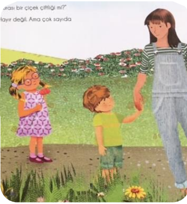
Şekil 7. Kadın Karakterlerin Mesleksel Rollerine Dair Bir Örnek. Çiftlikte; (Milbourne, A., 2013)