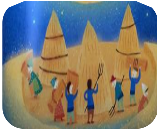
Şekil 4. Dış Mekân Tarla Olan Bir Örnek Haydi Sayalım, Ağaçlar; (Formento, A., 2020)