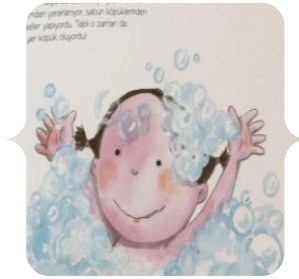
Şekil 17. Çocuk Bakımı. Beril Kendi Resmini Yapıyor; Roca, N. & Isern, C. (2019).