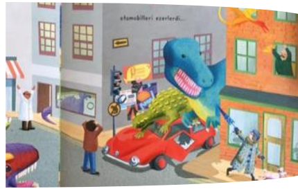
Şekil 5. Dış Mekân Sokak Olan Bir Örnek Dinozor; (Milbourne,A., 2019)