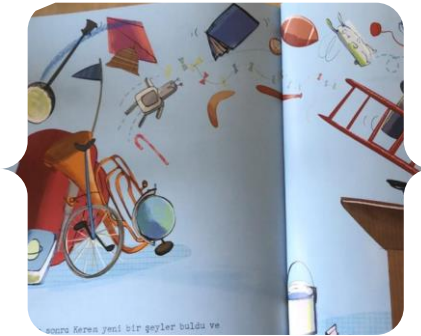
Şekil 13. Erkek Karakterin Araç Gereçleri İçin Bir Örnek Origamiyle Bilim: Kayaçları Öğreniyoruz; Braun, E. (2018).