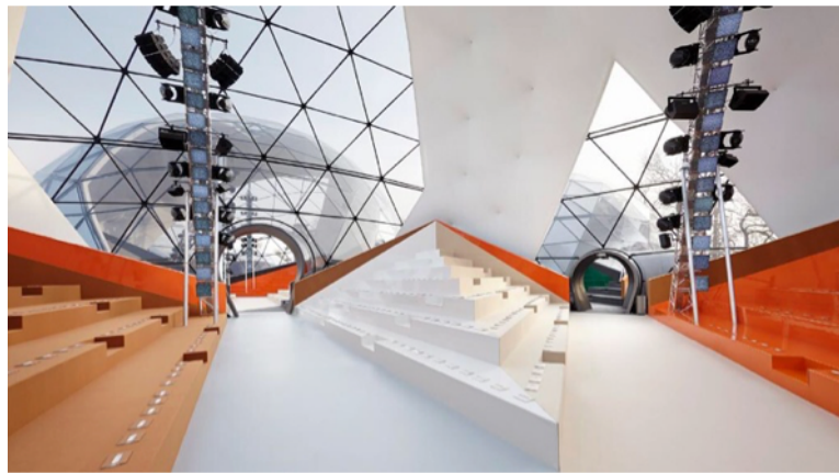
Resim 8. Es Devlin, 2015, Louis Vuitton'un 2015 Sonbahar/Kış Kreasyonu Set Tasarımı, 2015 Paris Moda Haftası

Tasarladığı mekanlarla moda tasarım gösterilerini de şekillendiren Es Devlin, Louis Vuitton için 2014 / 2015 senelerinde Paris Moda Haftası defilesi için üç birleşik kubbeden oluşan bir mekan tasarlamıştır. Bu mekanlarda 1970'lerin bilimkurgu ve apokaliptik filmlerini andıran bir dünya yaratmayı hedeflemiştir (Jays, 2015).