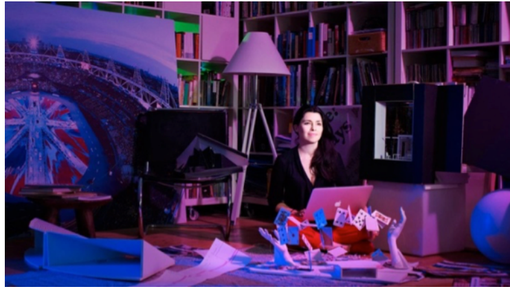
Resim 1. Es Devlin, 2014

Es Devlin, gösteri sanatlarının farklı uygulama alanlarında bulunarak ve bu farklı türler arasında görsel bir bağ kurulmasını sağlayarak, sahne tasarımı anlayışını daha özgür ve cesur hale getirmiştir. Bu makalede Es Devlin'in eğitim hayatından başlayarak, kariyerinde öne çıkan sahne tasarımları ve mekan yaratmadaki yaklaşımı ele alınmıştır.