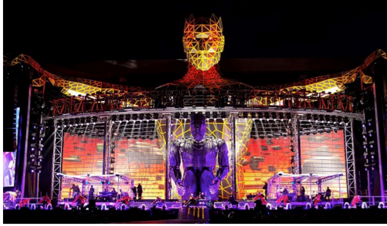
Resim 6. Es Devlin, 2011, TakeThat “Progress” turnesi sahne tasarımı.

Devlin, 2005 yılı sonrasında Kanye West’in TouchtheSky, Glow in the Dark, Watch the Throne ve Yeezus turne sahnelerini tasarlamıştır. Şarkıcının da sanat ve mimariye olan ilgisi, görsel estetik konusunda iletişimlerini kolaylaştırmıştır. Bu dönemde Devlin’in Kanye West’i Covent Garden’daki Salome operasına davet etmesi ve gösteri sonrası bu etkiyle West’in gelecek konser turnesinde sahneye orkestra dahil etmeye karar vermesi, iki ayrı sahne şovu arasında bir nevi köprü kurulmasına vesile olmuştur. Opera ve pop konserleri, teknik olarak birbirinden ayrılrsa da atmosfer ve illüzyon yaratma konusunda temel hedefleri aynıdır (Wroe, 2012).