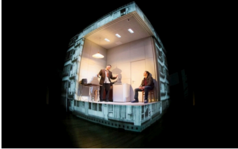
Resim 2. Es Devlin, 2013, “Chimerica” Sahne Tasarımı, Almeida Theatre, Londra.

oluştururken, fotoğraf çekme metaforunu tercih edip, kamera mekanizması ve parçaları üzerine yoğunlaşmıştır. Bu mekanik etmenler, gösterimin bir parçası olmuştur. İçerisinde üç oda barındıran yarı saydam basit bir küp tasarlamıştır. Küp, her bir odanın görülebilmesi için döndürülebilir hale getirilmiştir.(Resim 2) Tasarımın da etkisi ile senaryo her provada değişime uğramıştır (Williams, 2015).