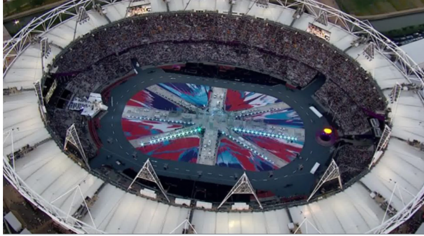
Resim 7. Es Devlin, 2012, Londra Olimpiyatları Kapanış Seremonisi, Londra Olimpiyat Stadyumu.

parçası polisler tarafından güvenlik/sağlık denetimi sırasında çöplüğe atılmıştı. Böylesine büyük organizasyonlar, böyle büyük kazaları da beraberinde getirebiliyor. Ama yine de binlerce gönüllü performansçı sayesinde gösterinin görkeminden ödün verilmedi (Walden, 2013).