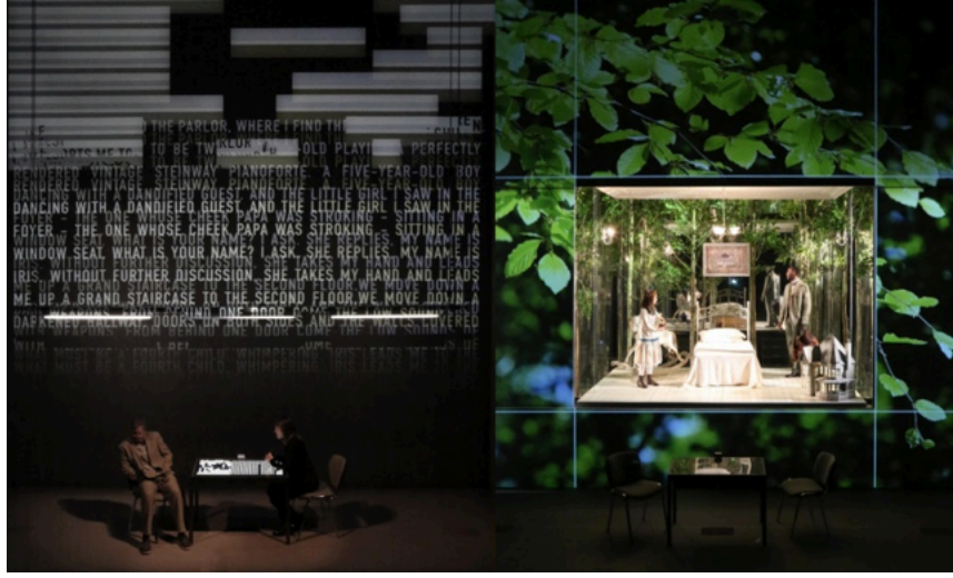
Resim 3. Es Devlin ,2014, “TheNether” oyunu sahne tasarımı. Royal Court Theatre, Londra.

gerçek dünyada yok olmuş ağaçları özlemektedirler. Dolayısıyla tasarımın, içgüdüsel olarak kayıp ağaçlardan oluşturulmasına karar verilmiştir. Bu sırada ihtişamlı yeşil kavak ağaçlarının hışırtıları ve parıltılı aynalarla çevrili, sihri ve aynı zamanda gerçekliği barındıran Viktoryan bir evin içi resmedilmiştir (Resim 3). Ormanın ortasındaki bu ev, karakterlerin sanal internet dünyasından kaçtıkları gizli bir sığınaktır. Bu oyun, Margeret Atwood'un tabiriyle “olası bir gelecek” üzerine düşünceyi tartışmaktadır (Williams, 2015).