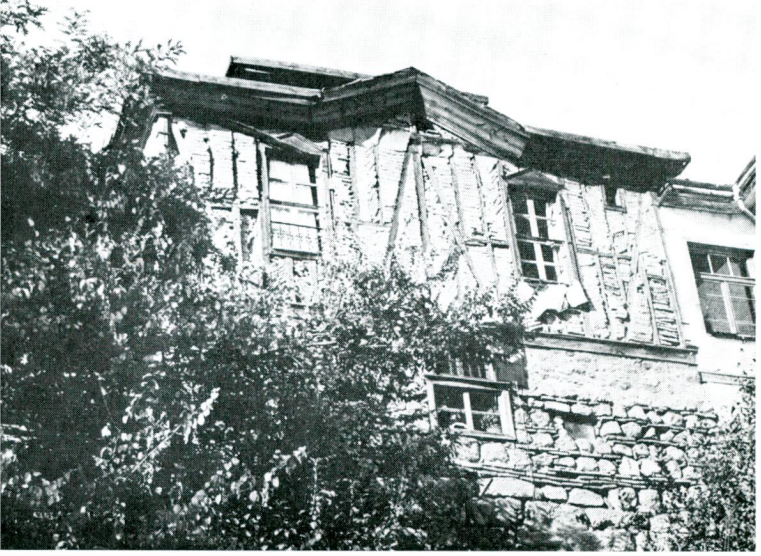
Res. 3 — Dış Hisar Yayçeken Sok. No.: 12. (Atpazarı Meydanından görünüş)