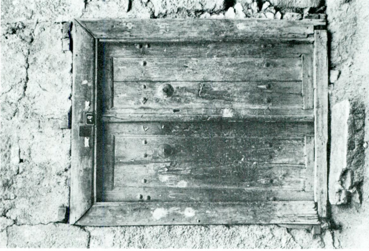
Res. 6 — İç Hisar Ali Taşı Sok. No.: 9.