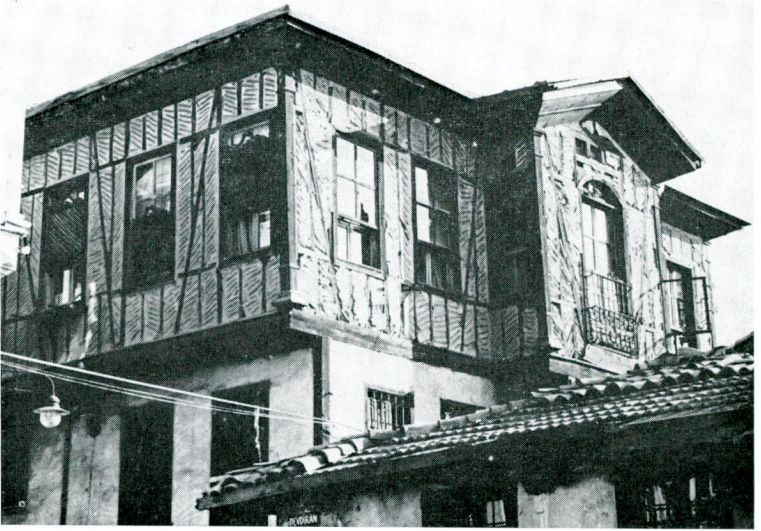
Res. 4 — Dış Hisar Kale Kapısı Sok. No.: 18