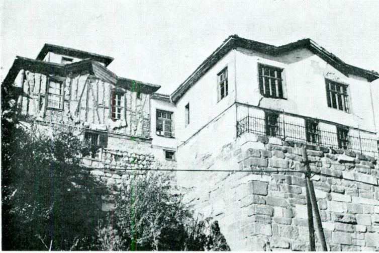
Res. 2 — Dış Hisar Yayçeken Sok. No.: 12-14 (Atpazarı Meydanından görünüş)