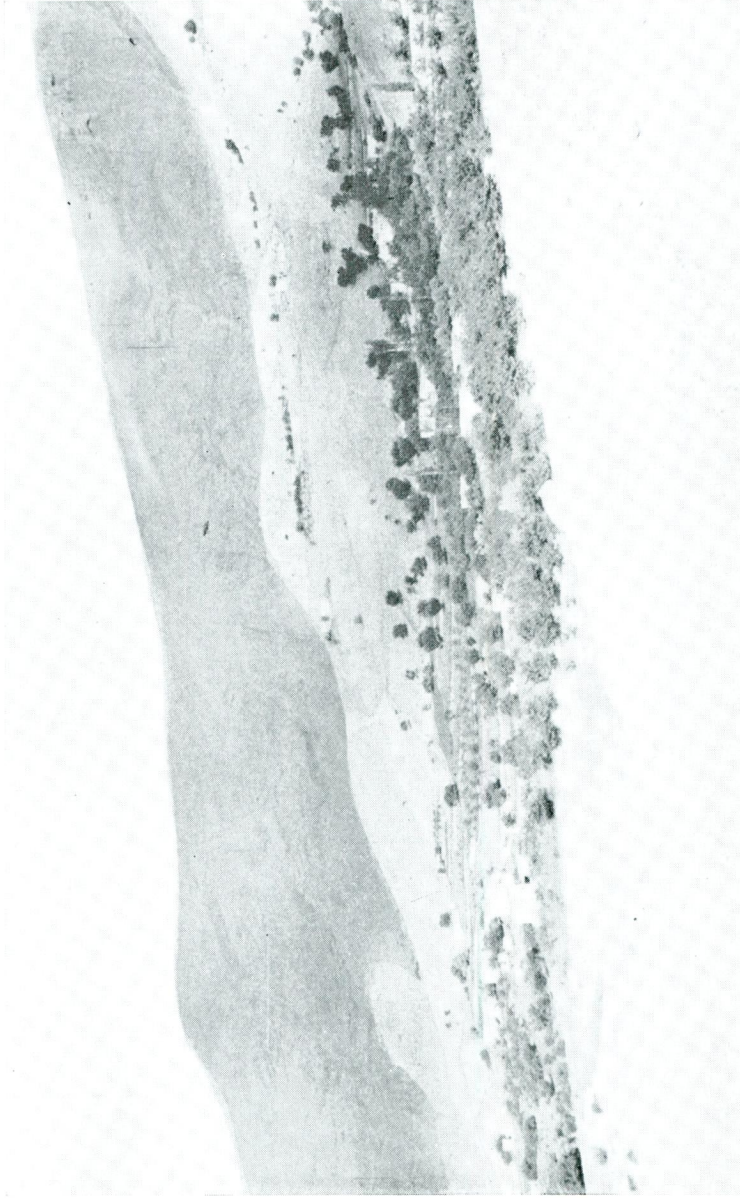
Res. 1 — Samah (Malatya)