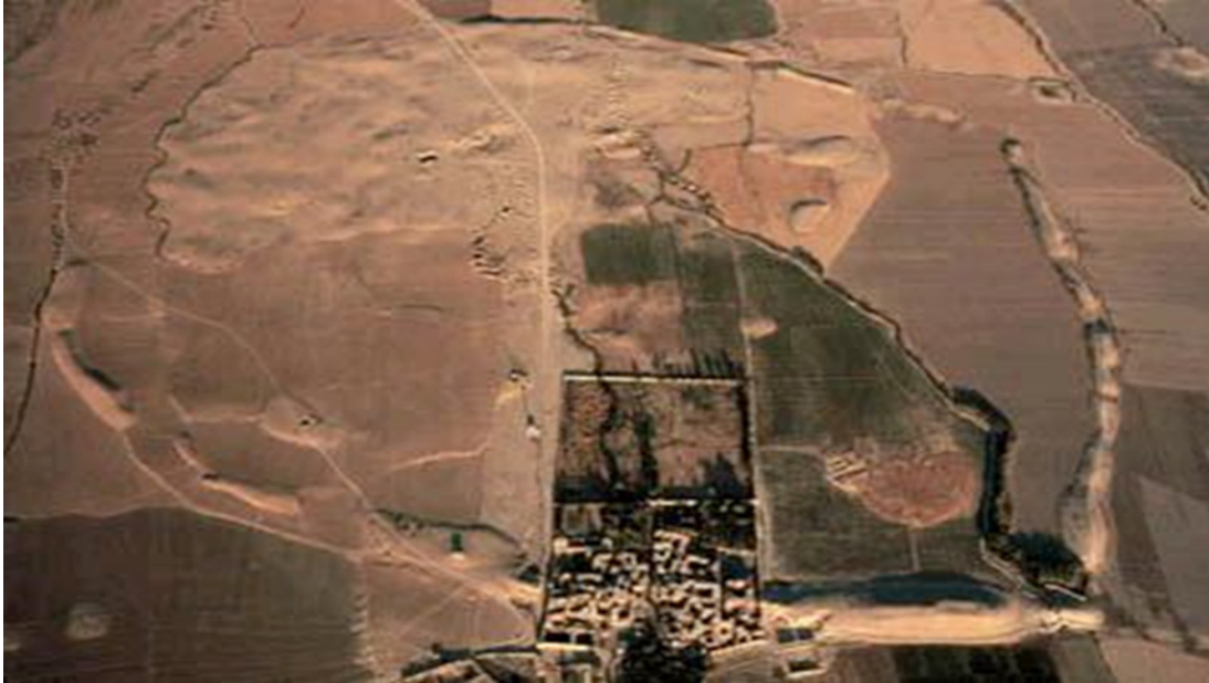
Resim-2: Antik Anşan Şehrinin Kalıntıları

( http://penn.museum/sites/malwebsite/ )