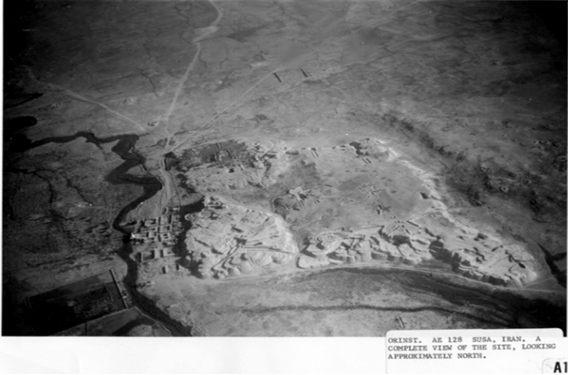
Resim-1: Antik Susa Şehrinin Kalıntıları