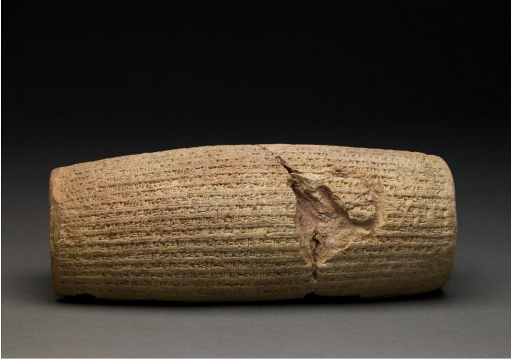
Resim-5: II. Kyros'un Silindir Kitabesi

( http://oi.uchicago.edu/gallery/iran-aerial-survey-flights#10B10_72dpi.png )