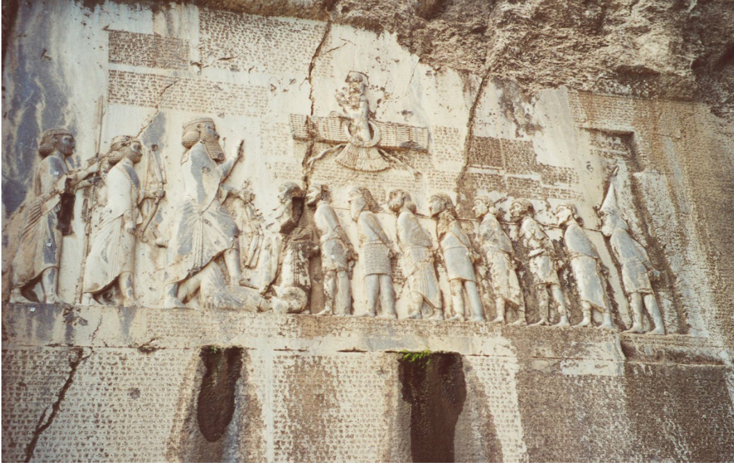
Resim-3: I. Darius'un Behistun Kitabesi

( https://www.awesomestories.com/asset/view/Behistun-Inscription-Cuneiform-at-Bisitun-Persia )