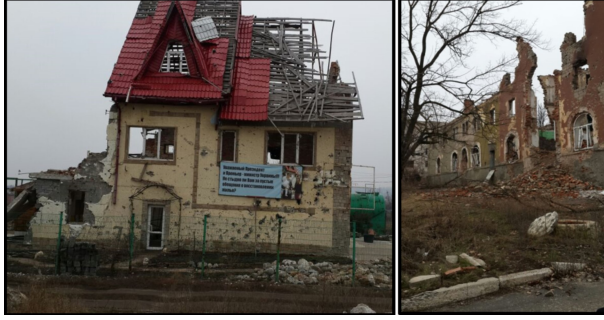
Fotoğraf 1. Slovyansk şehri yakınlarında çatışmalarda zarar görmüş bazı binalar. Photo 1. Some damaged buildings near Slovyansk city.

büyük kısmı ise Geyikli'deki Toki konutlarına yerleştirilmiş olmakla birlikte, Üzümlü merkezdeki C, D ve E bloklarına yerleştirilenler de olmuştur (Şekil 3).