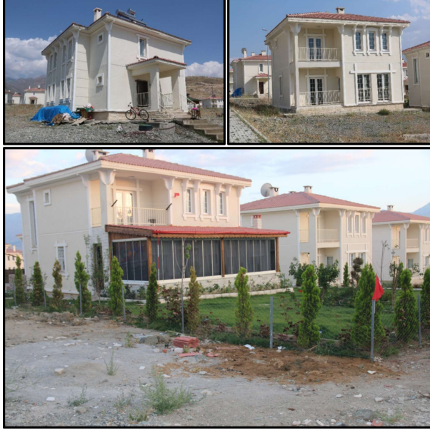
Fotoğraf 3. TOKİ tarafından yapılan ve Ahıska Türklerinin yerleştirildikleri çağdaş konutlardan örnekler.

bahar yarıyılı ile beraber, öğrenciler normal öğrenimlerine devam etmişlerdir. Ancak lise öğrencileri için kaynaştırma kursları devam etmektedir. Sağlık kuruluşlarından hiçbir engel olmadan yararlanabildiklerini ifade eden Ahıska Türklerinin böylelikle temel ihtiyaçlarının karşılanması açısından desteklendiği görülmektedir.