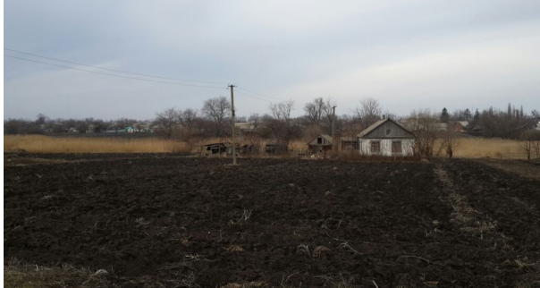
Fotoğraf 2. Ahıska Türklerinin Ukrayna'da yaşadığı köylerdeki (Volkova) tarım arazilerinden bir görünüm. Photo 2. An image of agricultural land where the villages (Volkova) that Ahıska Turks used to live in Ukraine.