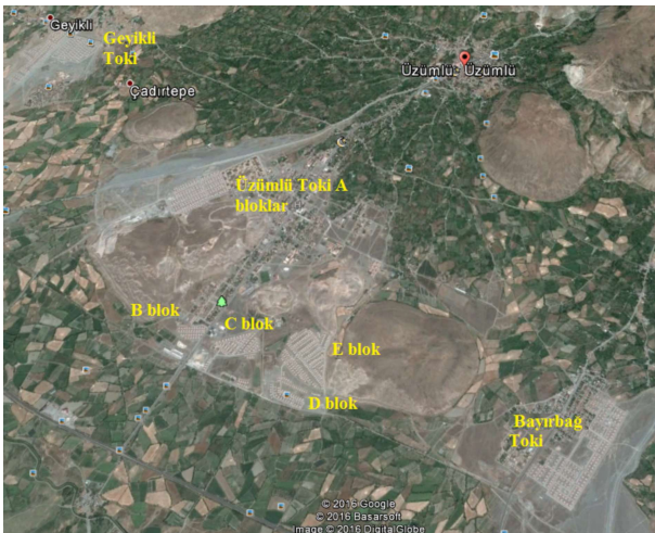
Şekil 3. Üzümlü ilçesi ve ilçedeki TOKİ konutlarının Google Earth görünümü. Figure 3. Google Earth images of Üzümlü district and TOKİ residences in there.

Ahıska Türklerinin ilçeye yerleştirilmesinin belli etaplar dâhilinde yapılması planlanmaktadır. I. Etap olarak kabul edilen 151 ailenin iskânı, iki aşamada gerçekleşmiştir. Bunlardan ilki, 25.12.2015 tarihinde ilçeye getirilen 117 aile ve 488 kişiden oluşan gruptur. Bu grubun 259'u erkek, 229'u da kadındır. Bunların önemli bir kısmı, Ukrayna'dan gelmiş olmakla beraber, bu grupta Azerbaycan ve Gürcistan'dan gelen 6 kişi de vardır. Ay-