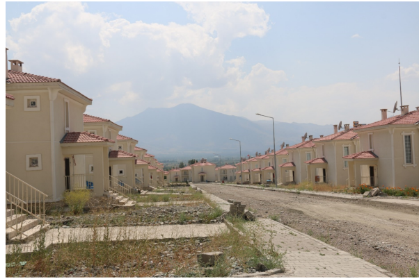
Fotoğraf 4. Kapılarındaki Türk Bayrakları ile anavatan sevgilerini de sergileyen Ahıska Türklerinin yerleştirildikleri konutlardan bir görünüm.

Photo 3. Examples of contemporary housing that built by TOKİ were placed of Ahıska Turks.