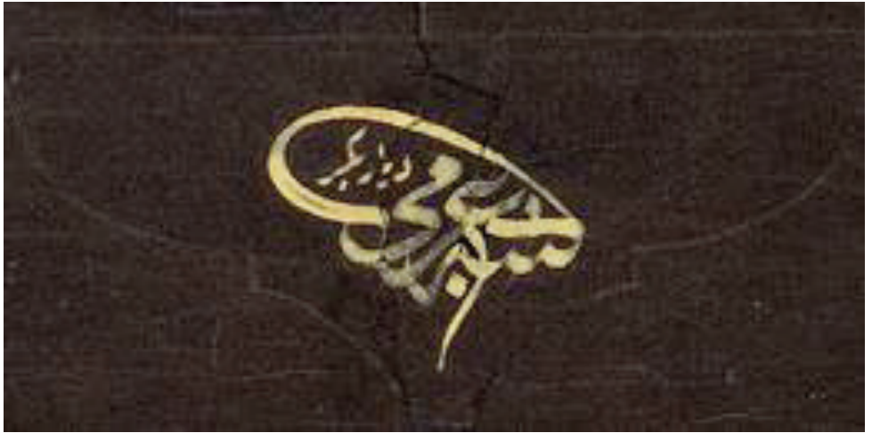
Foto. 4: Osman Hulüsi Paşanın Mezar taşı Kitabesinin Kalıbından İmza Detayı