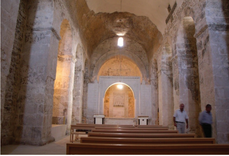
Resim 10 - Tur 'Abdin , Kefr Zeh köyündeki kilisenin iç mekânından görünüm.

Mor Yuhannon'un 12. yüzyılda Mardin merkezinde inşa faaliyetleri açısından oldukça aktif olması da kilisenin bu dönemde inşa edilmiş ya da büyük ölçüde restorasyon görmüş olma ihtimalini güçlendirir. Bugün Harput'ta mimari süsleme hiç yoktur. Bu nedenle tarihlendirmeye yarayacak önemli bir verimiz eksiktir ancak kemerlerin bitimi, ablak taş döşemesi ve taşların büyüklükleri 8. yüzyıl ile 12. yüzyıl arasında bir tarihe işaret etmektedir.