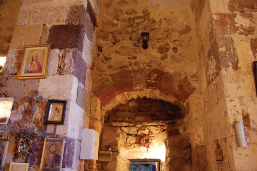
▼ Resim 7 - Kilisenin giriş kapısı üzerindeki kemer ve payelerdeki renkli taşlar.