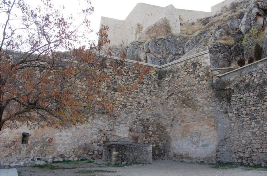
Resim 8 - Kilisenin kuzey cephesi. Arka planda kale görülmektedir.