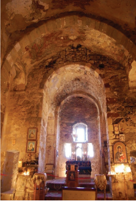
Resim 3 - Kilisenin apsisi.