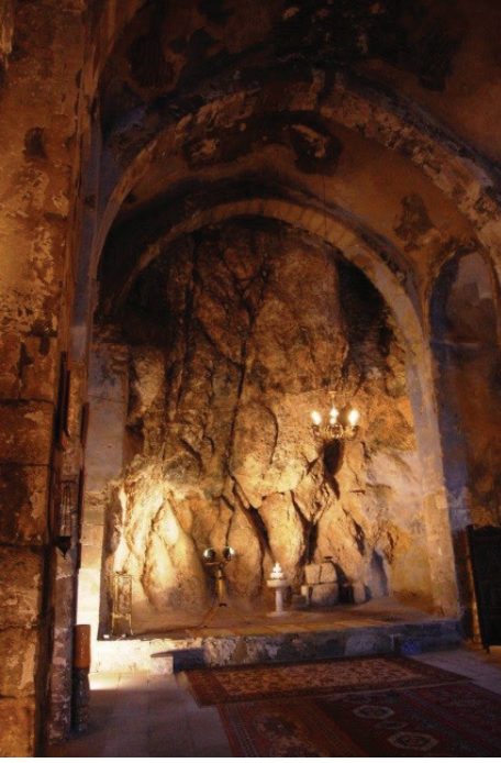
◀ Resim 6 - Kilisenin batı duvarı.