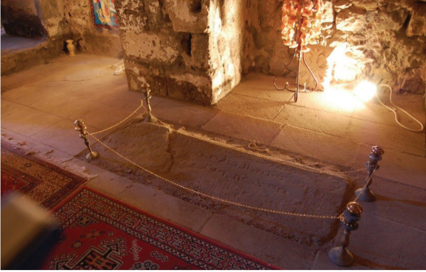
Resim 1 - Kilisenin naosunun yer döşemesindeki mezar kitabesi.

bu kitabeyi yanlış yorumlamıştır. Kitabenin tarihinin Yunan yılı olduğunu düşünüp 1639'a tarihlenmiştir 33 ancak Dolabani'nin dediği gibi kitabe 1950'lerdeki restorasyona tekabül etmektedir. 34