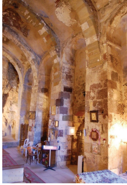
Resim 4 - Kilisenin kuzey duvarındaki payeler.