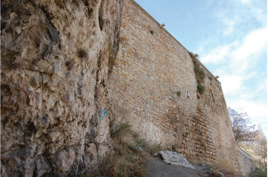
Resim 9 - Kilisenin doğu cephesi.