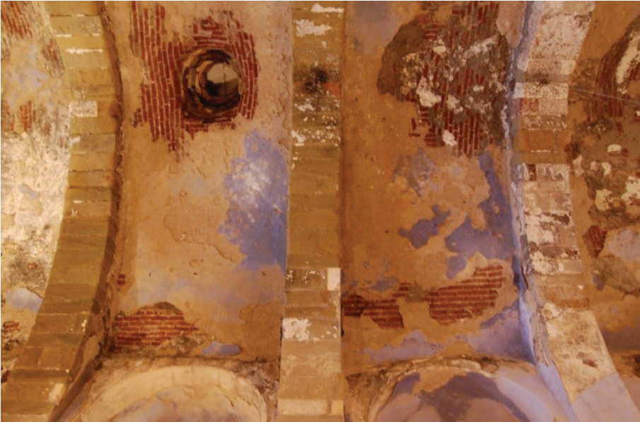
Resim 5 - Kilisenin tonozundaki taş kemerler ve tuğla tonozlar.