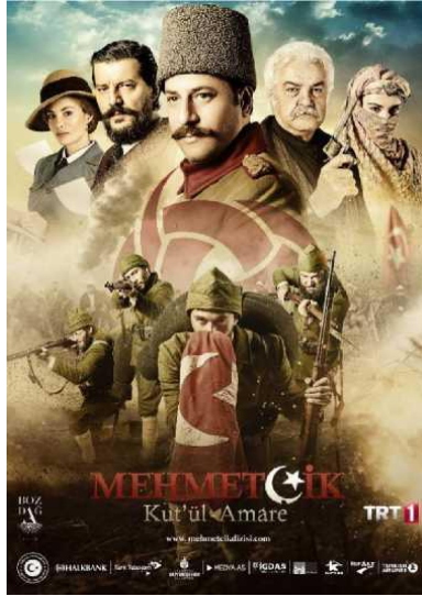
Görsel 12: Mehmetçik Kut'ül Amare dizi posterini