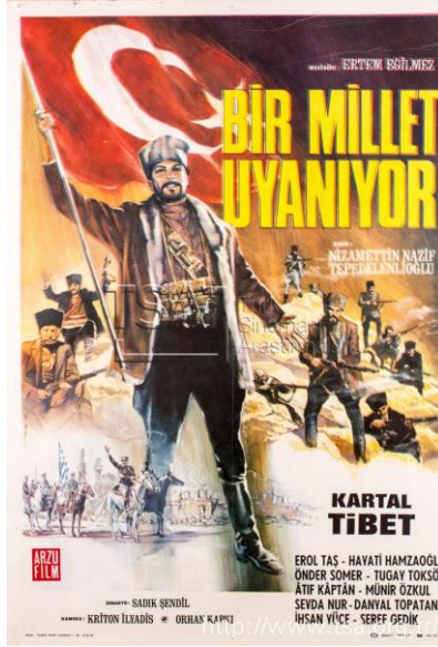
Görsel 9: Kartal Tibet, Bir Millet Uyanıyor afişi

amaçlarla çarpıtılmasına karşı yazılmış olmak iddiasıyla dikkat çeken belgesel çalışma olarak üzerinde ayrıca durulmayı hak eder. Özakman Diriliş: Çanakkale 1915'i kısaltarak “ortaöğretim öğrencileri ile Çanakkale Savaşını kısaca ve doğru öğrenmek isteyenlere, ev hanımlarına, esnaflara, zanaatkârlara ve Mehmetçiklere yardımcı olmak” amacıyla Çanakkale Geçilmez adı altında yeniden yayımlar. Yayınevi tanıtım yazısında kitabın, “yakın tarihimizin dürüst, gerçek, doğru bir kılavuzu niteliğinde” olduğunu belirtir. Yayınevi bir yandan kitabı okuyanların “yalan yanlış, hastalıklı, zehirli iddialardan kuru[nacağını] vurgularken öte yandan okurlara, “başınızı dik tutmanızı, atalarınızın ve ninelerinizin yiğitlikleri ve yurtseverlikleri ile gurur duymanızı, geleceğe güvenle bakmanızı sağlayacaktır” güvencesi verir.