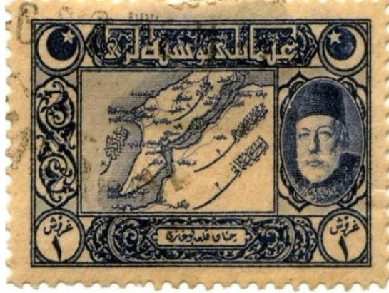
Görsel 4: Sultan Reşat resimli pul

da “Kal’a-i Sultâniyye Müdâfilerine” başlıklı şiirleri yazar. İbrahim Alâeddin [Gövsâ] ise yazdığı şiirleri Çanakkale İzleri başlıklı bir kitapta toplayarak yayımlar. 26