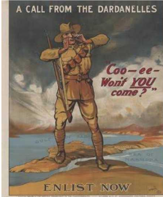
Görsel 1: İngiliz propaganda afişi - "Çanakkale'den çağrı var."