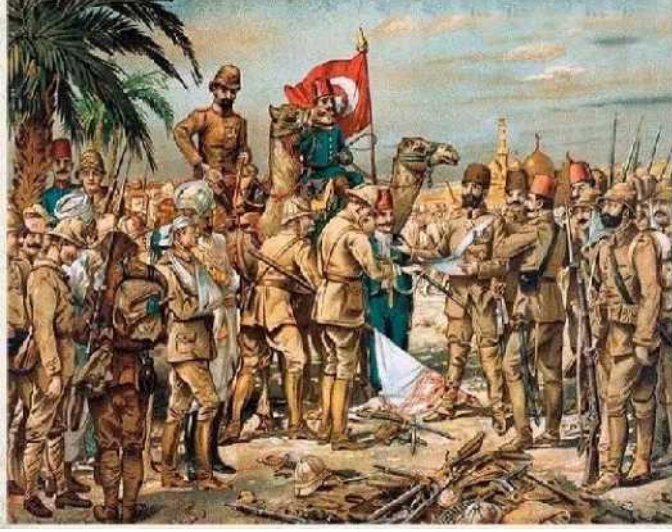
Görsel 11: Kut Zaferi görseli