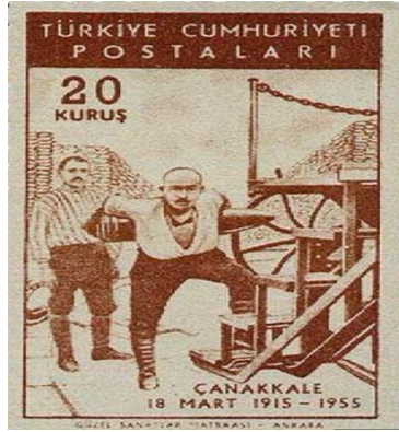
Görsel 6: Seyit Onbaşı temalı 1955 tarihli pul

Bu çerçevede, MTTB'nin 29 Mayıs 1953'te İstanbul'un Fethi'nin 500. yılını anmak için yaptığı girişimlerin hükümet tarafından engellenmiş olduğu belirtilmelidir. 1955'te Çanakkale Zaferi'nin 40. yıl dönümü kapsamlı törenlerle kutlanır. Bu törenleri öncekilerden ayıran farklılık kutlamaların sadece Çanakkale ile sınırlı kalmayıp İstanbul, Ankara ve İzmir'de düzenlenen törenlerle ulusal düzeyde gerçekleştirilmesidir. 52 Anma törenleri Cumhurbaşkanı Celal Bayar ve Adnan Menderes ile birlikte geniş bir ilgili topluğun katılımıyla gerçekleştirilir. Katılımın artışı Çanakkale Savaşları'nın araçsallaştırılması ile sağlanacak siyasal getirinin farkına varılmasıyla açıklanabilir. 40. yıl dönümü anısına çıkartılan dört posta pulunda, Gelibolu Yarımadası'nın kabartma haritası, Atatürk'ün Çanakkale Savaşları'nda miralay üniforması ile çektiği bir fotoğraf, Nusret Mayın Gemisi ve Seyit Onbaşı'nın top mermisi taşırken ki resmi kullanılır. 50. yıl dönümü törenleri için basılan pullarda ise Mehmetçik Anıtı önünde Türk askeri ile birlikte saygı duruşunda bulunan iki yabancı asker, Çanakkale Şehitler Abidesini ve Gelibolu Yarımadası haritasını gösteren resimler kullanılır.