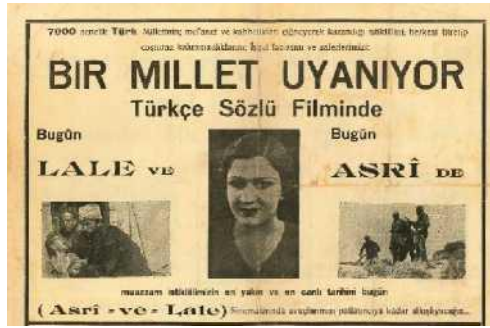
Görsel 8: Bir Millet Uyanıyor tanıtım afişi

Ve Çanakkale - Geldiler, ... Ve Çanakkale - Gördüler, ... Ve Çanakkale - Döndüler adlarıyla yayımlar. Bu türden romanların en son örneklerinden birisi de Buket Uzuner'in onlarca baskı yapan Gelibolu: Uzun Beyaz Bulut romanıdır. Buna benzer efsanevi hikâyeleri ön plana çıkaran birçok yeni eser yayımlanmıştır. 73