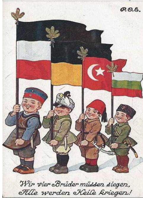
Görsel 3: Bündnispartner Türkei (Müttefik Türkiye) "Biz dört kardeş zafer kazanmalıyız, Herkes kamaları alacak!"

ilerlemeye başlaması üzerine 19. Tümen Komutanı Mustafa Kemal Ordu karargâhından yanıt alamayınca karargâhtan olur almaksızın 57. Alayı çıkarma bölgesine yönlendirir. 4 Kolordu Komutanı Esat Paşa'nın da onayladığı bu emirle 57. Alay düşman ilerleyişini durdurur. Mustafa Kemal bu aşamada askerlerine ünlü, "Ben size taarruzu emretmiyorum, ölmeyi emrediyorum. Biz ölünceye kadar geçecek zaman zarfında, yerimize başka kuvvetler ve komutanlar kaim olabilir" emrini verir. Anzaklar Suvla kumsallarına geri çekilmek zorunda kalır. Köprübaşı'nu genişletmek isteyen General Hamilton'un 12 Ağustos'ta Suvla Koyu'na hâkim Tekketepe'ye yönelik ileri harekâtı da başarısızlığa uğrar. Bölgeye Seddülbahir yöresinden yapılan kaydırma ile gerçekleştirilen büyük yığınak sonrasında 21 Ağustos'ta başlatılan Bomba Tepe'ye yönelik saldırı da sonuç vermez. İkinci Anafartalar Muharebesi olarak bilinen ve 29 Ağustos'ta sona eren çarpışmalar Çanakkale Savaşları'nın son muharebesidir. Yılın geri kalan bölümünde savaş sonuçsuz kalacak siper muharebeleri biçiminde sürer.