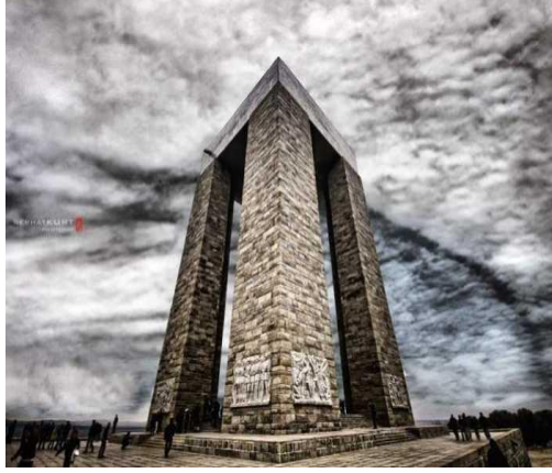
Görsel 5: Çanakkale Şehitleri Anıtı

gidecek kadar kendinde kuvvet de bulamıyor” olmasını sorgulamaktadır. 41