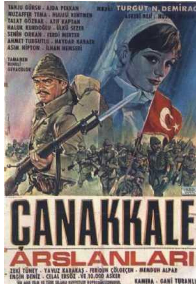
Görsel 10: Çanakkale Arslanları film afişi

1966’da Bir Millet Uyanıyor , Ertem Eğilmez tarafından yeniden çekilir. Çanakkale Savaşları’nın 100. yılı yaklaşırken çekilen belgesel ve kurmaca film sayısında gözle görülür bir artış izlenir. Tolga Örnek’in 2004 yapımı Son Kale: Çanakkale adlı uzun metrajlı belgeseli özeni ve dayandığı kaynakların çeşitliliği ile öne çıkar. 2005’te Avustralya, Yeni Zelanda, İrlanda, Galler televizyonları ile TRT tarafından ortaklaşa yapılan Çanakkale Geçilemedi de benzer konulu filmler arasında farklı bir yere sahiptir. Çanakkale Savaşları’nın yüzüncü yılı nedeniyle yapılan filmler arasında Çanakkale 1915 ; Çanakkale Çocukları ; Çanakkale Yolun Sonu ; Sarı Siyah gibi filmler bulunmaktadır.