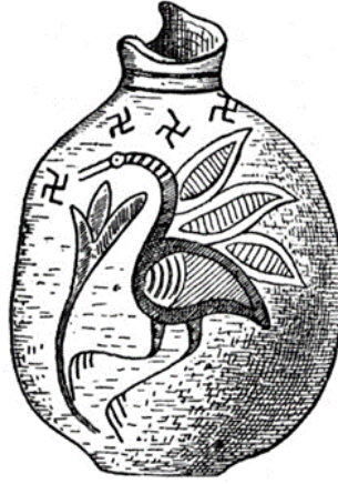
Fig. 10: Troia'dan swastika motifi 40

Troiada halka dipli bir seramik yüzeyinde (Fig. 11) veya Alacahöyük'te mezarda bulunan, bugün Anadolu Medeniyetleri Müzesi koleksiyonunda yer alan Hitit bronz levhanın üzerine kareler şeklinde düzenlenen swastika'nın Anadolu'da dahi örneklerine ulaşmak mümkün olmuştur 41 .