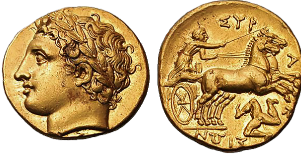
Fig. 5: Agathokles dönemi sikkesi (MÖ 317-310) 21

MÖ 339-334 yıllarına tarihlenen bronz madeni paraların ön yüzünde başı sola dönük, sakallı Zeus Eleutherios başı, arka yüzlerinde triskeles yer almaktadır 22 . Aynı türdeki aynı triskelesi taşıyan diğer örnek ise, bugün British Müzesinde bulunan Sicilya sikkesinin ön yüzünde Persephone'nin başı, arka yüzünde quadriga ve üstte triskeles betiminin yer aldığı sikkede de görülmektedir. En önemli Sicilya darphanesi Syracusa idi. Bu motifin Syracussa'da özellikle Agathokles döneminde tercih edildiği dikkati çekmektedir. Sikkeler üzerinde sürücüsüyle birlikte tasvir