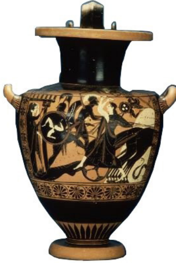
Fig. 2: Kalkan detayında triskeles motifi 13

Beazley'in arşivi incelendiğinde Triskeles motifinin MÖ 6.yy.sonu 5.yy. başında Attik seramik sanatında ressamlar tarafından sıklıkla tercih edilen bir form olduğu anlaşılmaktadır. 10 İsviçre özel koleksiyonuna ait Cenevre HR 84 olarak kayıtlı bir amphora üzerinde triskeles motifi görülmektedir. MÖ 540 yılına tarihlenen Princeton Ressamı'na ait bir 38.9 cm yüksekliğe sahip amphora üzerinde Ajax, Cassandra ve Athena'nın tasvir edilmiştir. Aynı amphoranın ön yüzünde Athena'nın kalkanında beyaz bir triskeles motifine yer verilmiştir 11 . Triskeles kullanımının bir başka örneğini, bugün Boston Güzel Sanatlar Müzesi'nde yer alan MÖ 520-510 yılları arasına tarihlenen Antiope Grubu'na atfedilen hydriada 12 yer alan Akhilleus'un elindeki kalkan üzerinde yer alan dikkat çekici triskeleste görmekteyiz. Bunu, savaşta kendilerini korumak, olasılıkla da kendilerine güç katmak amacıyla kullandıkları görülmektedir (Fig. 2). Bunun benzer örneğine, MÖ 470 yıllarına tarihlenen Lycata yakınlarındaki bir mezarda bulunan ve bugün Sicilya Arkeoloji Müzesi'nde sergilenen, kırmızı figür tekniğinde yapılmış lekythos üzerinde Grek savaşçının kalkanında da rastlanmıştır (Fig. 3).