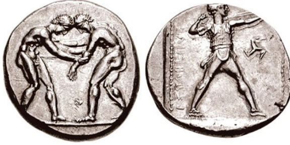
Fig. 14: Aspendos kent sikkesi (MÖ 400-380) 67

Aspendos kent sikkelerinde çok özel bir örnek var ki, o da bir staterin üzerinde ağzı açık bir aslan ile yapılmış tasviridir. Özel olarak darp edilen bu sikkenin Aspendos ve Selge kentlerinin birlik sikkesi olduğu sonucuna varılmıştır 68 . Aspendos dışında diğer şehirler de darp ettikleri madeni paralarda triskeles motifini benimsemişlerdir. Aspendos'ta olduğu gibi Side'de, Selge'de basılmış sikkeler üzerinde triskeles amblemine rastlanmaktadır. Her ne kadar sikkelerde motifin yaygın olarak görüldüğü bölgeler arasında Lykia ve Pamphylia bölgelerini sayıyor olsak da Pisidia Bölgesi'nde de triskelesin tasvirinin olması ilgi çekicidir. Özellikle Pisidia Bölgesi'nin antik kentlerinden biri olan Adada'da Geç Hellenistik döneme tarihlenen sikkelerde de triskeles motifinin varlığına tanık olunmaktadır. Zeus, Herakles, boğa başlarına yer verilmesinin yanı sıra, gücün sembolize edildiği düşünülen triskeles tasvirli sikkeler yer almaktadır 69 . Kilikia Bölgesi'nde Olba sikkelerinin ön yüzünde Hermes tasvir edilirken, arka yüzünde triskeles motifi görülmektedir.