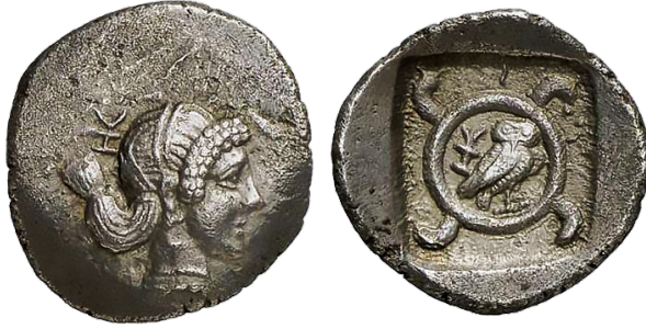
Fig. 12: Kheriga dönem sikkesi (MÖ 440-410) 61