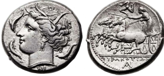
Fig. 6: Syrakusa Kenti Agathokles dönemi sikkesi (MÖ 317-289) 24

edilen quadriga ve arka yüzlerde Sicilya'nın kültürünü ve imajını yansıtan üç adet koşan ayak yani triskeles betimlendiği görülmektedir (Fig. 6) 23 .