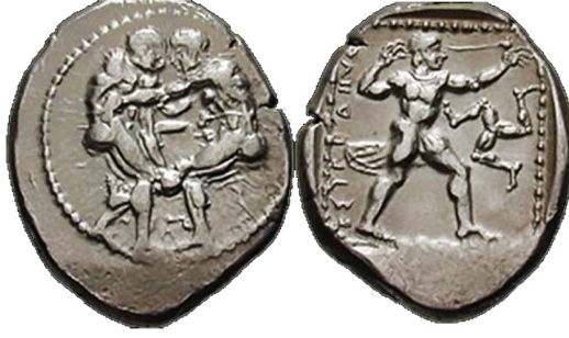
Fig. 13: Aspendos kent sikkesi (MÖ 420-400) 66