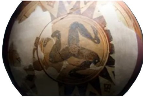
Fig. 1: Sicilya'dan triskelion örneği 9

Triskeles, merkezi bir disk etrafında dizlerden bükülü insan bacaklarının saat yönünde hareket ediyormuş gibi görülmesidir. Ortadaki diskte Medusa başı da yer alabilmektedir 6 . Strabon; antik bir sembol olan motifin adını Sicilya'nın batı, kuzeydoğu ve güneydoğusunda üçgen bir şekilde konumlanan tepelerden aldığını, isminin "Trinacria, Thrinacis" olarak değiştirildiğini söylemiştir 7 . Homeros'un Odysseus'unda olay Scylla ve Kharybdis'in dar boğazlarda yer alması anlatılmaktadır 8 . Sicilya ile anakarası İtalya arasında yer alan Messina Boğazından bahsediyor oluşu çıkarımı yapılabilir. Motifin erken örnekleri Sicilya'da MÖ 7. yüzyılda görülmektedir (Fig.1).