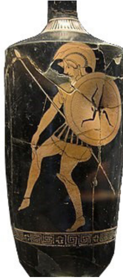
Fig. 3: Lycata yakınlarında bir mezar buluntusu, kalkan detayında triskeles motifi 14

Anadolu dışında Orta Yunanistan'da MÖ 560-510'a tarihlenen Atina örneği drahmi gümüş bir sikke üzerinde triskeles vardır 15 . Bu ender Atina sikkeleri üzerinde yer alan triskeles'in Panathenaic Oyunları'na atıfta bulunduğu ileri sürülebilir. Triskeles, genellikle dairesel bir kalkan görünümü verecek şekilde bir daire içerisine alınmıştır. Bu motifin hem erken dönem vazo ressamı tarafından yaptıkları kalkanların üzerinde dikkat çekici şekilde tasvir edilmesi hem de sikkeler üzerinde bir tip olarak karşımıza çıkıyor oluşu tesadüf olmayabilir 16 . Güney İtalya'daki Grek koloni kentlerinin en erken MÖ 500-480'e tarihlenen darplarının arka yüzlerinde triskelese yer verilmiştir 17 . Sikkelerin ön yüzünde ise Apollon ve Hermes'e yer verilmesinin yanı sıra, rüzgâr tanrısı veya nehir tanrısı olması muhtemel figürler, tarımsal bereketin simgesi olan başaklar kullanılmıştır. Erken dönem bir obol üzerinde Apollon'un yerini triskelesler almıştır 18 . Triskeles, Sicilya'nın eski bir sembolü olup, Miken gemilerinde ve Atina'nın darp edilen sikkelerinin bazılarında da sıklıkla tercih edildiğine tanık olunmaktadır 19 . Daha sonraki dönem sikkelerinde merkezi diskte Medusa başı yerine bir dizden çıkan üç adet bacak