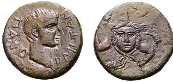
Fig. 15: Augustus dönemi sikkesi 71

Lykia sikkelerinde triskeles motifinin kullanımının benzer versiyonu Augustus Dönemi'nde de görülmektedir. Augustus döneminde basılan Sicilya sikkelerinde ve Afrika darphanelerinden çıkan sikkeler üzerinde de basit görünümünün altında niteliksel olarak sembolün kullanımına devam edilmiştir (Fig. 15).