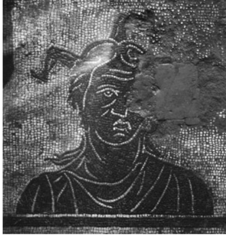
Fig. 17: Ostia'dan mozaik örneği 78