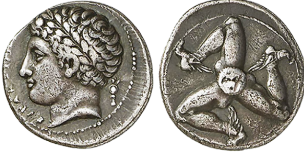
Fig. 4: Agathokles dönemi sikkesi (MÖ 317-310) 20

baskılarda yerini almaktadır. Sicilya sikkeleri üzerinde triskeles tasvirlerini görmek mümkündür. Motifin uygulandığı Agathokles (MÖ 317-289) döneminde basılmış olan ön yüzünde genç Ares'in sola dönük başı, arka yüzünde merkezinde Gorgoneion'un yer aldığı kanatlı üç adet bacaktan oluşan triskeles yer almaktadır (Fig. 4). Syracusa sikke örneğinde ön yüzünde Apollon başı sola dönük şekilde ve boynunun altında bir "Σ" lejandı yer alırken, arka yüzünde bir quadriga ve altında triskeles motifinin tasvir edildiği görülmektedir (Fig. 5).