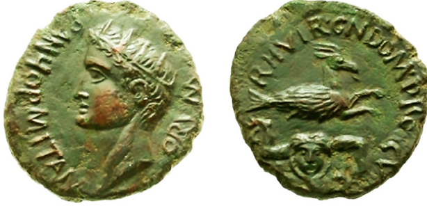
Fig. 16: Tiberius dönemi sikkesi 74

Sikke haricinde Pompeii'deki bir fresko (muhtemelen MS 79 yılı?) üzerinde kadın figürü tasvirinde triskeles betiminin yer aldığı görülmektedir. Bu kadını ön plana çıkararak ise, kadın figürünün başının üzerinde Sicilya adasının kişileştirilmiş hali olarak belirli semboller taşımasıdır ki bu sembollerin başında mısır başaklarının ve triskelesin olduğu bir taç giymiş olmasıdır 75 . Başının her iki tarafında triskeles motifinden kaynaklı olarak iki bacak sarkar biçiminde betimlenmiştir. Bu şekilde ikonografik açıdan triskelesin de kullanılmış olduğu görülmektedir. Roma döneminde triskeles motifi Sicilya'da Ostia'da bir taban mozaikinin üzerinde de bir kadın figürünün baş kısmında triskelesin bir taç gibi saçında kullanılması benzersiz örneklerdendir (Fig. 17) 76 . Mozaiklerde kadın başının üzerinde bir taç gibi triskelesin taşınması sahnesi İmparatorluk sikkelerine bakıldığında örneği mevcuttur. Hadrianus sikkesinde buğday başağı olmadan bir figürün başının üstünde triskeles ile süslenmesi mozaik ile çağdaş olduğu düşünülmektedir 77 .