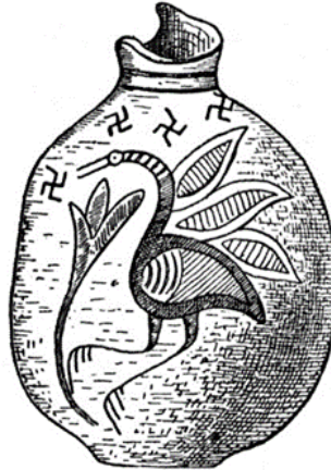
Fig. 9: Kıbrıs vazosu üzerinde swastika motifi 33

Gamalı haç olarak da bilinen swastika, evrensel bir semboldür ve tarih boyunca farklı kültürler tarafından kullanılmıştır. Bu motifin daha çok güneşle özdeşleştirilmesi en yaygın yaklaşım olsa da tüm kültürlerde ona verilen anlamın bu olduğunu söylenemez. Swastika'nın, MÖ 2600 yıllarında Harappa kentinde ortaya çıktığı İndus kültürlerinde bulunması ve kutsal bir sembol olarak günümüze kadar varlığını sürdürüyor olması, bulunduğu bölgenin önemli bir sembolü olduğu düşüncesinin savunulmasına neden olmuştur 32 . Hatta buluntulardan hareketle en eski swastika motifinin kullanımının Zagreb Arkeoloji Müzesinde bulunan MÖ 5. binyıla tarihlenen Neolitik çömlek üzerinde tanımlanıyor oluşu bu durumu desteklemektedir. Dekoratif bir sembol haline gelmeden önce motifin, takılarda ve ev eşyalarında kutsal bir koruyucu görevi vardır. Swastika motifi kendisine seramiklerde, bronz süs eşyalarında ve pantantiflerde de kullanım alanı bulmuştur. Myken dönemine tarihlenen, bugün Metropolitan Müzesinde sergilenen Kıbrıs vazosu üzerinde swastika tasvir edilmiştir (Fig. 9).