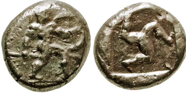
Fig. 7: Aspendos kent sikkesi (MÖ 465-430) 29

Sikkelerin arka yüzlerinde incus içerisinde birincil figür olarak tasvir edildiği gibi (Fig. 7, Fig. 8), aynı sikkelerin arka yüzlerinde figürlerin alt taraflarında ikincil sembol olarak kullanıldığı da görülmektedir. Ayrıca madeni paralar üzerinde görülen triskeles motifinde ayak kısımları yerine ördek başları şeklinde değişik tiplerde tasvir edilmiştir. Mari'de ele geçen silindir mühürde ya da Babil Dönemine tarihlendirilen kabartma üzerinde yapılan ördek tasvirinin su tanrısı ile ilişkilendirilmesi önerisinden 27 yola çıkarak en azından Kuprilli döneminde basılan "S" formlu ördek başı triskelesin 28 de "tanrı ve kutsallık" kavramlarının sembolize edilmesi için kullanılmış olması ileri sürülebilir.